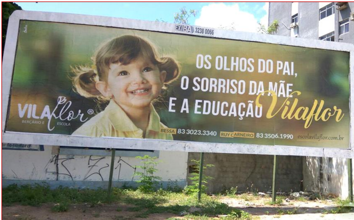
Figura 7: Outdoor – Berçário e Escola Vilaflor