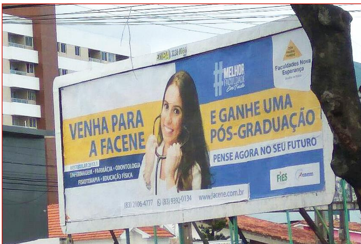
Figura 10: Outdoor – Faculdades Nova Esperança

Fonte: registro fotográfico realizado por mim.