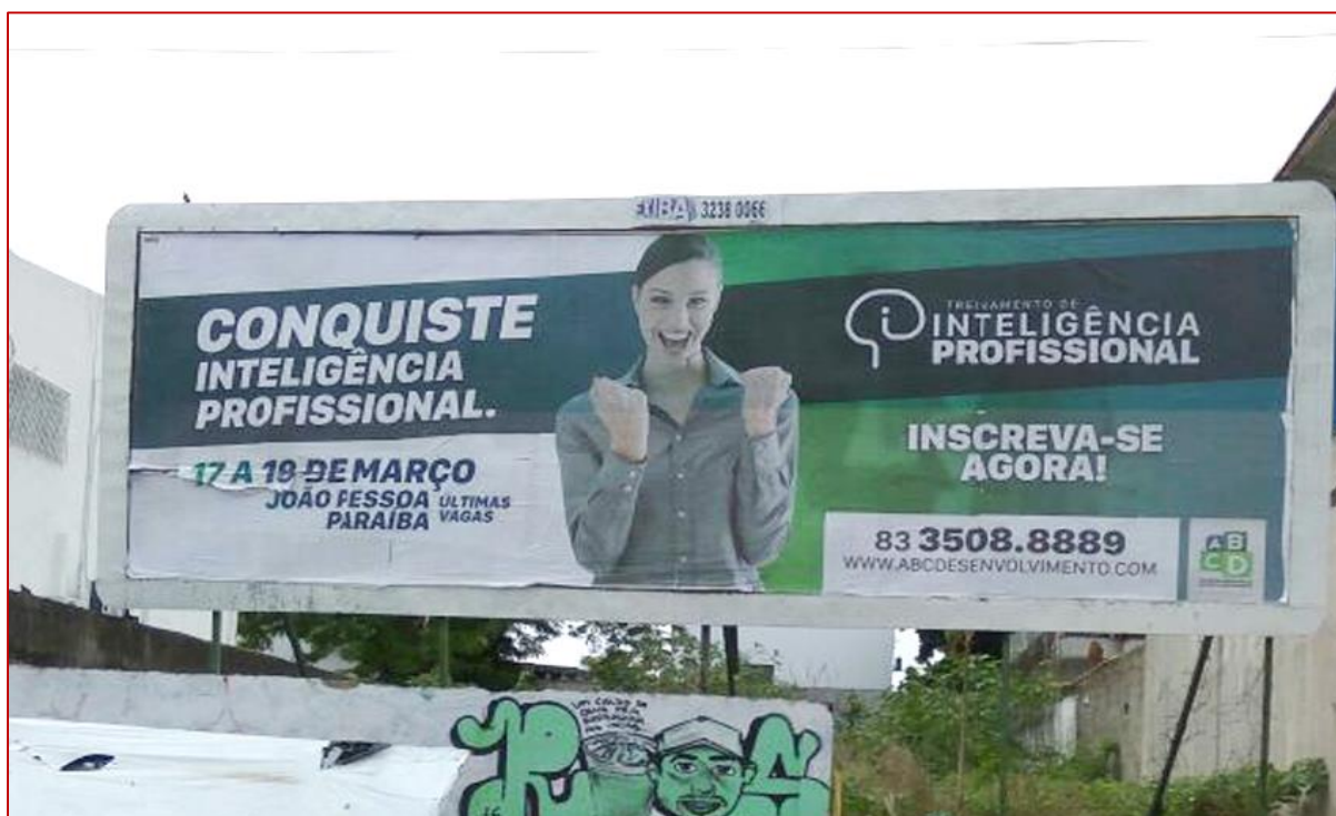
Figura 9: Outdoor – ABCD Desenvolvimento