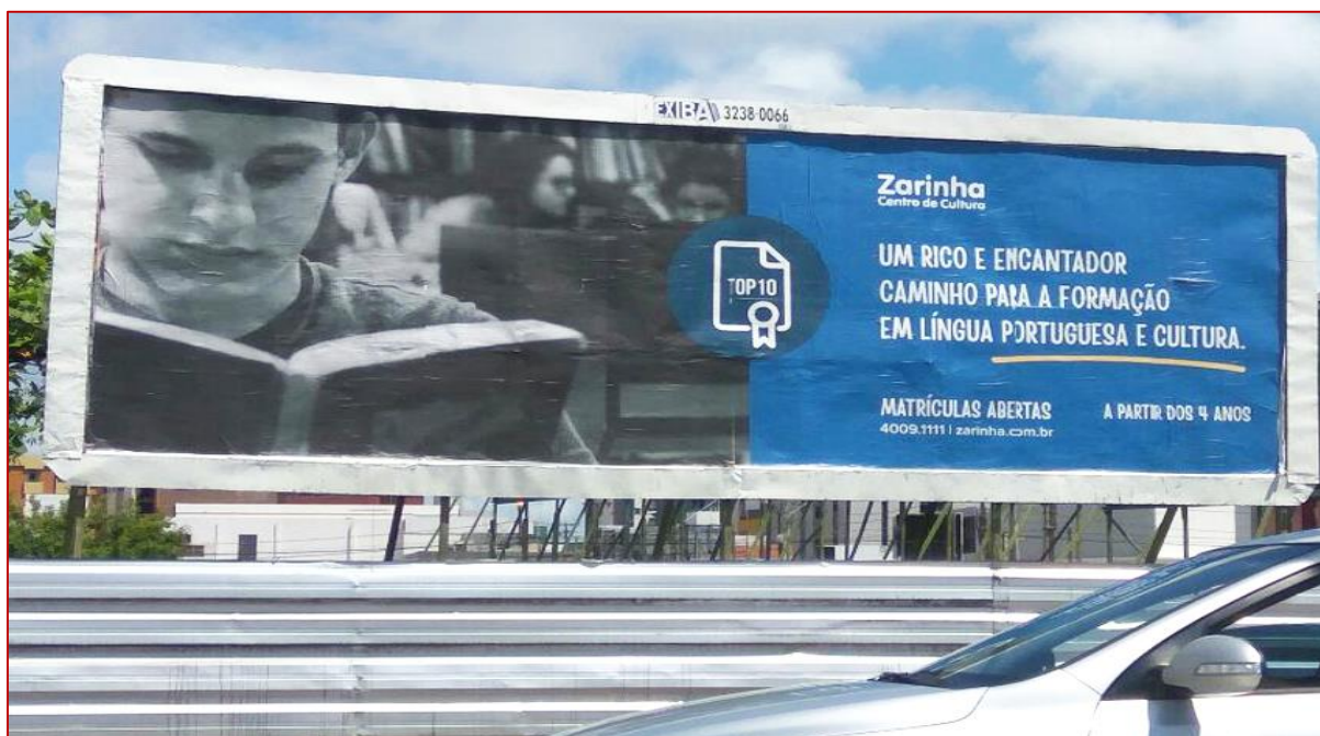
Figura 6: Outdoor - Zarinha, Centro de Cultura