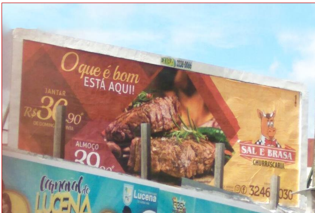
Figura 12: Outdoor – Churrascaria Sal e Brasa