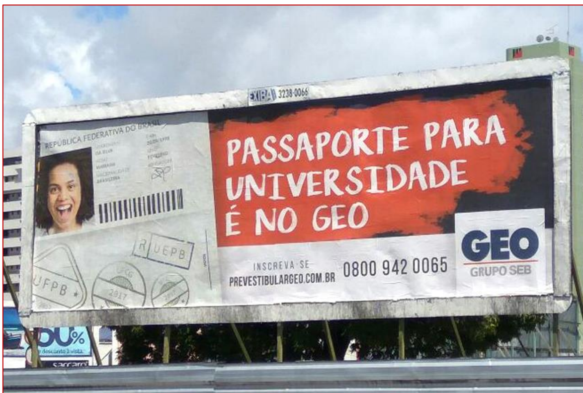
Figura 5: Outdoor – Colégio GEO