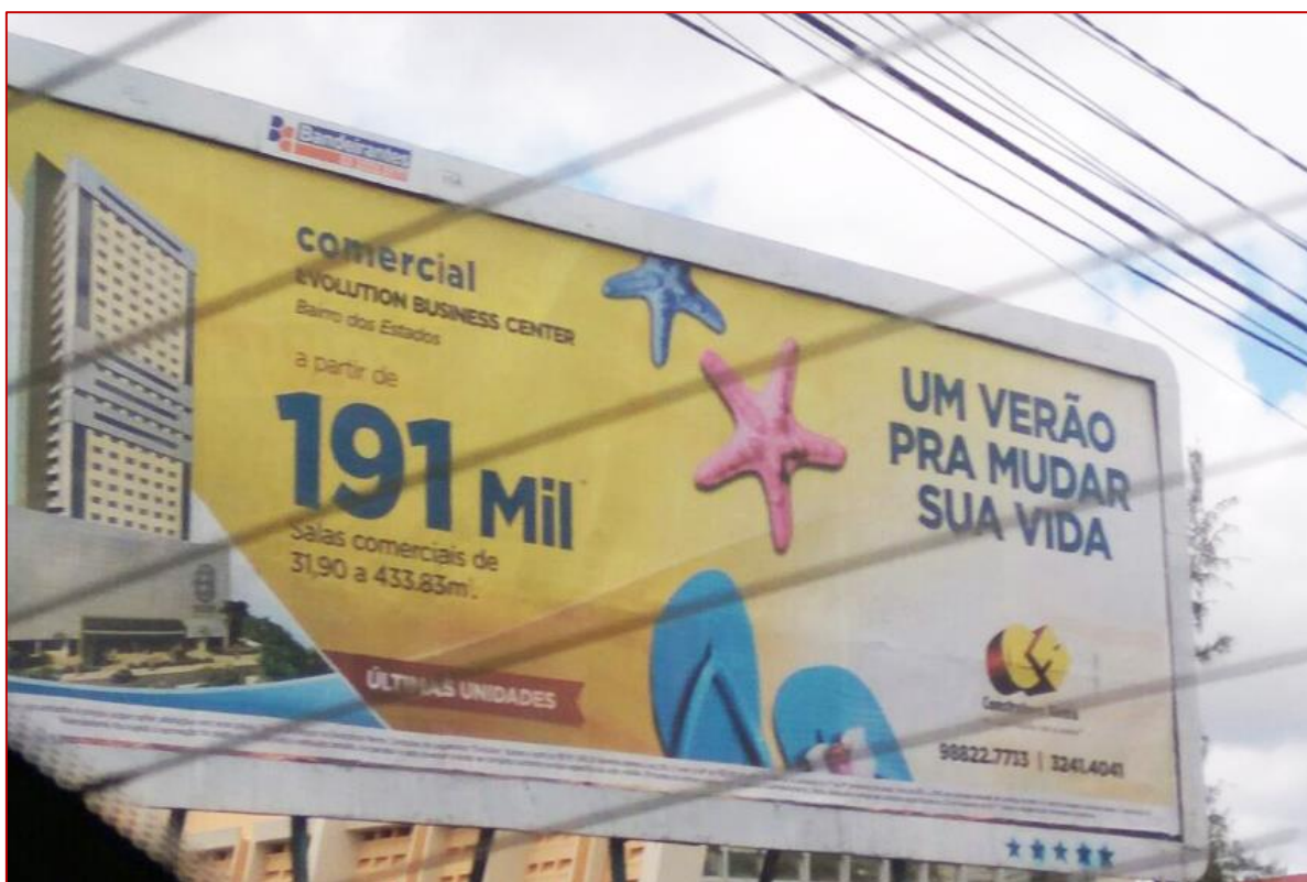
Figura 11: Outdoor – Construtora Hema