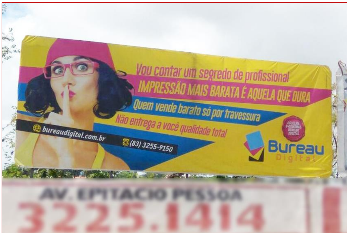
Figura 15: Outdoor – Bureau Digital