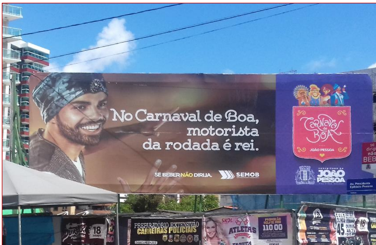
Figura 8: Outdoor – Prefeitura de João Pessoa / SEMOB