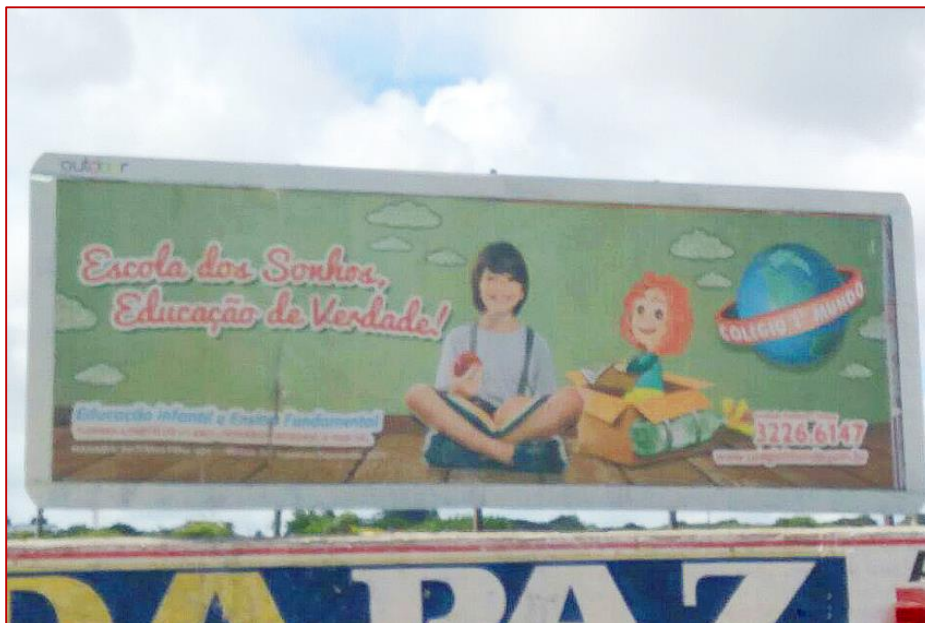
Figura 3: Outdoor – Colégio Primeiro Mundo