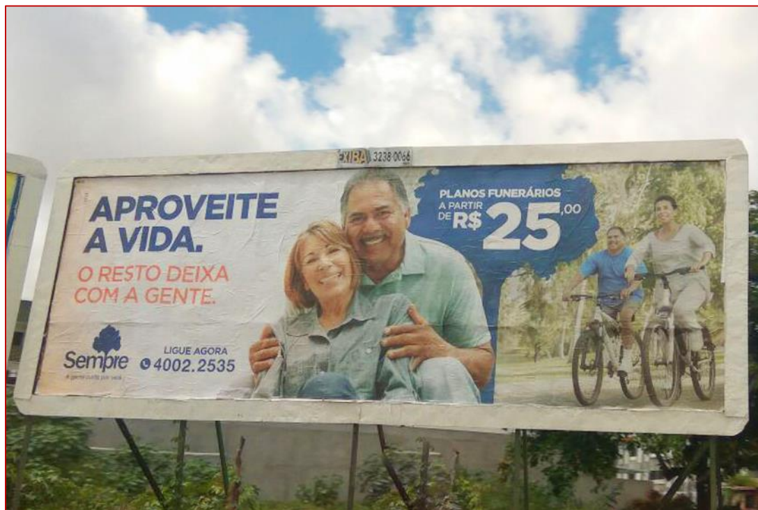
Figura 4: Plano de Assistência Funerária Sempre