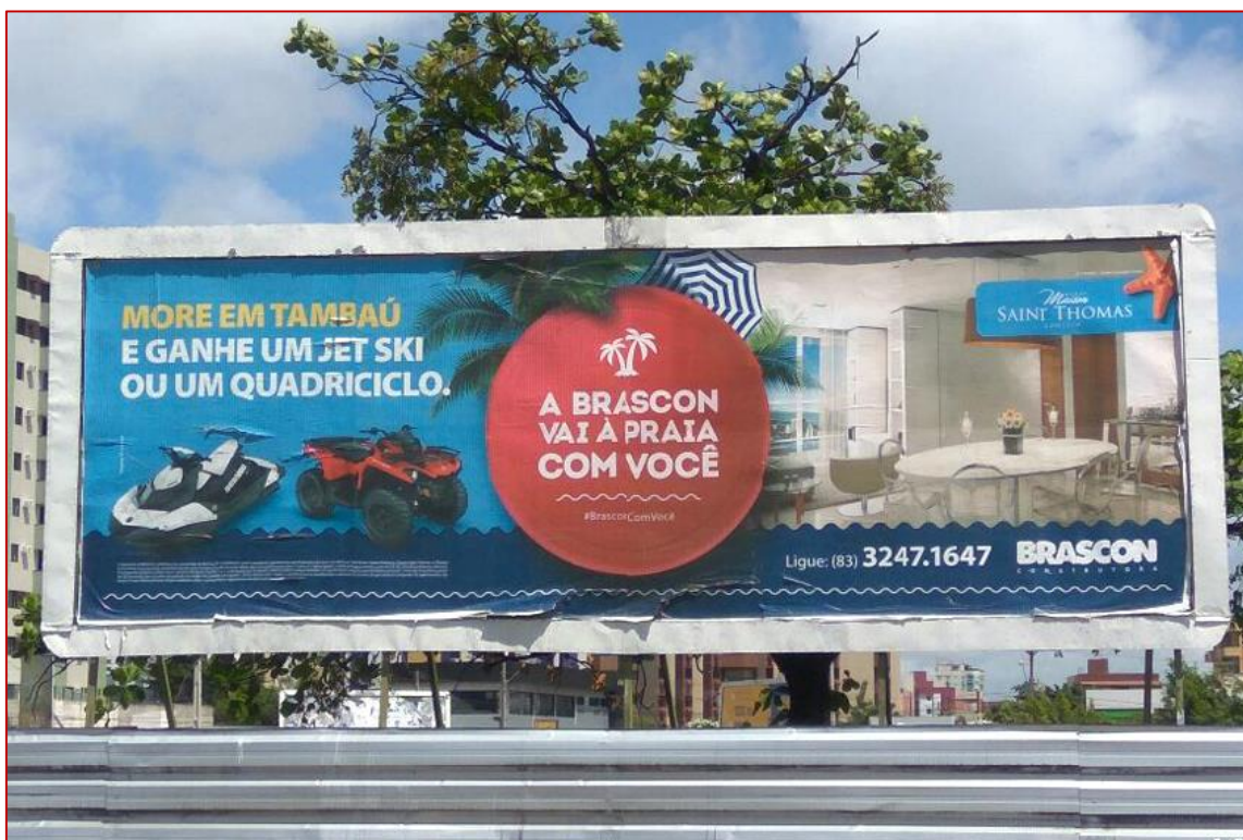
Figura 14 Outdoor – Brascon