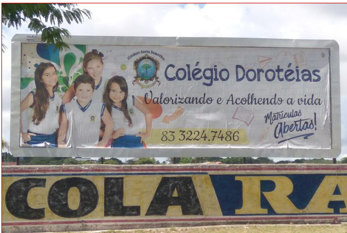
Figura 16: Outdoor – Colégio Dorotéias