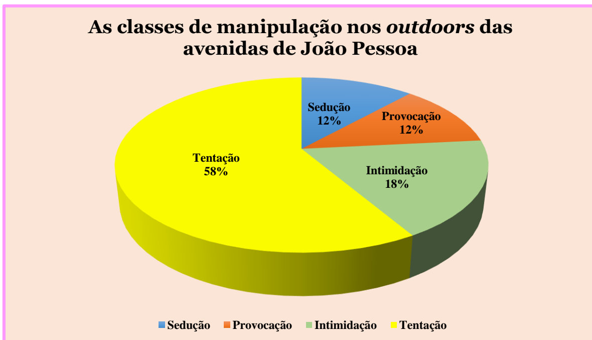
Gráfico 1: Porcentagem dos tipos de manipulação nos outdoors das avenidas João Pessoa