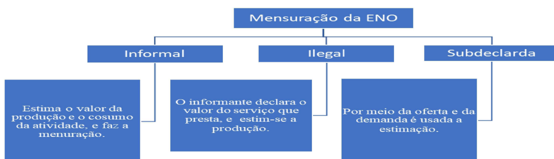
Figura 1. Estrutura de mensuração da ENO

Fonte: Elaboração própria, baseado em Hallak Neto e Ramos (2013).