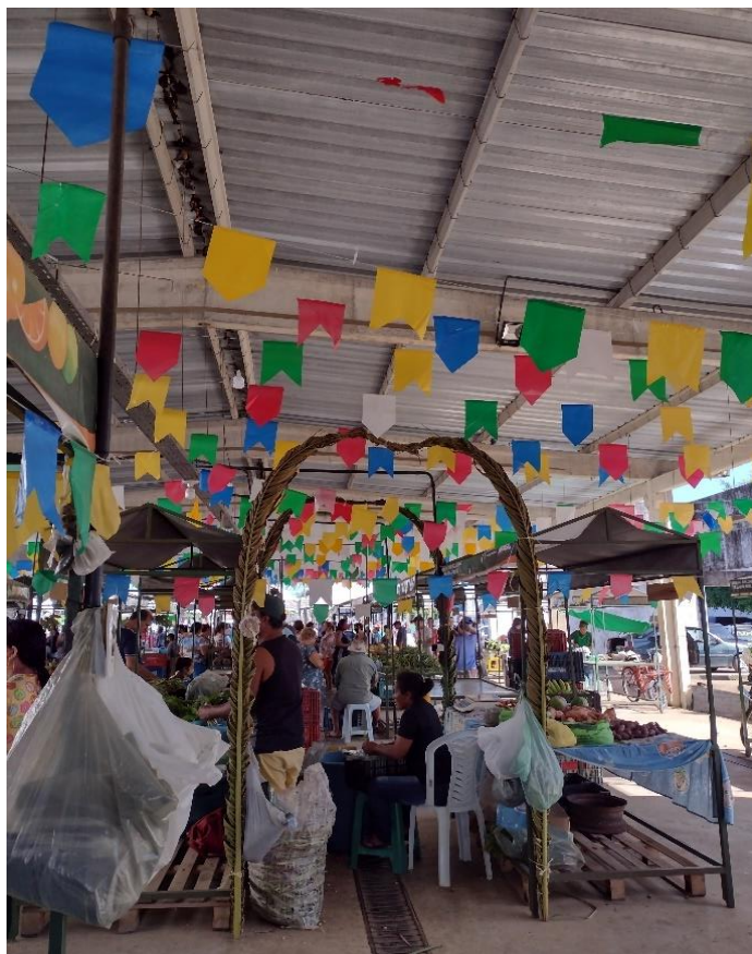
Figura 3: Primeiro festival do milho pós-pandemia de Covid-19