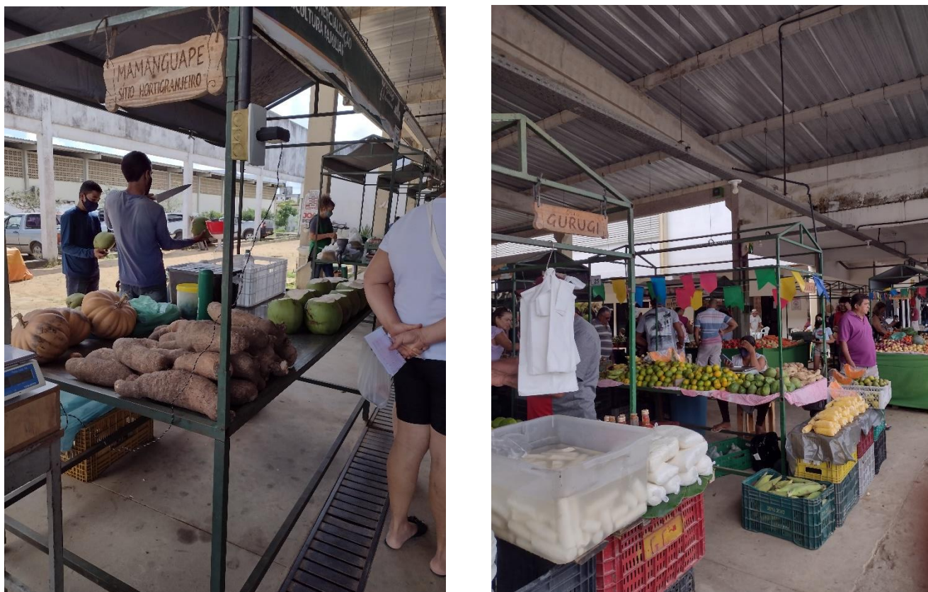
Figura 6: Bancos de Mamanguape e Gurugi contendo frutas, raízes e legumes