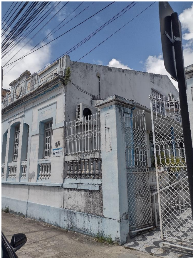
Imagem 10: Fachada da Casa dos Conselhos onde se encontra localizado o CONSEA-PB

Isso implica dizer que o Conselho conta com recursos para pagamento de diárias de conselheiros que vêm de outras localidades do estado, exceto das cidades que compõem a grande João Pessoa, para a participação na reunião mensal do CONSEA-PB, que acontece sempre na penúltima quinta-feira de todos os meses. Assim, o CONSEA-PB conta com conselheiros representantes de várias entidades ligadas à questão alimentar direta e indiretamente, vindos do Litoral ao Sertão do estado. De acordo com a presidente, no período da pandemia da Covid-19 as reuniões do CONSEA-PB ocorreram de forma integralmente remota, e começou-se a retomar as atividades presenciais gradativamente em 2022, depois que a vacinação se tornou amplamente acessível e o índice de mortalidade por Covid-19 decresceu.