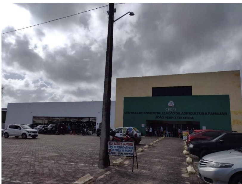
Figura 2: Estacionamento e fachada da CECAF