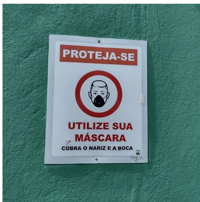
Figura 4: Placa recomendando o uso de máscaras na entrada da CECAF

Segundo o coordenador, a CECAF voltou a funcionar seguindo todos os protocolos de biossegurança. O espaçamento entre os bancos e as “avenidas” da feira foi aumentado, foram instalados lavatórios para que as pessoas pudessem lavar as mãos e o uso de máscara foi adotado pelos feirantes-agricultores familiares. Algo que pudemos observar pessoalmente ao longo do trabalho de campo, que teve início no final de 2021. Embora o uso de máscaras tenha sido abandonado gradativamente no decorrer de 2022.