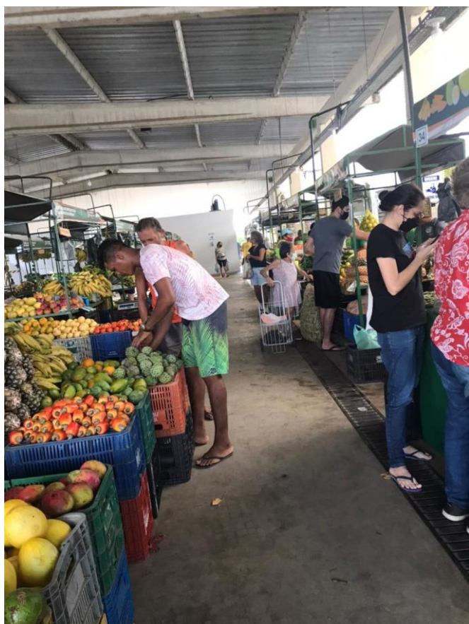
Figura 5: Fluxo de compradores entre às 7:00 e 8:00 horas da manhã em um dia de feira na CECAF

Uma vez que não podiam vender da forma tradicional, fizeram uso da internet para divulgar os seus produtos, trabalhando com entrega à domicílio.