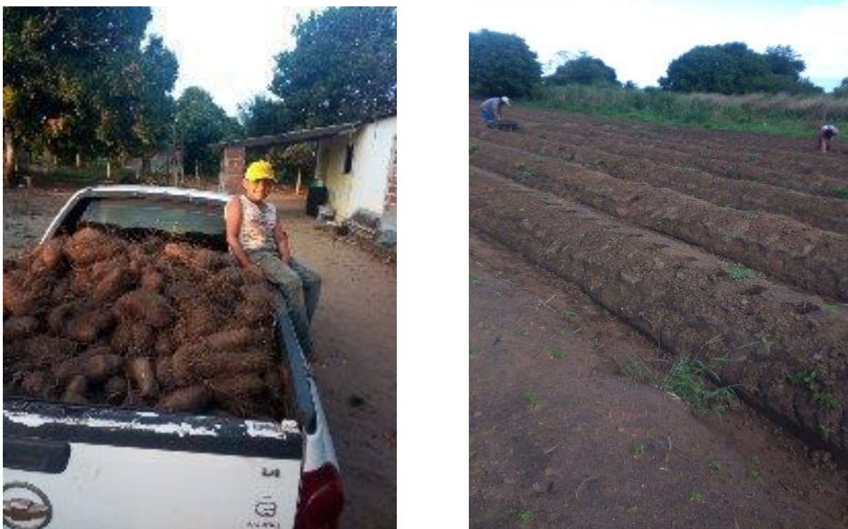
Figura 9: Produção e roçado de inhame de Claudio