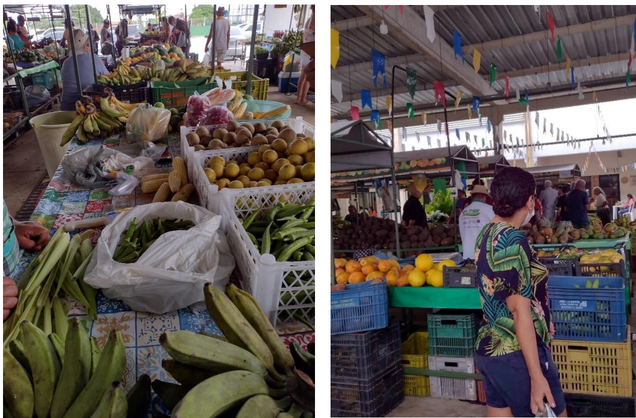
Figura 8: Variedade de produtos vendidos na CECAF e o fluxo de compradores

Logo, podemos observar que a feira não é apenas um espaço de trocas materiais, onde se vende e se compra produtos, diretamente do agricultor familiar no caso da CECAF, mas consiste também em um espaço de trocas simbólicas (NORA, ZANINI, 2015), seja de produtos, de ajuda, de saberes ou de conhecimentos. E essas trocas simbólicas não se dão apenas entre os feirantes e seus fregueses, como se poderia pensar em um primeiro momento, mas também entre os próprios feirantes, como pudemos ver anteriormente.