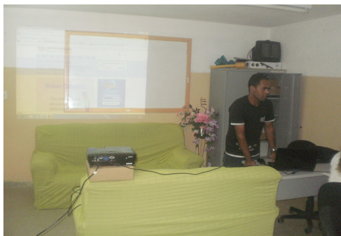
Figura 2- Pesquisador explicando a proposta da pesquisa

A atividade proposta teve como objetivo que os alunos aprendessem a usar a calculadora através do site Racha Cuca disponível no endereço ( http://rachacuca.com.br/jogos/calculadora-quebrada/ ) uma maneira prática e divertida dos estudantes desenvolverem o raciocínio lógico-aritmético para resolver problemas sem ser através de materiais concretos como lápis e papel. O aplicativo faz as contas pedidas utilizando os números e as operações disponíveis. Neste jogo de calculadora o objetivo é usar o raciocínio e a criatividade para obter os números requisitados usando uma calculadora quebrada, ou seja, uma calculadora que não possui todos os números nem todas as operações. Em relação ao nível de dificuldades ele tem 6 níveis que vai do nível 1 aumentando o grau de dificuldade até se chegar ao nível 6 e aconselhável para pessoas acima de 12 anos, o tempo máximo para se jogar é mais de 15 min. E o nível é Médio.