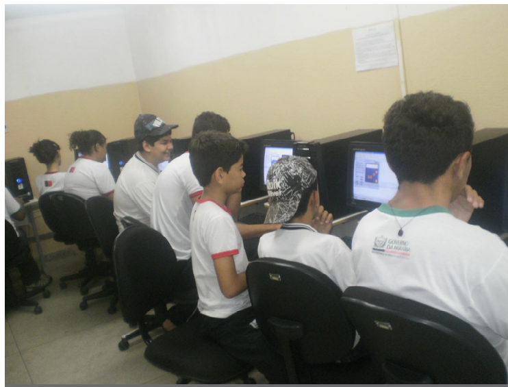
Figura 3- Alunos no Laboratório

A respeito do gosto dos estudantes pela disciplina de matemática constatamos que 55% afirmaram que gostavam da disciplina, enquanto 45% afirmaram que não. Fica evidente neste fato que quase a metade da turma não se sente motivada por esta disciplina. Neste momento refletimos o quanto é importante que os profissionais da educação despertem o gosto de seus estudantes lançando mão de novas estratégias didáticas e metodológicas no intuito de despertar o interesse intrínseco dos discentes pelo gosto de aprender.