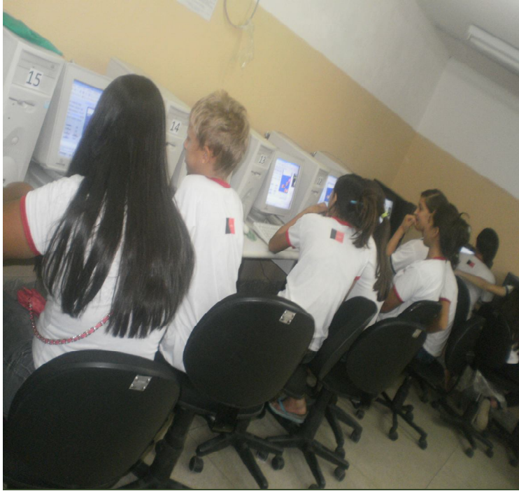
Figura 4- Alunos no laboratório

tornar as aulas de matemática mais prazerosa como podemos observar na Figura 4 uma maior integração dos estudantes quando estão no laboratório.