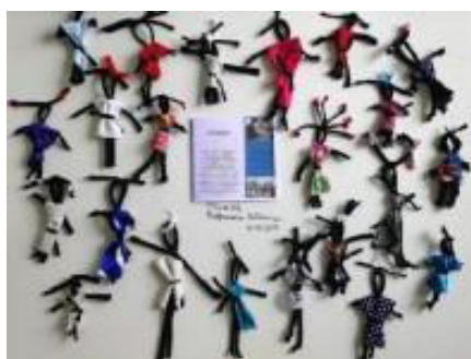
Imagem 5: A professora Silvana, trabalhou com seus alunos do 3ºano, Histórias da Boneca Abayomi.

Fonte: Escola Albano Kanzler (créditos foto de Escola Albano Kanzler). Disponível em: EMEB "Albano Kanzler": Semana da Consciência Negra ( 20 a 24 de Novembro - 2017) (escolaalbanokanzler.blogspot.com) , Acesso em: 09 de Maio de 2022.