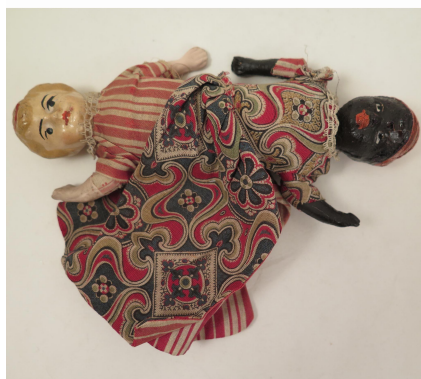
Imagem 7: Topsy Turve Dolls