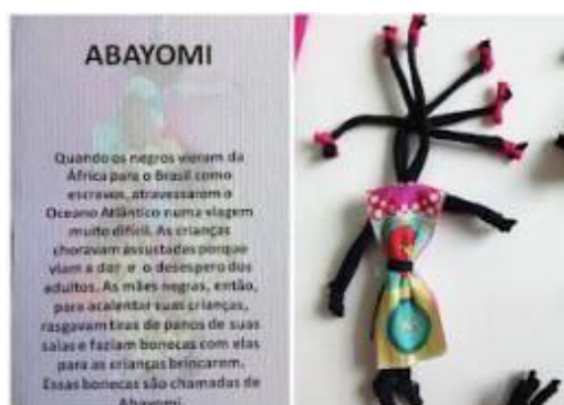
Imagem 6: A professora Silvana, trabalhou com seus alunos do 3ºano, Histórias da Boneca Abayomi. ( detalhe ao centro da foto)

Fonte: Escola Albano Kanzler (créditos foto de Escola Albano Kanzler). Disponível em: EMEB "Albano Kanzler": Semana da Consciência Negra ( 20 a 24 de Novembro - 2017) (escolaalbanokanzler.blogspot.com) , Acesso em: 09 de Maio de 2022.