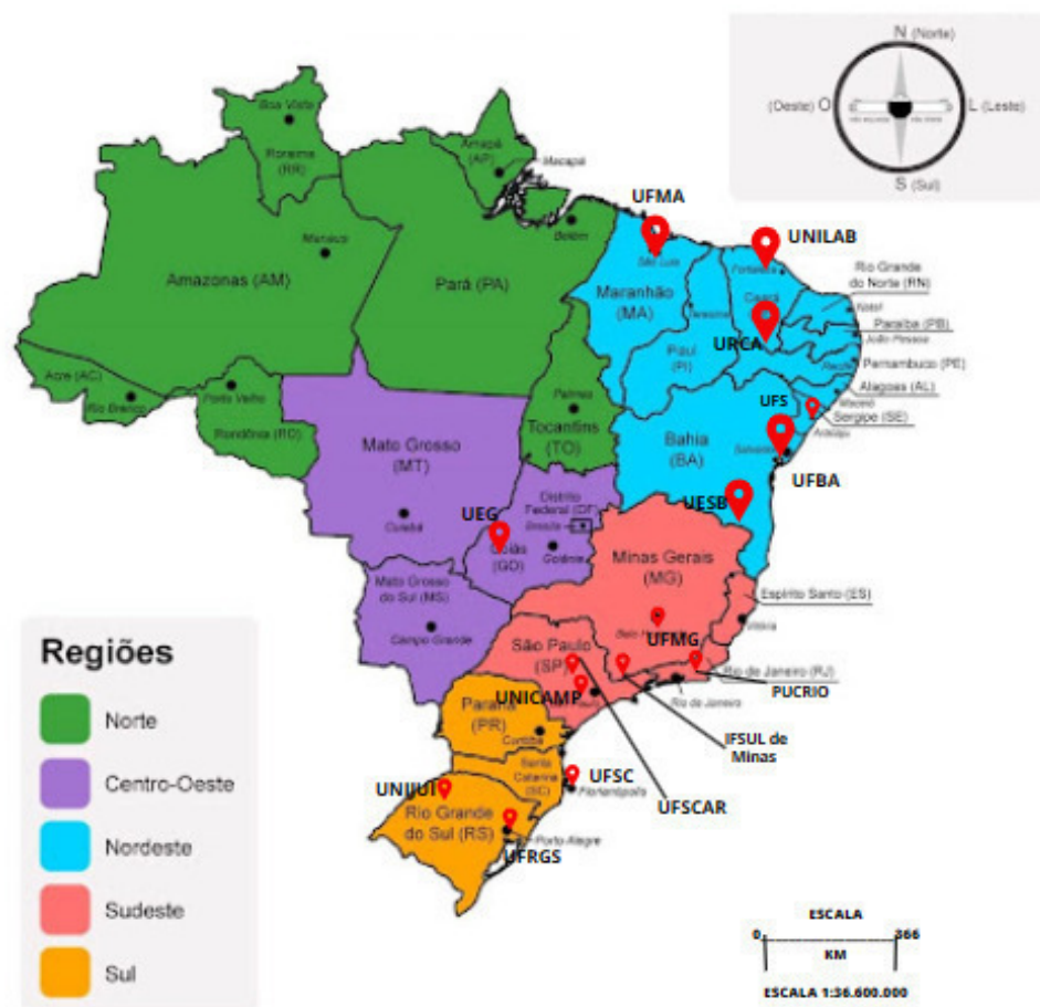
Imagem 9: mapa regional das tessituras Abayomi