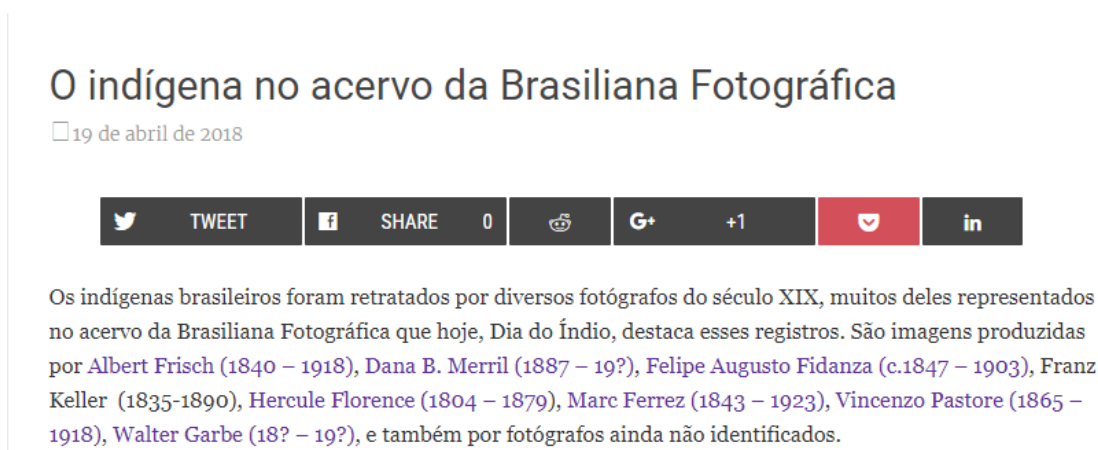
Figura 5: fragmento retirado do site utilizado como referência no livro didático em análise.

Outro ponto relevante ao analisar a abordagem da temática indígena na obra em questão é a discrepância entre o texto de apoio presente no material didático e o texto original da fonte (Figura 5). Embora não haja nenhuma indicação de adaptação na referência, nota-se que o conteúdo inserido difere do original, conforme ilustrado na imagem abaixo: