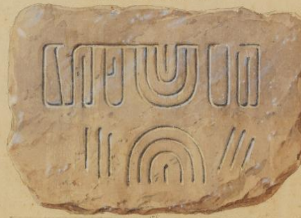
Sessão transcendental das inscripções em tamanho nat.

na Cachoiras de Ribeirão (margem direita)