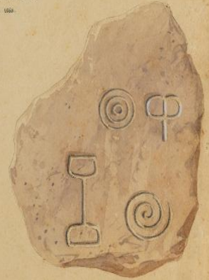
na Cach. de Colônia de Injuno (na parte superior da margem)