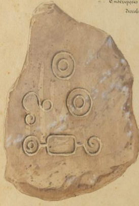
na Cach. de S. Jorge (margem esquerda)

das Cachoiras do rio Madeira nos rios de Olyto e Sibimbo 1850.