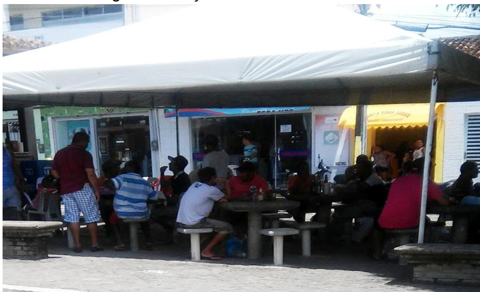
Imagem 6: Praça Fábio Luiz em dia de feira