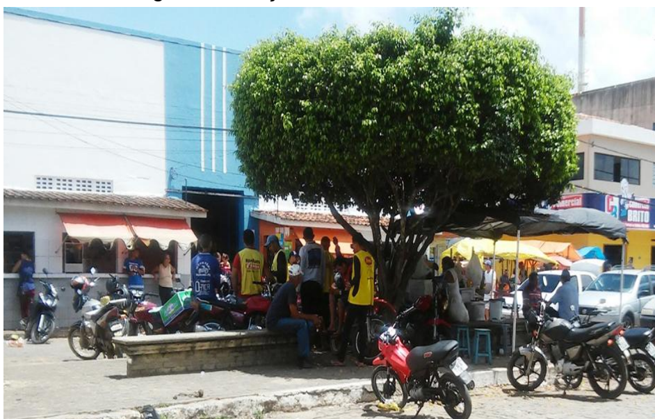
Imagem 8 : Praça Fábio Luiz em dia de feira

Esse fluxo de pessoas e de carros, permanece constantemente durante toda manhã que acontece a feira livre. A praça é o ponto central de encontro, de espera, de compras e vendas de produtos e momento de sociabilidade. É nesse ambiente onde é desenvolvida as relações sociais, que ganham forma e sentidos.