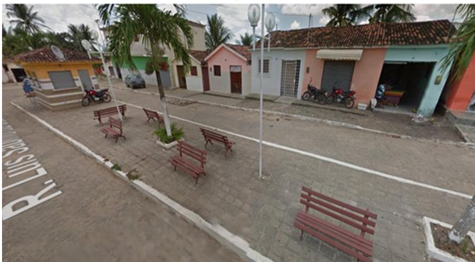
Imagem 4: Praça Carlos Lopes