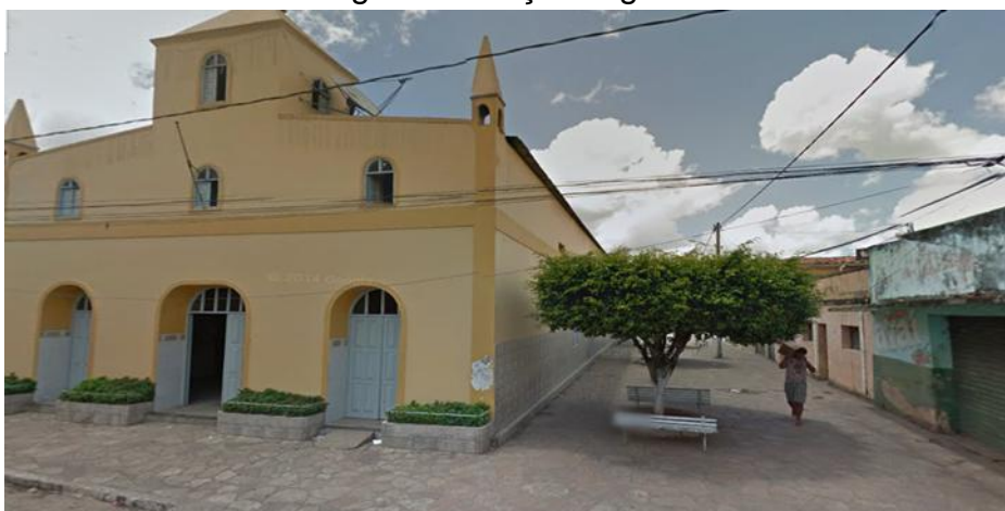
Imagem 3: Praça Diego Luiz