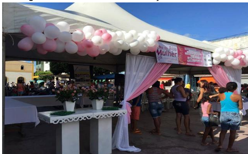
Imagem 10: Evento social na Praça Fábio Luiz