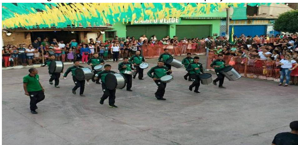
Imagem 12: Desfile cívico realizado na praça Fábio Luiz