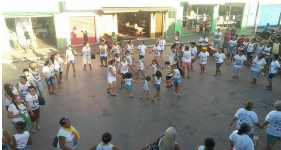
Imagem 11: Apresentação carnavalesca do Grupo Estela de Ouro e as crianças do CRAS