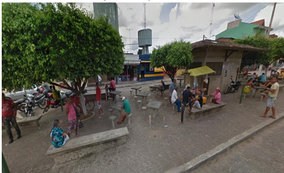
Imagem 5: Praça Fábio Luiz

Na imagem 5- Mostra a estrutura física da praça da matriz sendo composta por dois quiosques de cimentos, com algumas mesas e bancos também de cimentos. Além de árvores, lixeiras em formato de abacaxi, tendo essa representatividade pelo fato da fruta ser a principal fonte de renda dos produtores rurais da cidade. Existiam neste local várias árvores como: castanholas que estavam ali a décadas servindo como sombras para as pessoas ficarem sentadas. Mas, devido as suas raízes que estavam completamente danificadas pelo desgaste natural do tempo houve a retirada de todas elas, sendo colocadas outras árvores de pequeno porte formando o seu cenário atual. Na imagem a seguir mostra as pessoas sentadas, conversando, outras passando e o vendedor de pipoca com seu carrinho.