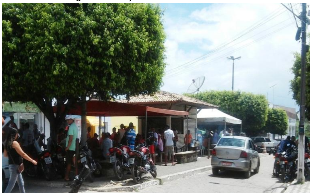
Imagem 7 : Praça Fábio Luiz em dia de feira