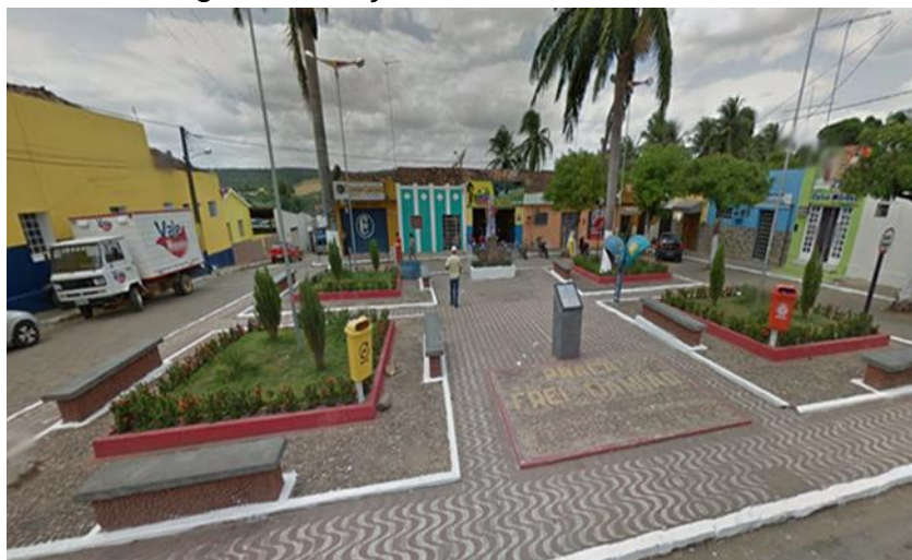
Imagem 2: Praça Frei Damião de Bozzano

Na imagem 1- A Praça São João Batista localizada no centro da cidade, entre residências, comércios, escola e igreja evangélica. Seus principais usuários são: moradores que residem próximo à praça, estudantes e comerciantes. Em 29 de Janeiro de 2012, a praça passou por uma reforma onde recebeu o nome e uma imagem de São João Batista, padroeiro da cidade de Itapororoca-PB.