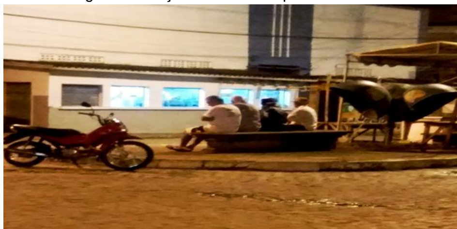
Imagem 9 : Praça Fábio Luiz no período da noite