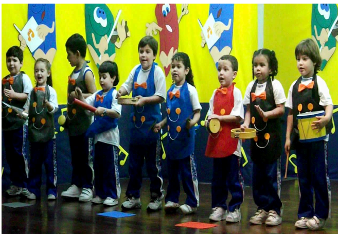
Sexto momento: Figura 16

Material utilizado: Cartaz com a letra da música, crachás e fita adesiva.