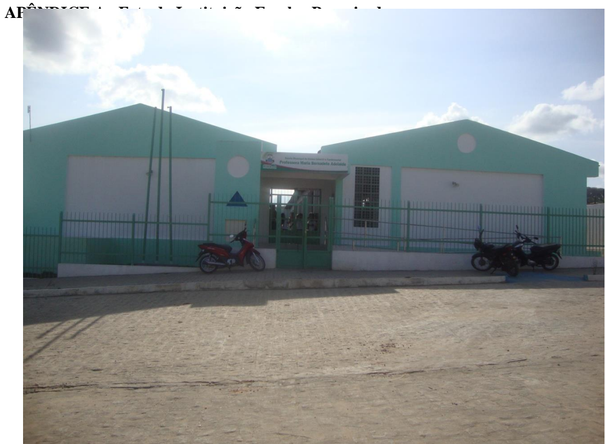
Escola Municipal de Ensino Infantil e Fundamental Maria Bernadete Adelaide do município de Lagoa de Dentro/PB.