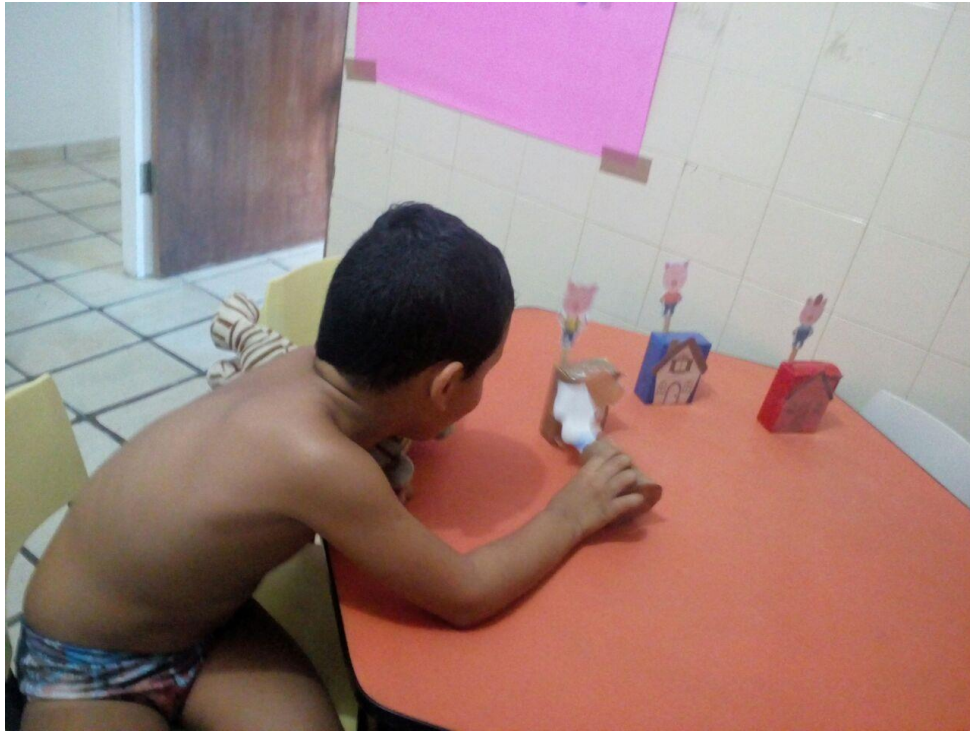
Aluno P. M. recontando a história dos porquinhos.