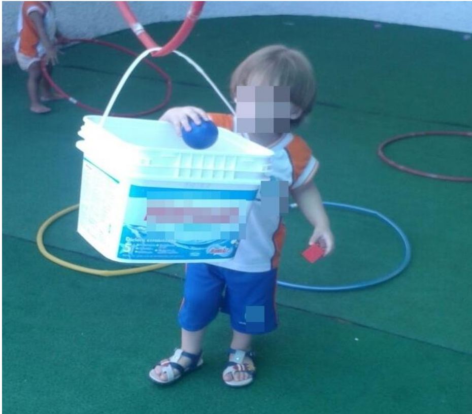
Aluno A. V. na atividade de motricidade e percepção.