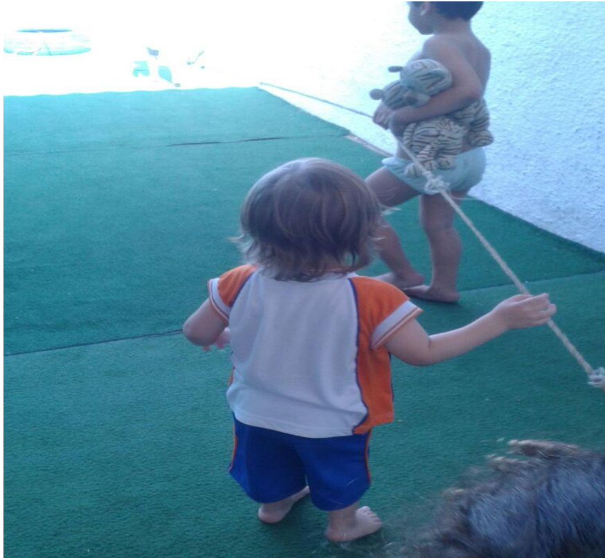
Alunos A. V. e P. M. na atividade de motricidade com o barbante.