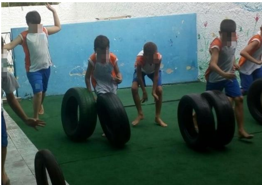
Aluno P. P. brincando junto com os colegas no recreio.