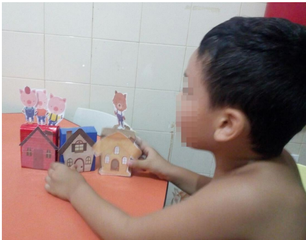
Aluno P. P. finalizando a história dos Três Porquinhos.