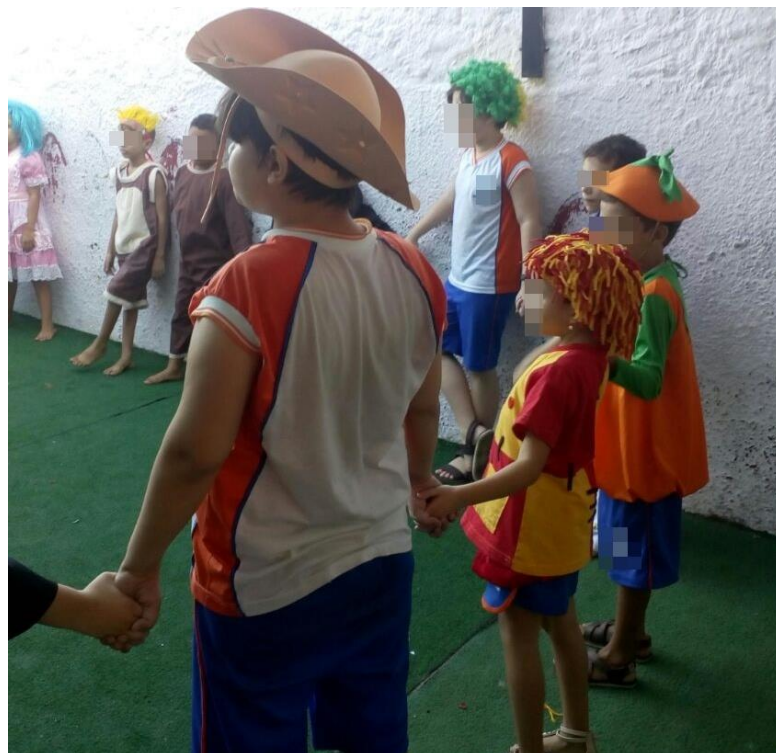
Aluno P. P. após interpretar o xerife.