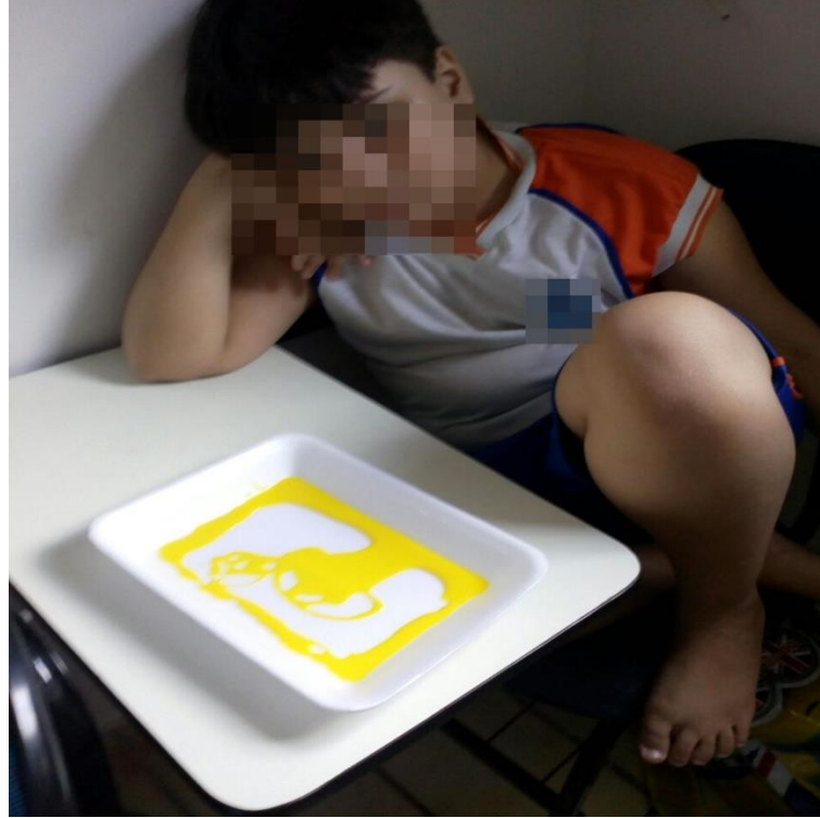
Pintura rupestre do aluno P. P.

Fotos ilustrando algumas atividades realizadas com os alunos da pesquisa