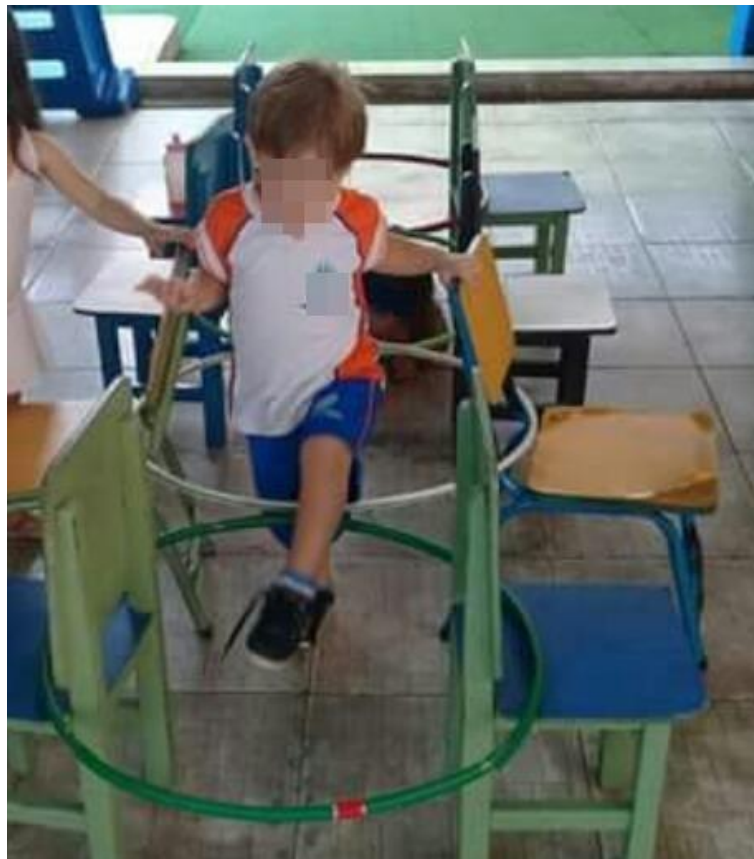
Aluno A. V. na atividade com obstáculos.