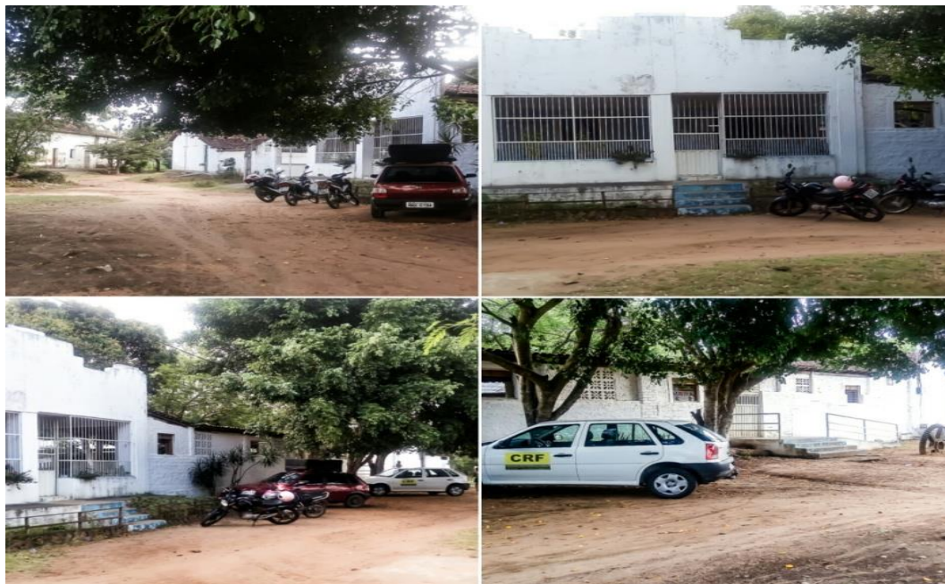
Figura 01 - Centro Rural de Formação

O CAE surgiu inicialmente em 2012, mas só no ano seguinte em 2013, que obteve o reconhecimento do Conselho Estadual de Educação em parceria com o Conselho Municipal dos direitos da Criança e do Adolescente. A partir da elaboração de um projeto bem organizado, foi possível a aprovação do mesmo, dando início ao envolvimento de vários profissionais voltados a esse tipo de atendimento.