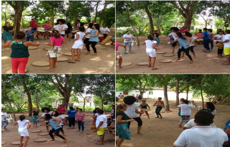
Figura 20 – Atividade Intercâmbio Cultural II