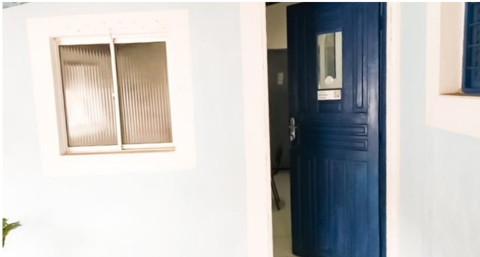
Figura 03 - Sala de Serviço Social

A figura acima, mostra à secretaria, onde dispõe de sala de arquivo, sala de reunião e banheiro para os funcionários. Aqui são realizados todos os serviços administrativos e procedimentos necessários ao funcionamento do CRF.