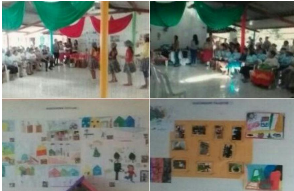
Figura 18 – Mostra Cultural II