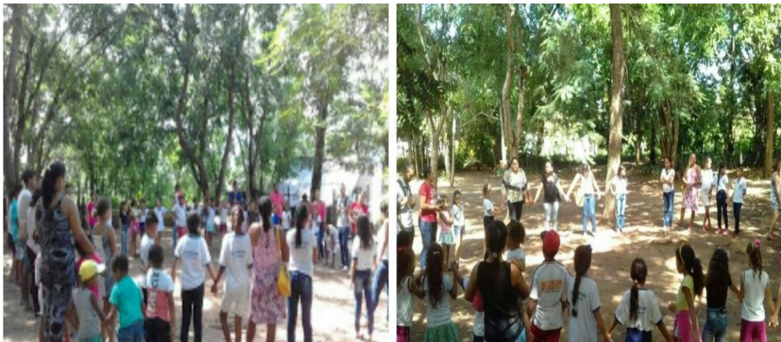
Figura 17 – Atividade no Bosque

Atualmente em 2017, o CRF-CAE promoveu diversas atividades envolvendo as crianças que são atendidas na instituição, como também cede o espaço para a participação de outras escolas, a exemplo da Escola José da Cunha do Assentamento em Canudos em que foi desenvolvida no dia 05 de Junho deste, uma atividade no bosque, proporcionado um momento coletivo com as crianças. Foi um dia dedicado ao Meio Ambiente, em que realizou-se uma aula de campo enfatizando a importância do reflorestamento e a preservação das riquezas naturais, bem ilustrada nas figuras abaixo. O que dessa forma, ainda caracteriza a metodologia da alternância nas atividades que são desenvolvidas em sala de aula relacionando momentos teóricos com ações práticas bem definidas para melhor associação dos conteúdos trabalhados.