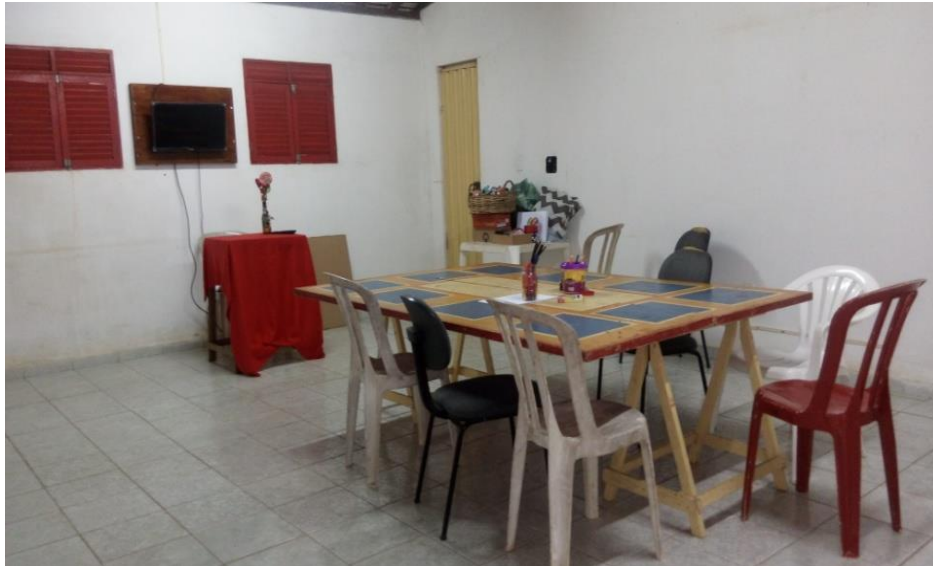
Figura 11 - Sala da Equipe Pedagógica

A figura acima mostra a brinquedoteca, uma sala organizada para as atividades lúdicas, com a utilização de brinquedos pedagógicos como ferramenta favorável ao ensino-aprendizagem das crianças e adolescentes, proporcionando um ambiente rico em conteúdo e interação entre os mesmos.