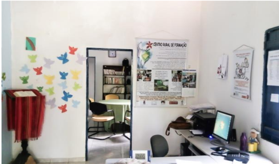
Figura 02 - Secretaria do CRF