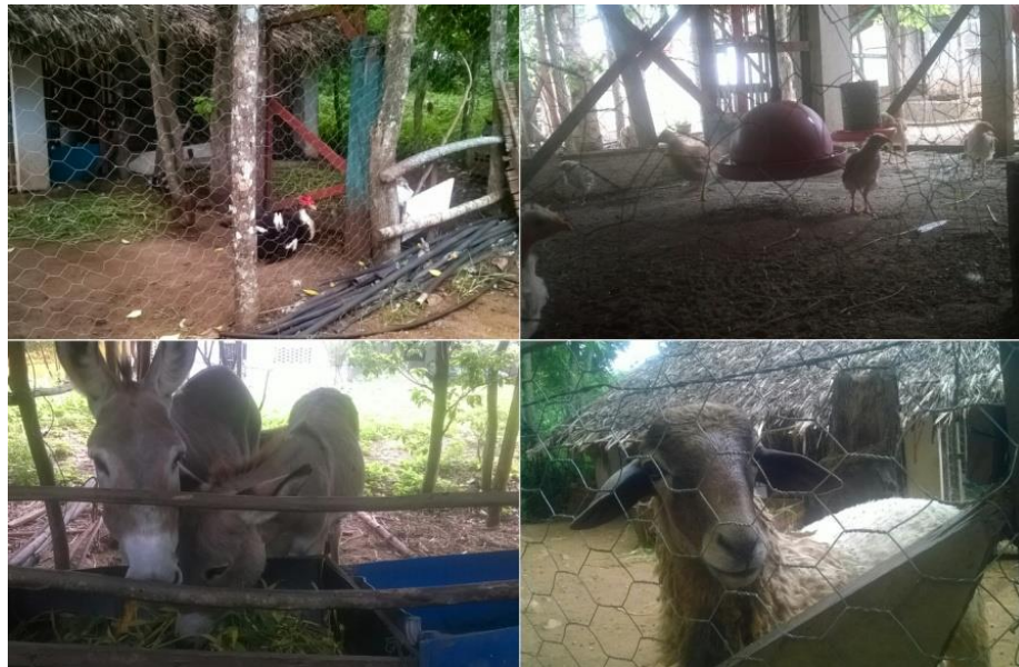
Figura 15 - Fazendoteca

O salão principal, é um espaço coberto onde são oferecidas as refeições, também utilizado na realização de diversas atividades, de acolhimento, apresentações culturais e artísticas, cursos de capacitação, seminários, palestras, recreação, festas temáticas e comemorativas e eventos complementares.