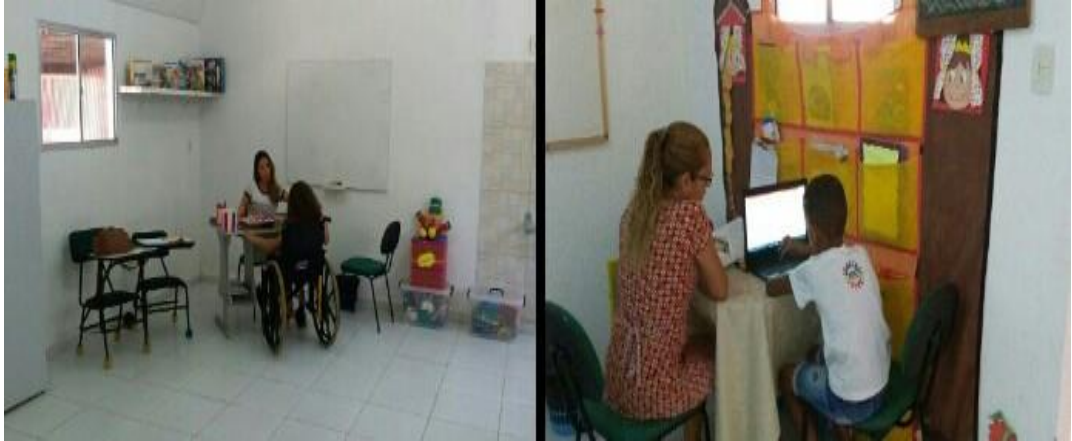
Figura 22 - Atendimento - AEE e Psicopedagogia

como ferramenta em potencial de ensino direcionando o aluno em suas tarefas de pesquisa em leitura e escrita.