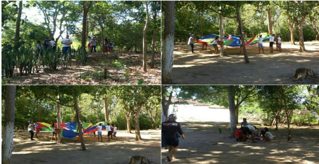
Figura 21 - Atividade de Recreação e Educação Física.