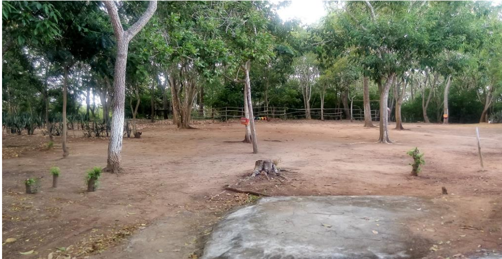
Figura 16 - Bosque