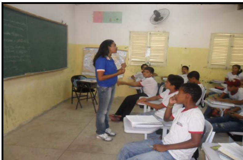
FIGURA - 05: Aula expositiva.