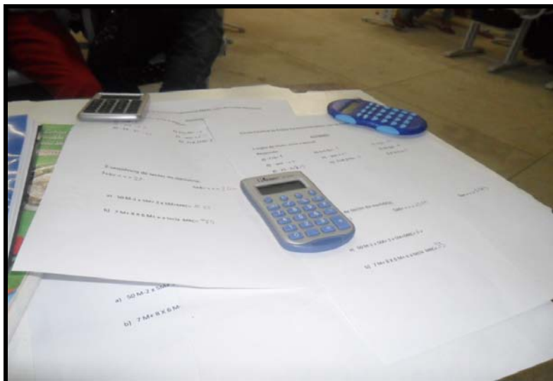
FIGURA – 09: Diferentes tipos de Calculadoras utilizadas nas aulas.