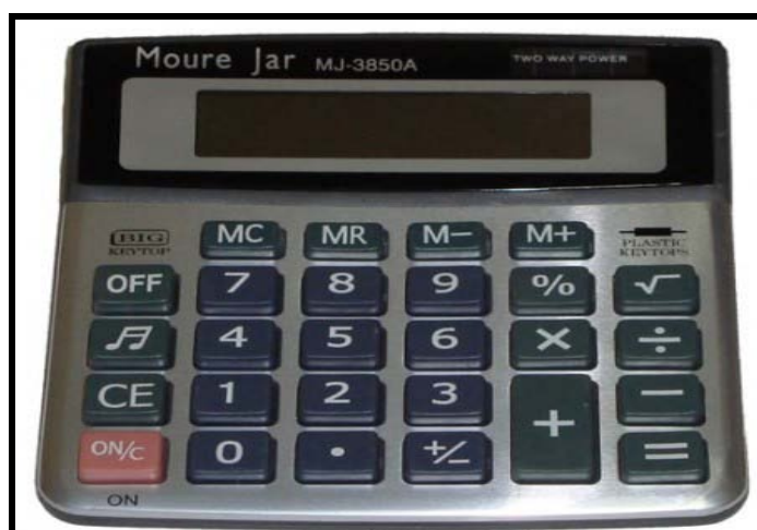
Figura 03 – Calculadora utilizada em sala de aula pelos alunos durante a execução das atividades de intervenção.

Atividade 2 - como trabalhar regras de três simples através de problemas com a utilização da calculadora. Alguns alunos trouxeram calculadora. Fizemos a apresentação da mesma, bem como suas teclas através de gravuras que fixamos no quadro de giz para melhor compreensão dos alunos. De posse de uma calculadora, fizemos a apresentamos de suas teclas, destacando a função de cada uma delas.