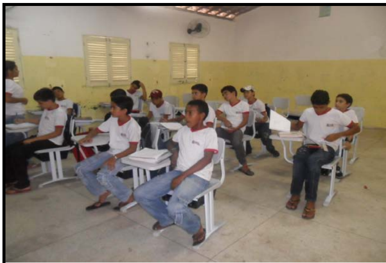
FIGURA - 07: Alunos participando da aula expositiva do conteúdo regras de três simples.