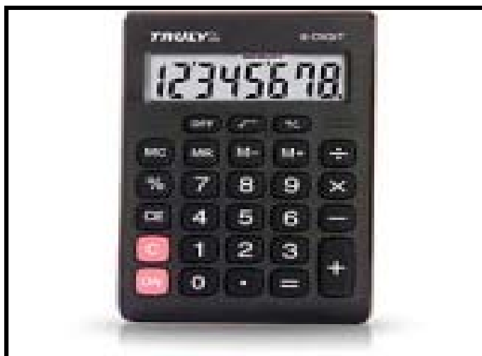
Figura 01 – Calculadora de uso comum.