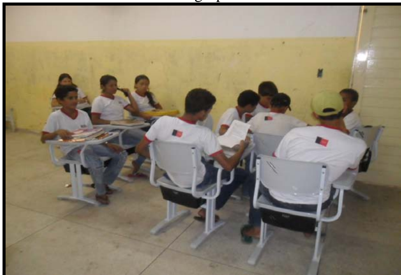
FIGURA - 08: Atividade em grupo com a calculadora.