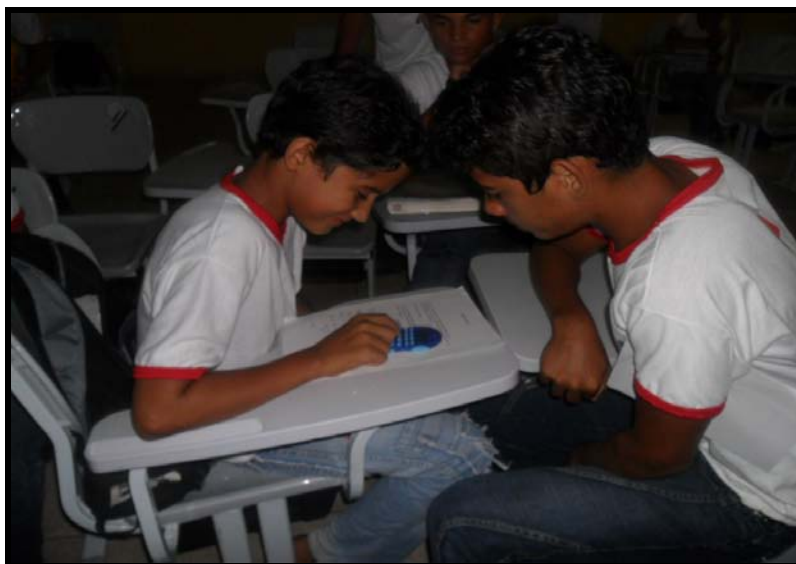
FIGURA - 10: Alunos realizando atividades com o auxílio da calculadora.