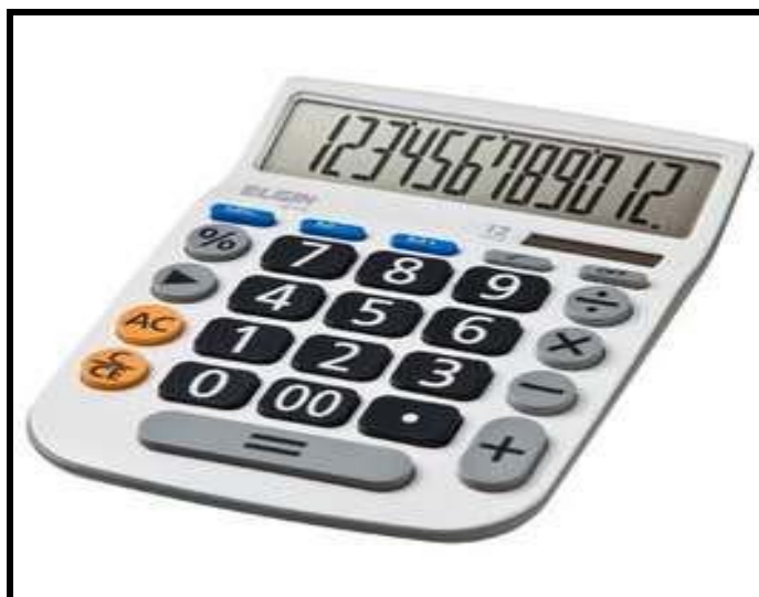
Figura 02 – Calculadora que proporciona outras proporções matemáticas.