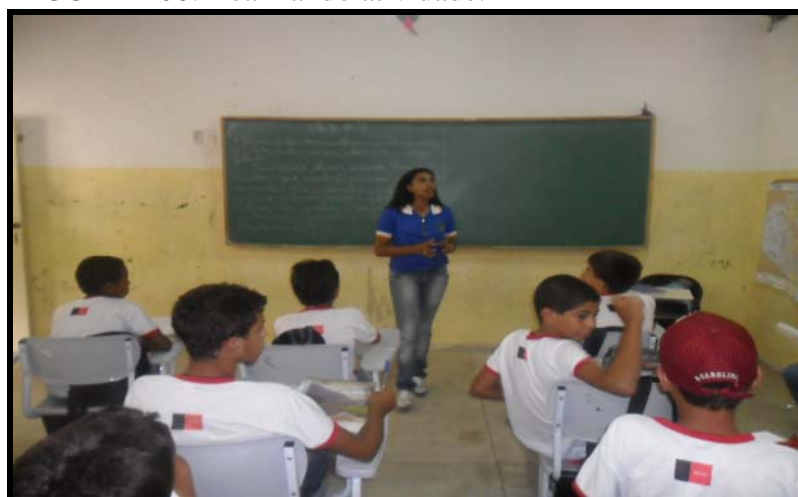
FIGURA - 06: Realizando atividade.