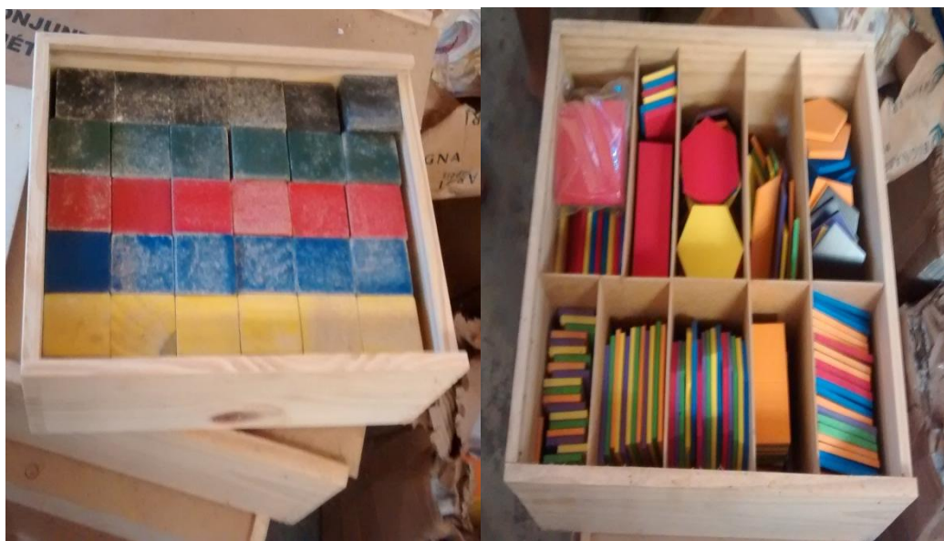
Figura 06: Material didático: Bloco de cubos e Conjunto de formas geométricas.

As figuras 05 e 06 apresentam alguns dos Materiais Didáticos que a escola recebeu para montagem do LEM, além destes, outros se encontram largados e embaixo de muitas caixas. O mau cheiro é muito forte e surpreendentemente encontramos até fezes e urinas de animais, dificultando assim o manuseio para registrarmos em fotos. A figura 07 mostra o estado em que estes objetos se encontram.