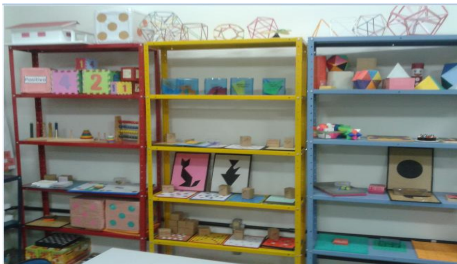
Figura 02: Laboratório de Estudo e Pesquisa em Educação Matemática- LEPEM

Na figura 02 podemos observar parte do acervo do Laboratório de Estudo e Pesquisa em Educação Matemática(LEPEM).