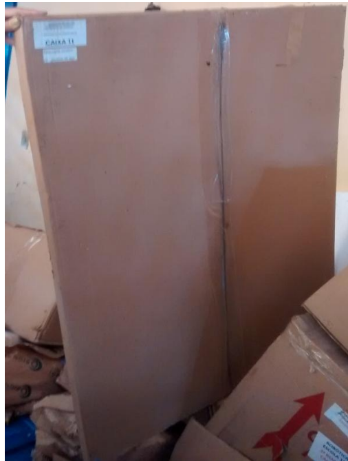
Figura 08: Quadro em aço para Laboratório de Matemática