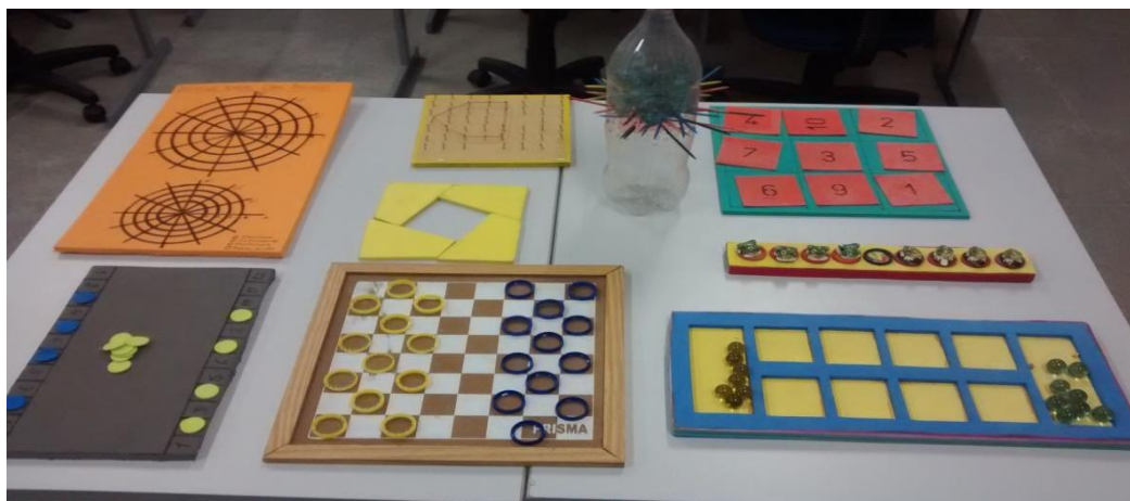
FIGURA 1: Jogos confeccionados com material de baixo custo