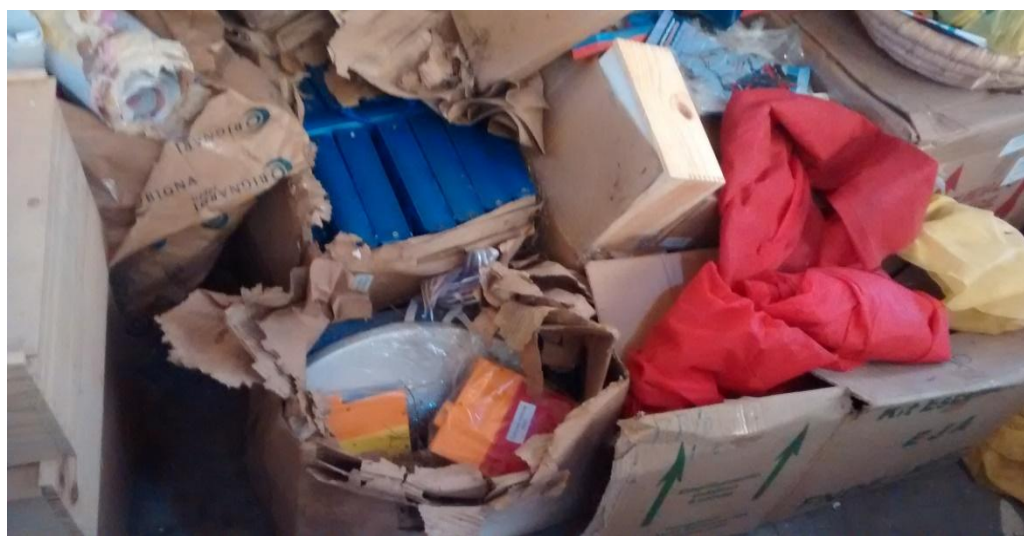
Figura 07: Materiais Didáticos em meio a entulhos.