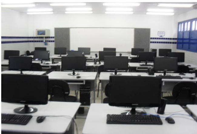
FOTO 4 - SALA DE INFORMÁTICA