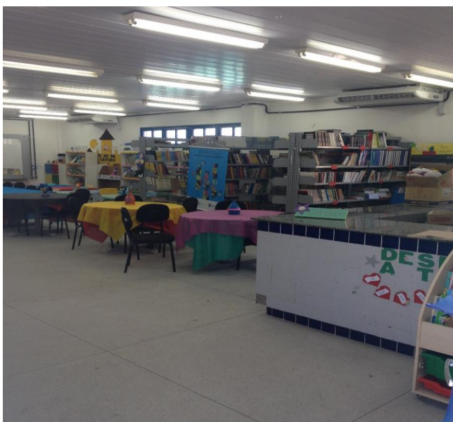
FOTO 2 -INTERIOR DA ESCOLA