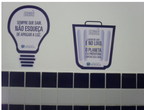
FOTO 6 - SALA DE AULA