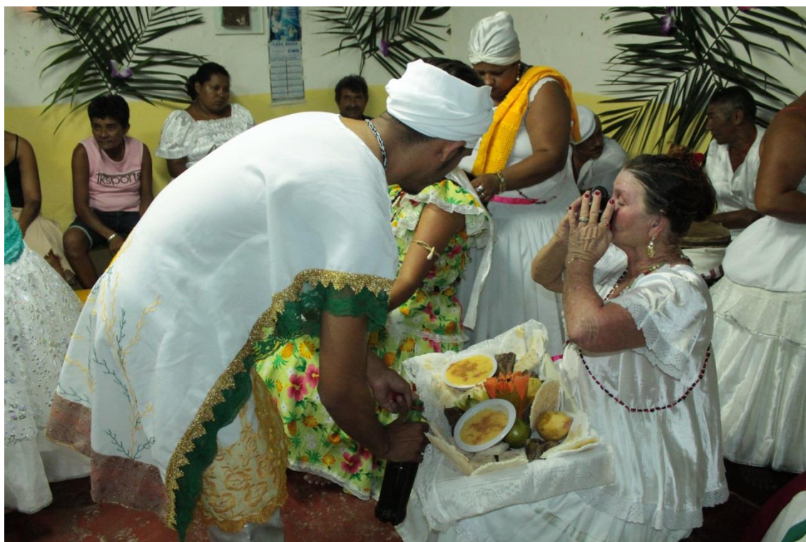
Fotografia 20: As filhas de santo, incorporadas pelas entidades das baianas, tomando vinho.

incorporadas fosse igualmente dado a uma e a outra para que não houvesse algum tipo de desavença entre as entidades. Elas sabiam que precisavam vender, porque examinavam quem pagava ou não. O dinheiro arrecadado, como Mãe Geralda me explicou posteriormente, seria revertido para repor o dinheiro gasto na festa e para a manutenção da casa.