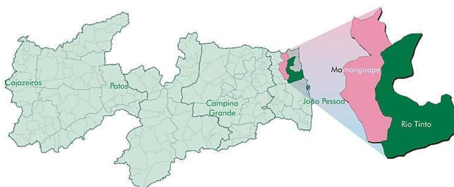
Figura 1: Localização geográfica de Rio Tinto na Paraíba.

O Conjunto Durval de Assis (ver Figura 2 ) localiza-se no centro da cidade de Rio Tinto, Litoral Norte da Paraíba, próximo a pontos de referências importantes para cidade, como a Prefeitura Municipal, a Escola Municipal Antônio Luna Lisboa, e o antigo Tênis Clube, que foi durante muitos anos o centro recreativo da Companhia de Tecidos que deu início à fundação dessa cidade, embora, nem sempre tenha sido assim.