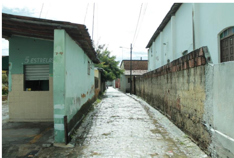
Fotografia 3: Imagem da via de acesso C do Conjunto Durval de Assis.