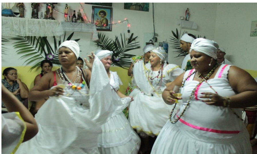
Fotografia 17: As filhas de Santo do Centro Religioso São Jorge Guerreiro já incorporadas das Pombas-giras e tomando vermute.

Diante desse consumo as ajudantes, incumbidas de cuidar desses detalhes e das pessoas que estão tomadas por esses espíritos, prontamente chegam perto delas e lhes oferecem um cálice e a bebida da vez, que para as Pombas-giras, é o vermute. Bebida esta que é de origem italiana, e produzida a partir de uma mistura à base de vinho, flores, ervas, e um adicional de álcool a mais do que no próprio vinho, chegando seu teor alcoólico variavelmente entre 17 e 18% – dependendo da marca do vermute – um teor relativamente forte.