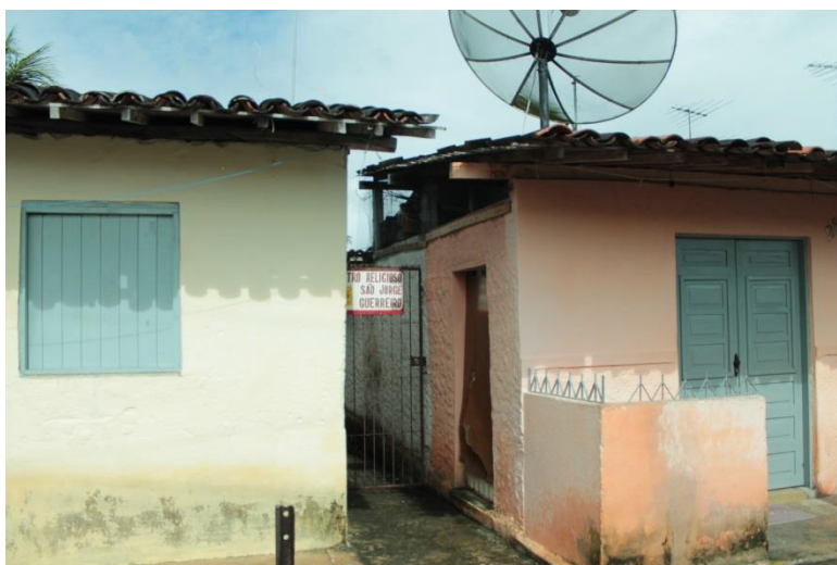
Fotografia 4: Portão de entrada do Centro Religioso visto da via principal do Conjunto.