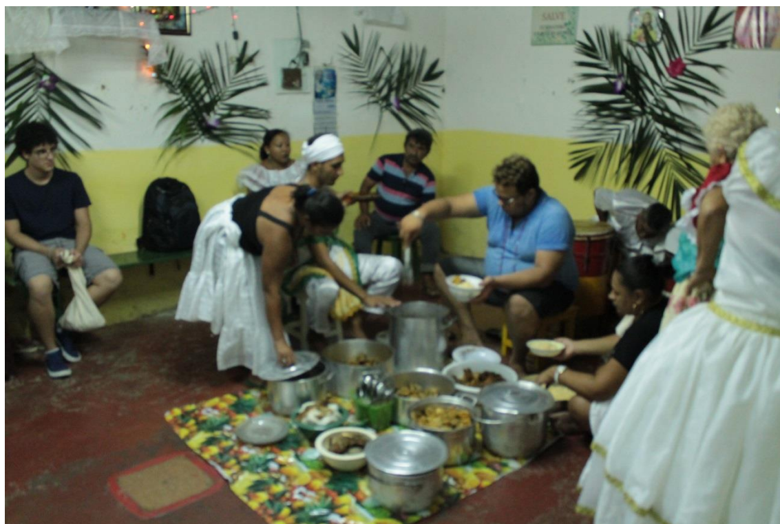
Fotografia 21: Grande refeição após o termino da cerimônia.

Mas seu João ainda continuaria no Centro Religioso. Sua saída do quarto e da obrigação que o processo pede, ou seja, de todo rito de passagem, só terminaria na tarde do dia posterior, no caso, no domingo. Portanto, ele permaneceria no período de liminaridade. Minha curiosidade foi muito grande para saber quais procedimentos ainda se passariam dentro do quarto, mas não fui permitido saber desses segredos.