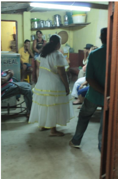
Fotografia 6: Pessoas na cozinha do Centro Religioso, vistas da porta de entrada.

preparações das comidas oferecidas nas “festas” de santo e outros acontecimentos de caráter religioso do lugar. Ainda nesse ambiente, compondo o cenário, há várias cadeiras, onde sempre tem, nos dias de eventos, muitas pessoas conversando e se confraternizando. Banheiros e pias também compõem o lado oposto da porta de entrada (ver Fotografia 6 ).