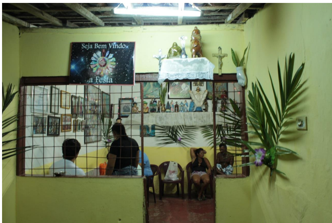
Fotografia 14: Entrada para o salão principal do Centro Religioso São Jorge Guerreiro. Detalhe da placa escrito “Seja bem vindo a festa”.

Ainda sobre a parte espiritual, essa deve ser bem preparada e organizada, pois a permanência do iniciado no Quarto de Jurema por três dias, incluindo o dia da cerimônia, demanda uma atenção extra daqueles que são escolhidos para lidar com o iniciado, e dos demais na assistência para eventuais precisões.