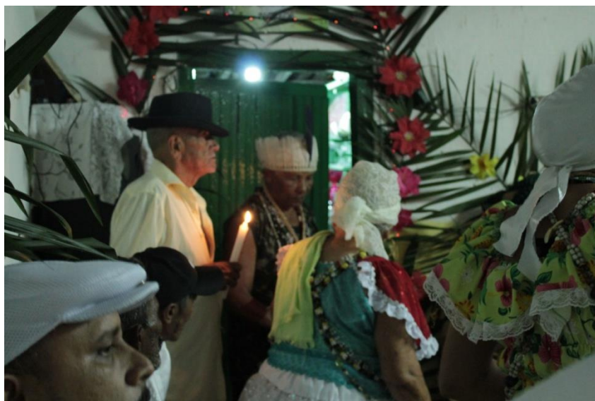
Fotografia 18: Primeira saída de quarto para os Caboclos e Mestres Juremeiros. Detalhe do Padrinho a esquerda da foto segurando uma vela acesa.

no salão enquanto todos, inclusive os demais filhos de santo, assistiam a sua dança, os seus gestos com o arco e a flecha, e seus cumprimentos a várias pessoas que ali se encontravam.