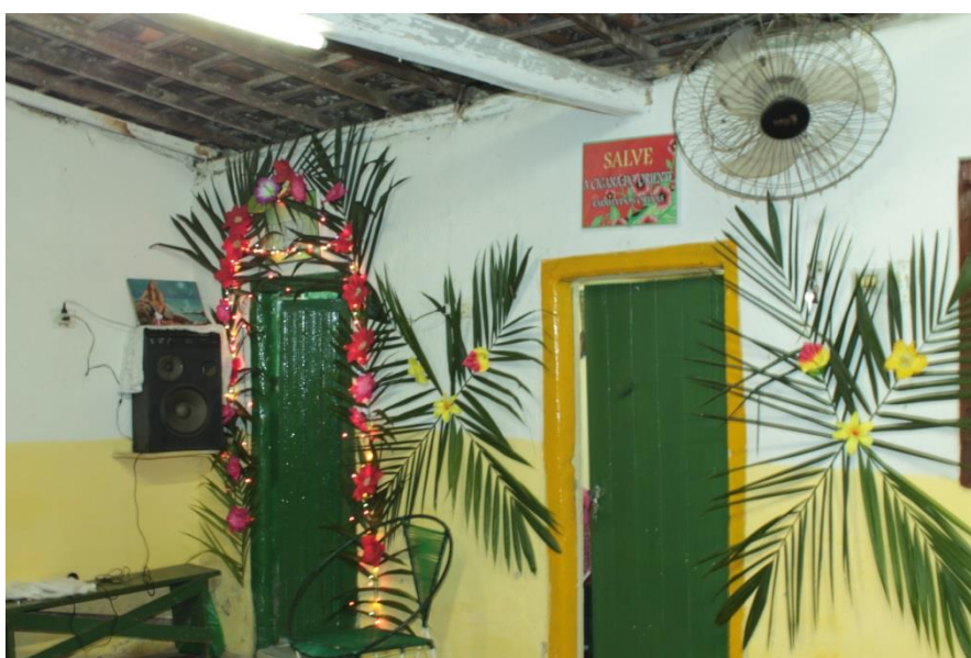
Fotografia 9: Da direita para a esquerda, o Quarto dos Orixás e o Quarto da Jurema.

Creio que essa apresentação do ambiente e da estrutura, ainda que limitadas, sejam fundamentais para a visualização de onde e como a Umbanda encontrada no Centro Religioso São Jorge Guerreiro funciona. O centro, um templo, a tenda, não importa sua designação, enfim, o local onde essas manifestações ocorrem fixamente em um espaço