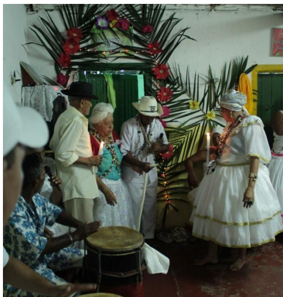
Fotografia 19: Saída de Jurema para os Pretos Velhos e Baianas.

Pude perceber dois tipos de bebidas principais para os Pretos Velhos: a própria cachaça e o vinho. Cada pessoa incorporada bebeu várias vezes, havendo momentos em que eles mesmos pediam, e em outros em que eram as mães pequenas que lhes ofereciam. Eles, como os Caboclos, fumavam cigarros e charutos.