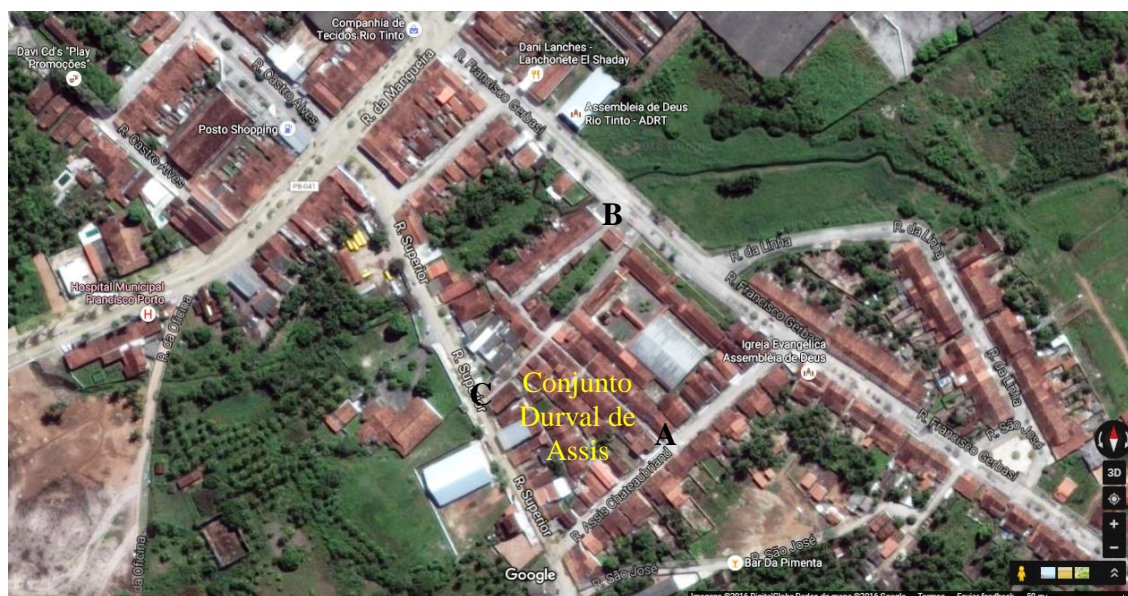
Figura 2: Imagem de satélite do Conjunto Durval de Assis e suas três vias de acesso.

Onde hoje se localiza esse conjunto, foi a mais de quatro décadas atrás, por volta dos anos 70 e 80 do século passado o Centro Comercial de Abastecimento (Mercado Público), onde funcionava a feira livre da cidade, oferecendo a venda de variados tipos alimentícios, utensílios domésticos, vestuário e até animais, semelhante à feira atual da cidade.