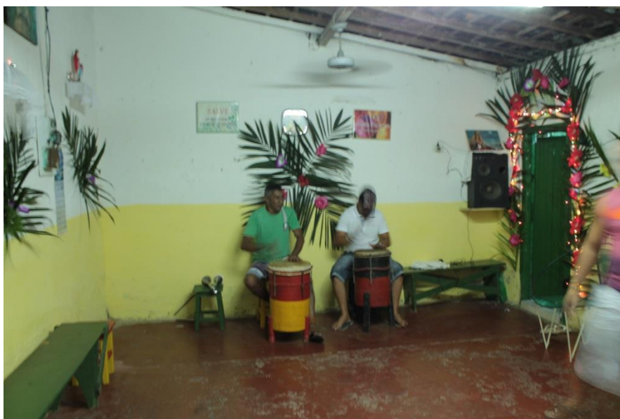
Fotografia 8: Espaço onde ficam os Ogans e são entoados os cânticos.

medida que as entidades as consomem. Sobre esses detalhes, retornarei com maior atenção no próximo capítulo.