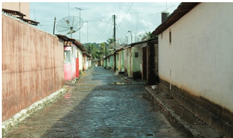
Fotografia 1: Imagem da via de acesso A do Conjunto Durval de Assis.