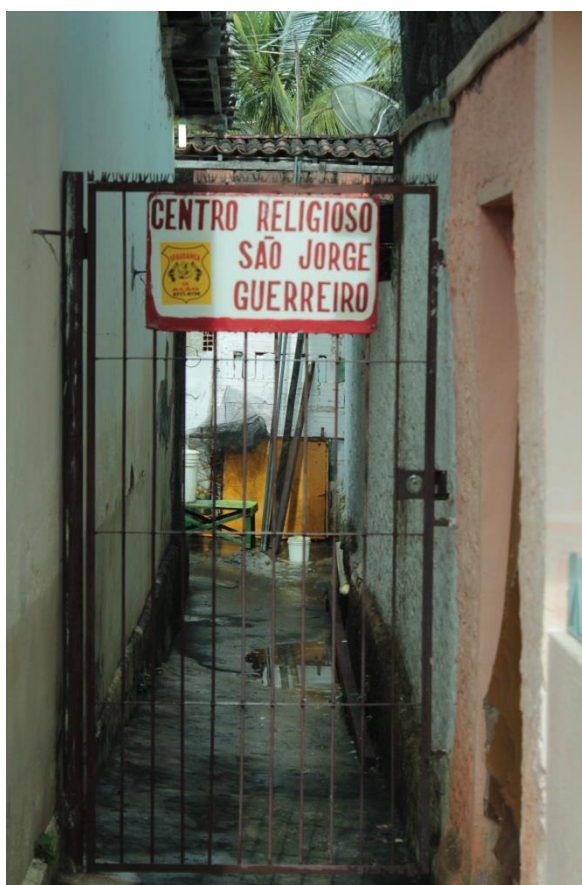
Fotografia 5: Beco e portão de entrada do Centro Religioso São Jorge Guerreiro.

Ao entrar pelo beco nos deparamos com muitas plantas, e com um fogão de carvão, comuns em muitas casas antigas da cidade de Rio Tinto, sob uma espécie de pequena varanda. Adentrando por uma porta, vemos o que parece ser uma grande cozinha, com muitas panelas penduradas, geladeira e outros utensílios domésticos usados nas várias