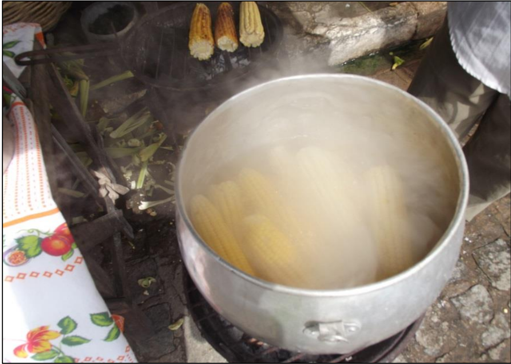
Figura 17 - Milho cozido e assado. Fonte: Ivanildo Costa. 2014.