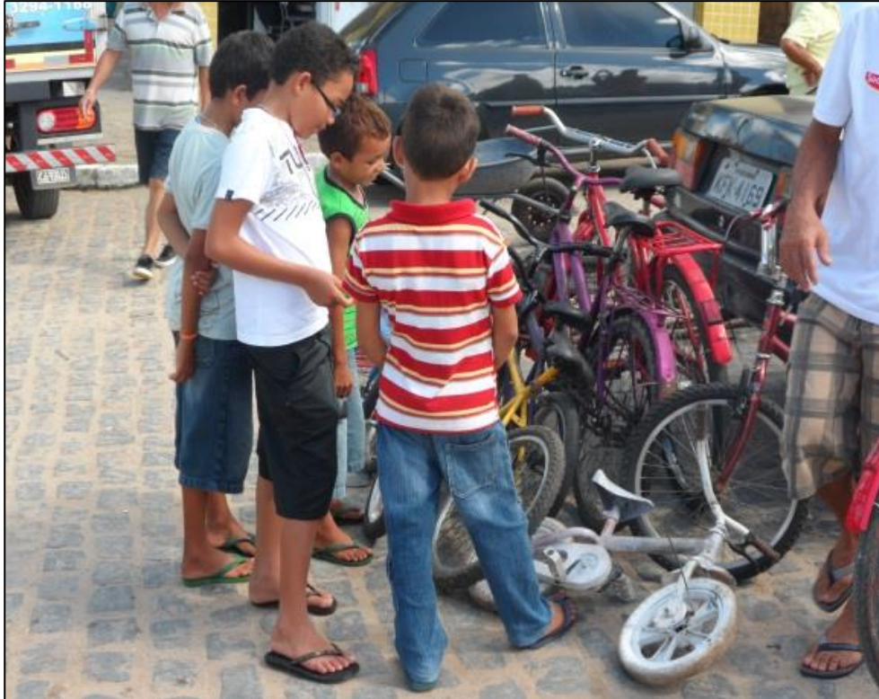
Figura 15 (A) - Feira da Jarambada. 2014.

Perderá o jogo aquele que não tenha o time escolhido representado nos dados. Quem sempre sai ganhando é o dono do jogo. Cada lado do dado é um time diferente: Vasco, Flamengo, Palmeiras, São Paulo, Fluminense, Esporte do Recife, Bota Fogo etc.. (VIEIRA, 2004, p. 79).