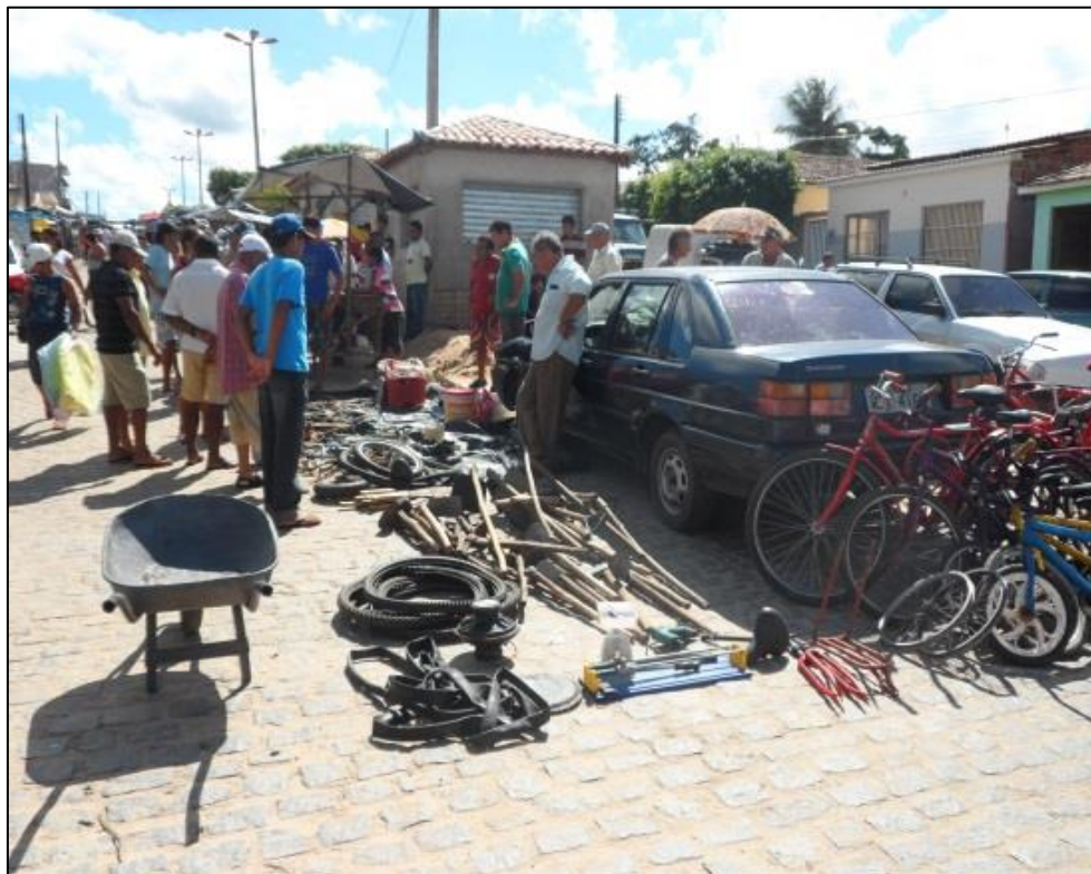
Figura 15 (B) - Feira da Jarambada. 2014.