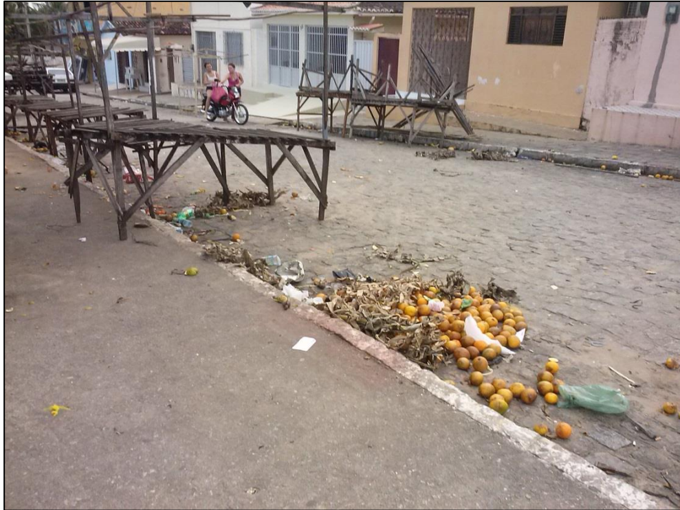
Figura 24 - Resíduos sólidos jogados ao chão no final da feira. 2013.

O Artigo 42, paragrafo 1º, afirma que as bancas devem ser providas de cobertura para proteção dos gêneros alimentícios contra os raios solares, seguindo assim os padrões fixados pela Prefeitura Municipal. Novamente podemos observar (Figura 25) que essa é outra norma que não é cumprida por todos os feirantes, pois durante as idas a campo observei bancas que não dispõem de uma cobertura de lona em seu teto. Contudo, a maioria das bancas está de acordo com os padrões estabelecidos pela citada lei.