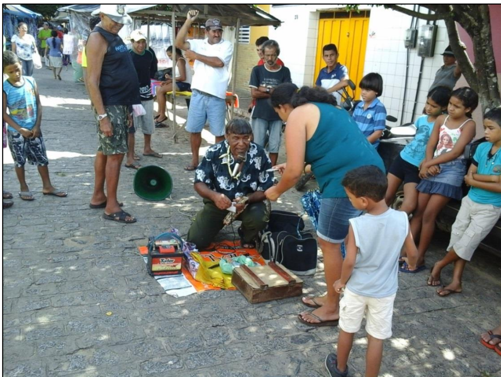
Figura 20 (B) – A venda e a compra da mercadoria. 2015.

Outra maneira de chamar a atenção dos frequentadores da feira são os famosos grupos de forró Pé de Serra (Figura 21) e os cantadores de viola (Figura 22). Esses cantadores são