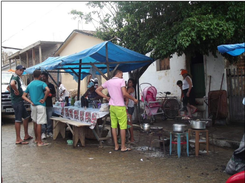
Figura 18 - Barraca de lanches na feira. 2015.