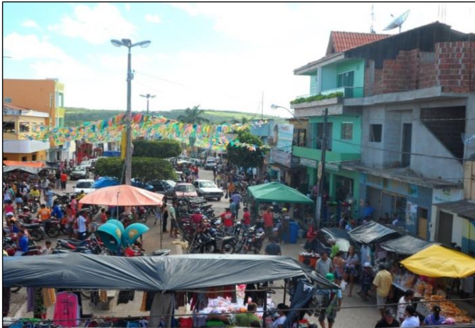
Figura 11 - Praça Principal da Matriz em dia de Feira Livre. 2014.

observar na imagem abaixo, essa praça suporta algumas bancas de feira, os moto-taxistas, estacionamento de carros e, além da movimentação das pessoas o tempo todo, uma tenda de cor verde é colocada em frente ao supermercado pelo dono do estabelecimento para guardar as compras dos fregueses enquanto estes fazem o restante das compras. Ao terminar de fazer as compras, os fregueses voltam à tenda para pegar as sacolas ou então algum funcionário faz esse serviço, e no caso de muitas sacolas, as compras são levadas em carros de mãos até o transporte em que o cliente voltará para casa.