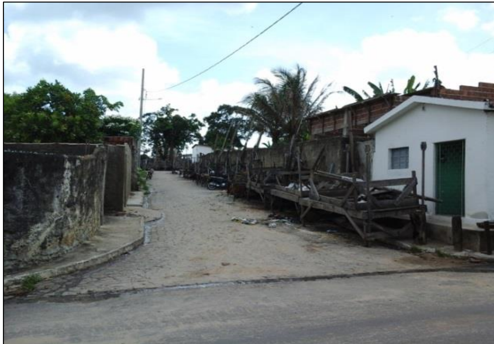
Figura 5 - Rua onde os bancos de feira ficam guardados durante os demais dias da semana. 2015.