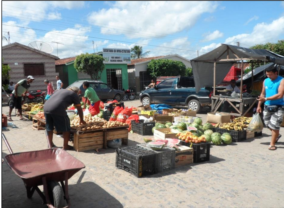
Figura 25 - Produtos expostos sem a cobertura de proteção contra os raios solares. 2014.

Por fim, o Artigo 42, paragrafo 2º, entende que nenhum produto deve ser exposto à venda colocado sobre o solo, mesmo que forrados por lonas ou similares. Nesse caso, notamos que esta norma também é descumprida (Figura 26), não havendo nenhuma fiscalização do poder público que venha impor que estas normas sejam cumpridas de acordo com a lei.