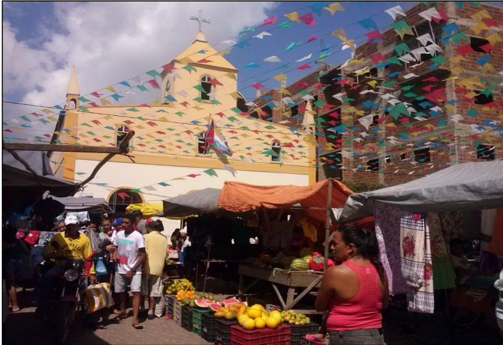
Figura 27- Ao fundo a Matriz São João Batista com sua frente lotada de bancos de feira. 2015.