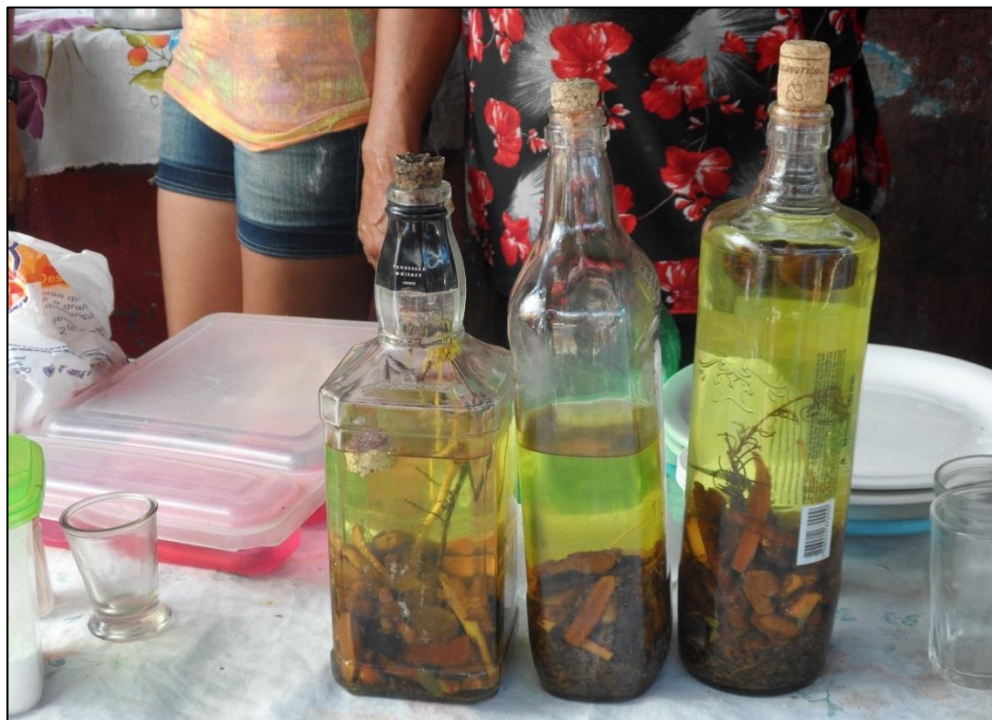
Figura 7 – Cachaça temperada com vários tipos de ervas. 2014.

Na Feira Livre de Itapororoca-PB, a tradicional cachaça temperada (figura 7), o rolo ou pacote de fumo (figura 8) e os cachimbos (figura 9), dentre outros, são elementos que reforçam a cultura popular e que estão presentes nos dias de feira em Itapororoca.