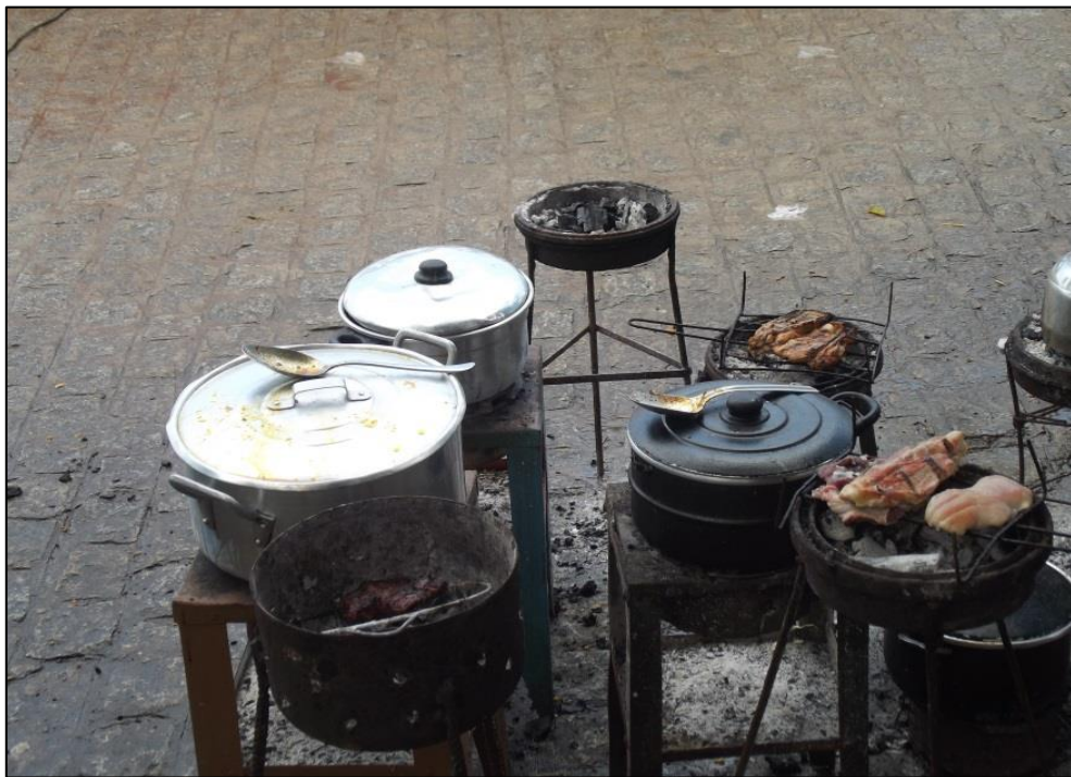
Figura 16 - Alimentos sendo preparados para a alimentação. 2014.

As bancas de lanches ao ar livre agregam muitas pessoas para saborear as comidas típicas. Aí se encontram ricos e pobres, negros e brancos, crianças e adultos. Ao chegar à feira já se observa estas bancas reunindo pessoas desde as seis horas da manhã. As pessoas estão sentadas ou em pé tomando seu café da manhã ou lanche. Para essa refeição existe uma variedade de alimentos que são preparados na feira (Figura 16), podemos encontrar macaxeira, inhame, cuscuz, carne bovina ou suína assada na brasa, frango, suco de frutas, café, etc. Encontram-se outras barracas que oferecem salgados, cachorro-quente, caldo de cana feito na hora e, também barracas que oferecem apenas comidas à base de milho (Figura 17).