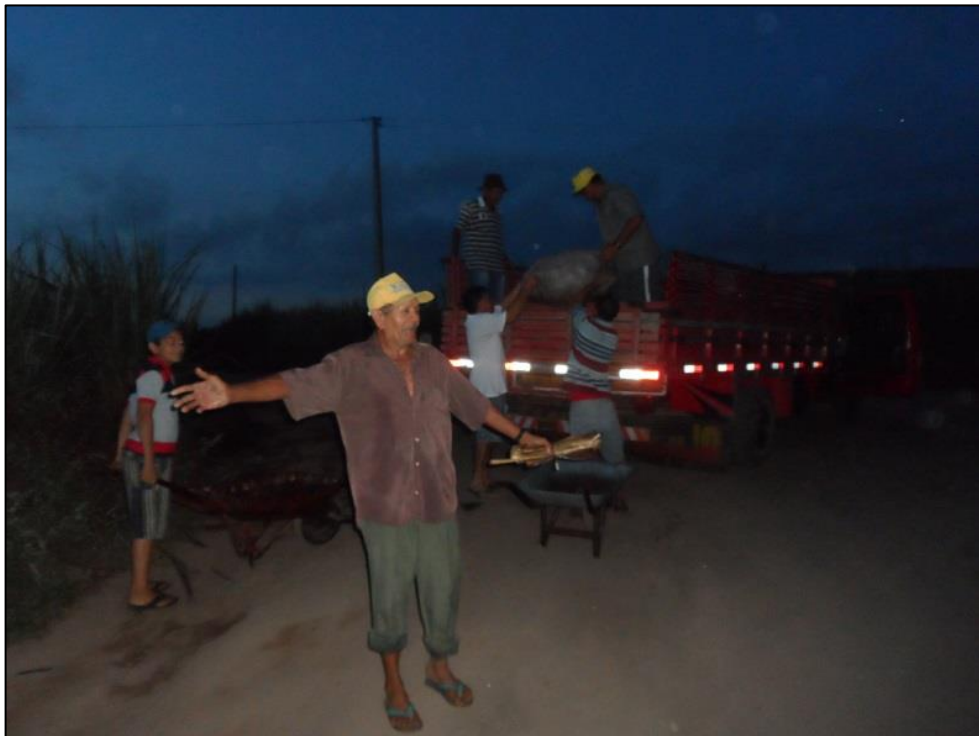
Figura 23 - Feirante saindo da zona rural para à feira na cidade. 2015.

mulheres, inclusive eu, na parte interior, e seis homens na parte superior. Chegando à cidade tivemos alguns momentos de tensão devido à quantidade de carros estacionados nas ruas. Quando enfim chegamos ao local de estacionar os caminhões, desci e fiquei esperando o descarregamento das mercadorias. Observei que havia um homem dormindo na calçada e ao seu lado um carro de mão. Uma das mulheres que estava comigo disse que era um cabiceiro. Eu rapidamente perguntei o que seria. Ela disse que são os homens que carregam as mercadorias do caminhão até o banco de feira. Adentrando na feira percebi que já tinha alguns fregueses em uma barraca de lanche esperando por esses feirantes que acabaram de chegar. Coloquei o meu crachá no qual indicava nome, instituição e curso com as assinaturas necessárias – achei conveniente fazer uso de um crachá devido aos “olhares estranhos” nos momentos em que fotografava a feira – e fui andar pelas ruas da feira, nesse dia andei por todas as ruas ocupadas pelas bancas e observei que nesse horário, entre 6 e 7 horas da manhã, tinha poucos fregueses na feira. (diário de campo, 20 de abril de 2015).