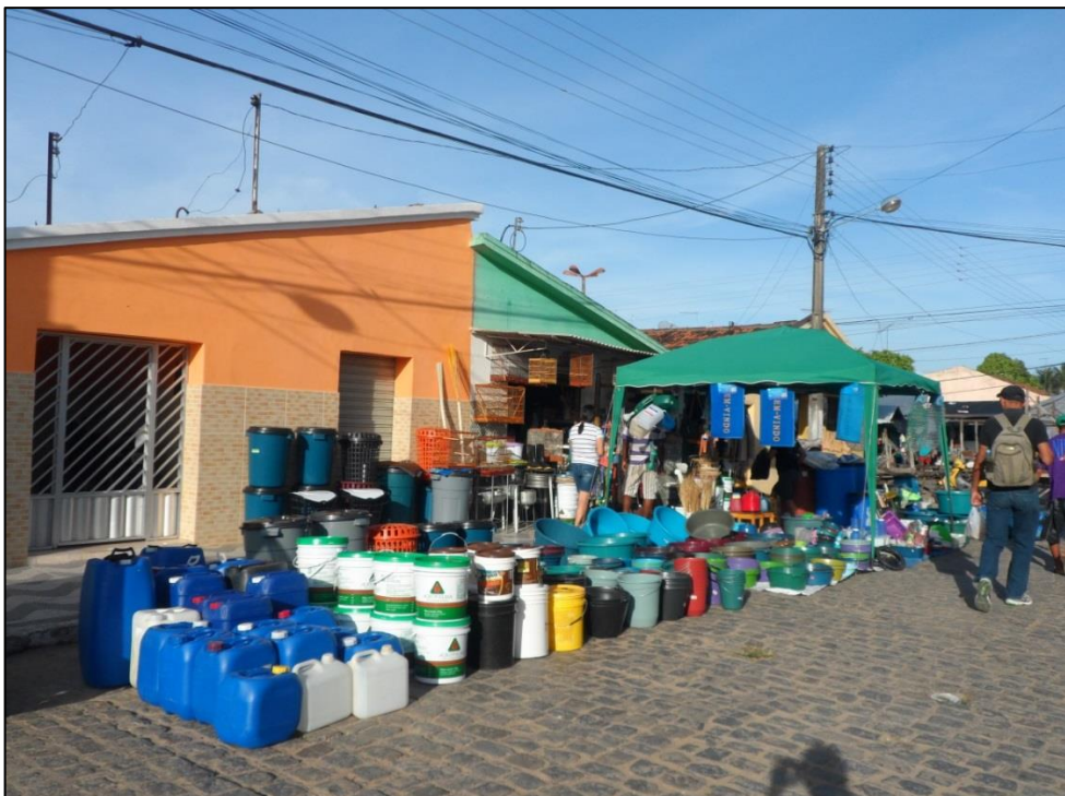
Figura 26 - Produtos expostos à venda sobre o solo. 2015.

Por fim, o Artigo 42, paragrafo 2º, entende que nenhum produto deve ser exposto à venda colocado sobre o solo, mesmo que forrados por lonas ou similares. Nesse caso, notamos que esta norma também é descumprida (Figura 26), não havendo nenhuma fiscalização do poder público que venha impor que estas normas sejam cumpridas de acordo com a lei.