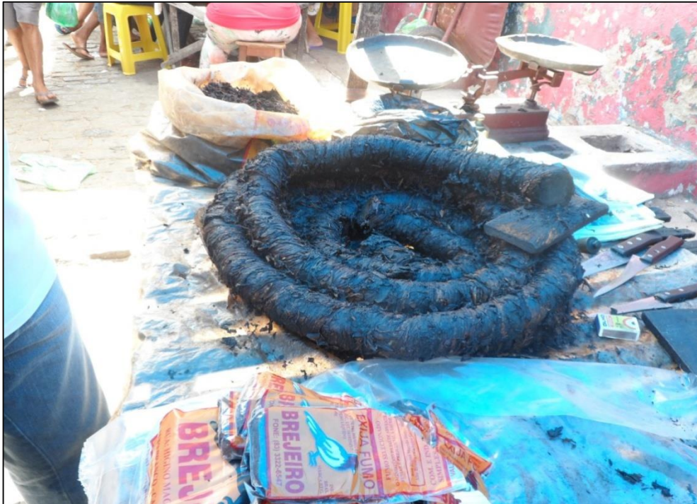
Figura 8 – Rolo de fumo. 2014.