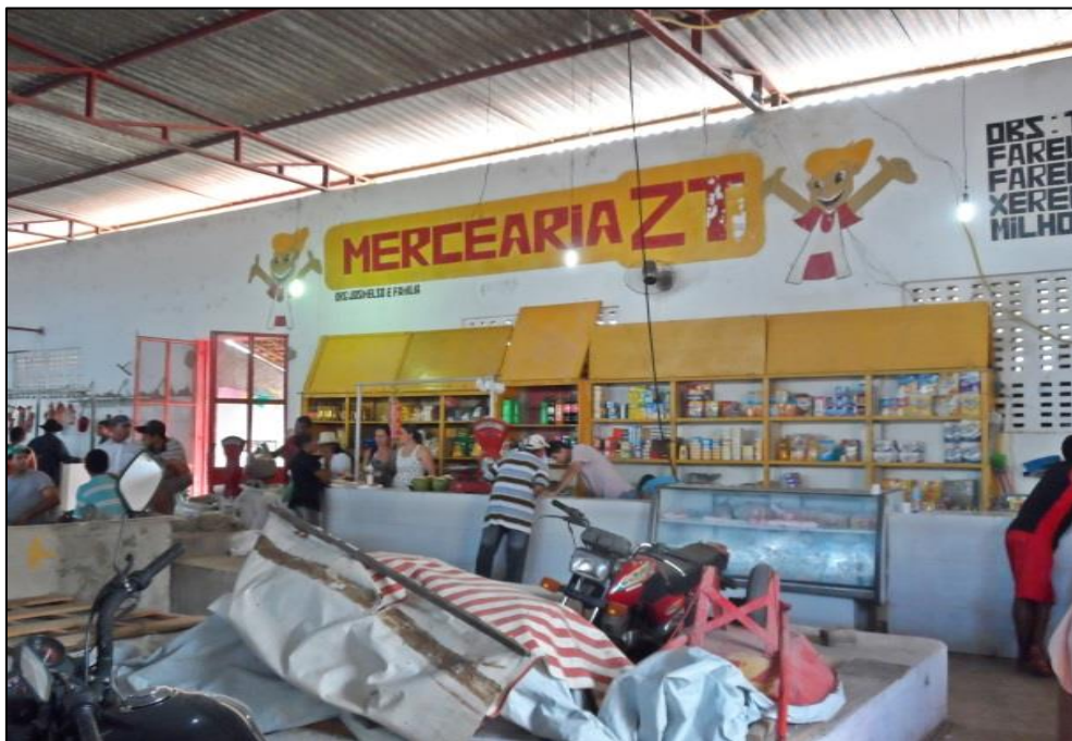
Figura 13 - Produtos industrializados a venda dentro do Mercado. 2014.

Podemos considerar que é a partir do Mercado que se fundamenta o comércio local, pois este está presente desde o surgimento da cidade e permanece até os dias atuais servindo como uma alternativa importante e, em alguns casos, principal fonte de renda dos comerciantes.