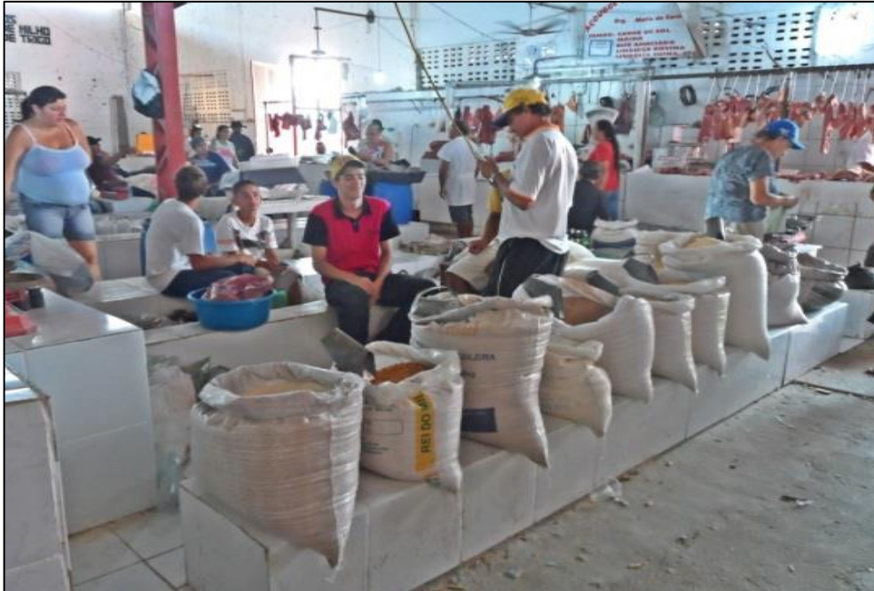
Figura 12 - Produtos expostos em sacos para a venda dentro do Mercado. 2014.