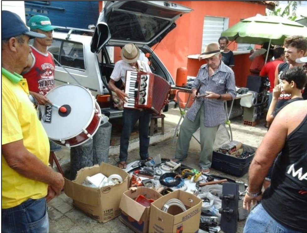
Figura 21 – Grupo de forró Pé de Serra na feira da Jarambada. 2015.

convidados a se apresentar em lanchonetes ou em uma parte da feira destinada a venda e troca de produtos usados, a categoria nativa usada para definir este espaço é Feira da Jarambada.