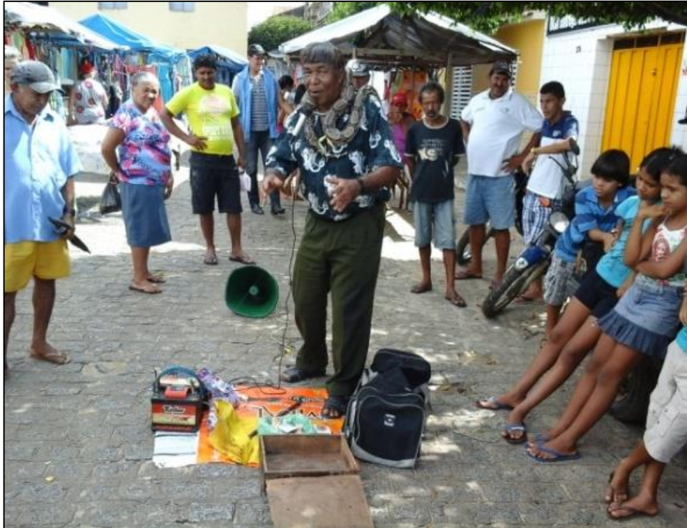
Figura 20 (A)- Performance do índio. Observa-se a cobra em volta de seu pescoço e a pequena multidão ao seu redor. 2015.