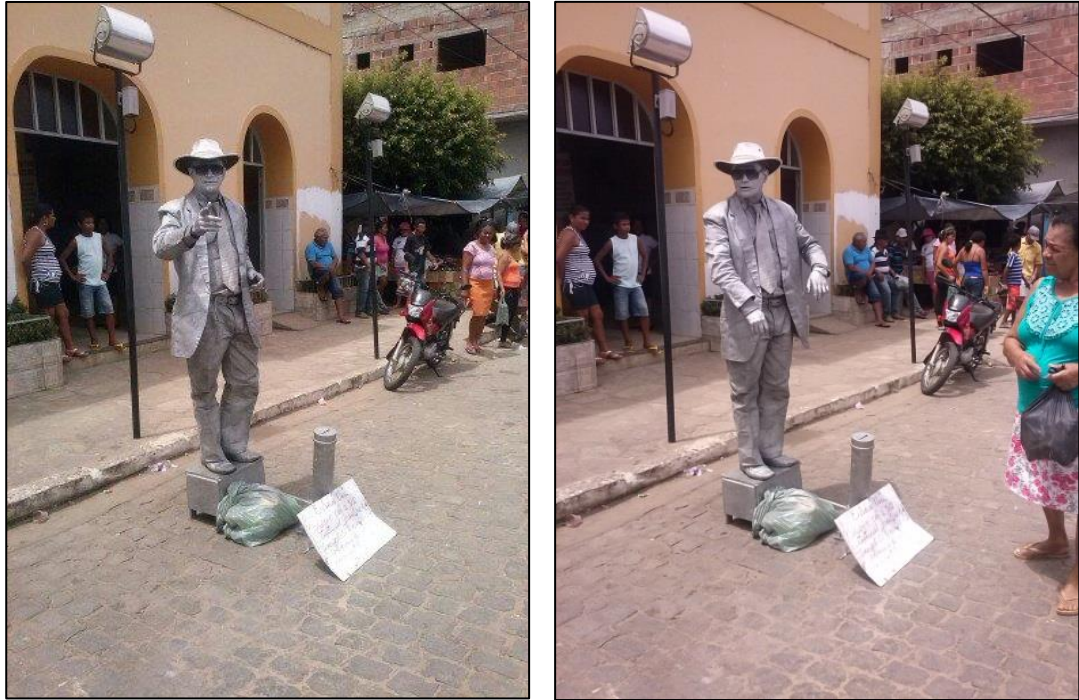
Figura 19 A e B – Performance do artista. 2014.

Noutra ocasião estava um índio feirante oferecendo seus produtos naturais, pomadas caseiras feitas de resina do coco do jaborandi e como estratégia de conquista utilizava uma cobra envolta em seu pescoço, além do casal de cobras que dizia ter em sua mala. Durante sua apresentação anuncia no microfone que vai exibir esse casal, mas vai embora e não o expõe. Algumas crianças que assistem a apresentação afirmam que o índio não carrega o casal de cobras que “ isso é mentira dele [índio] ”, porém, isso não impede que uma pequena multidão se forme ao seu redor para observar sua performance e comprar seu produto (Figura 20, A e B). Ele ensina, falando ao microfone, como se deve usar a pomada: “ mornar a resina, quando ela tiver desonerada com a água bem verdinha, coloca seis gotas no chá de capim santo ou erva cidreira e beber ”, ou massagear em cima da dor ou do machucado.