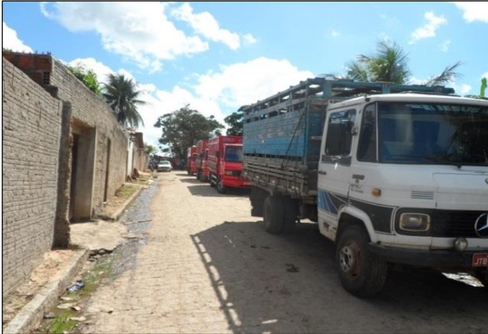
Figura 4 - Caminhão que transporta os animais. 2015.