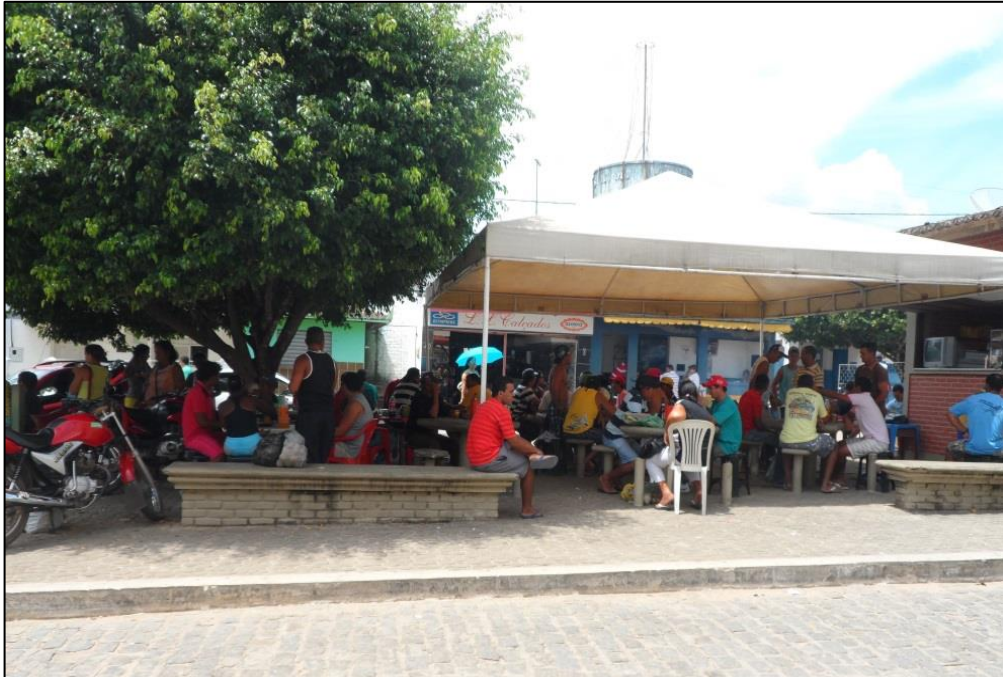
Figura 2 - Praça da Matriz no final da feira, aproximadamente, 12h00min. 09/03/2015.

De modo geral, as Praças fazem parte da vida da cidade e, geralmente, estão localizadas no centro destas. Suportam os principais acontecimentos, seja uma festa, uma feira, manifestações religiosas ou cívicas, enfim, todas estas contribuem para a presença de um público dinâmico e diversificado que atribuem sentido e significado as atividades desenvolvidas naquele espaço urbano.