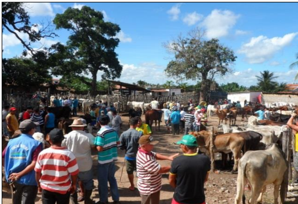
Figura 3 – Feira do gado em Itapororoca-PB. 2014.

Em Itapororoca, o local conta, além da exposição de animais, com um estabelecimento denominado “Bar do Curral” que oferece bebidas e petiscos para quem deseja comprar. O acesso ao Curral se dá por duas entradas, uma consiste num beco, espécie de rua bastante estreita; outra, por uma rua a qual serve de estacionamento para os caminhões que transportam os animais nos dias de feira (Figura 4), onde durante os demais dias da semana as bancas utilizadas pelos feirantes ficam guardadas (figura 5).