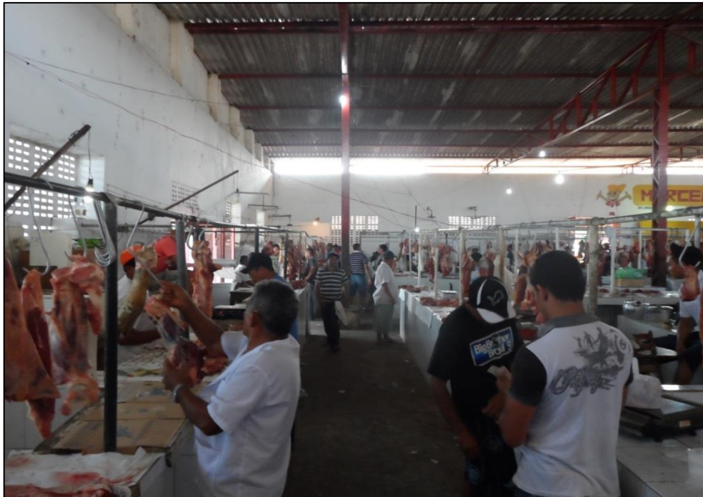
Figura 14 – Parte interior do Mercado Público Municipal. 2014.

Ao andar pelo Mercado observo muitas pessoas, principalmente homens, conversando sobre assuntos diversos. Os vendedores de carne estão sempre com um pano nas mãos espantando as moscas e limpando a tarimba 6 . Na figura 14 podemos observar uma parte do interior do Mercado. É um prédio que ocupa um quarteirão, as paredes são feitas de tijolos e cimentos com pequenas aberturas pintadas de cor branca, é coberto com telhas de fibrocimento e possui várias tarimbas, bem como, outras bancas feitas de cimento com ou sem cobertura de cerâmica nas quais se vendem produtos diversos.