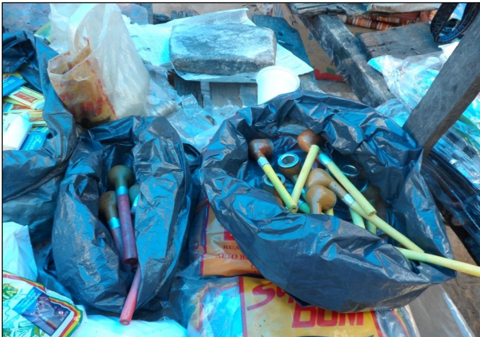
Figura 9 – Cachimbo exposto para a venda. 2014.

Pensando a feira por uma perspectiva da tradição podemos dizer que estes, assim como muitos outros elementos conservam o aspecto tradicional das feiras, haja vista que ainda permanecem e são objetos bastante procurados pelos fregueses.