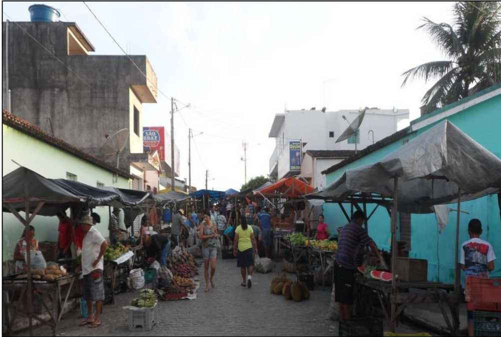
Figura 6 - Produtos agrícolas sendo comercializados na Feira Livre. 2015.

A feira pode ser entendida como um ponto de encontro entre o urbano e o rural, pois além de ser o lugar onde se encontra o produto bruto que sai da terra e vai para a mesa das pessoas, é também o local onde os costumes, valores e experiências são compartilhados pela população. Sabemos que o urbano está inteiramente associado à cidade, assim como rural está relacionado ao sítio. De acordo com Williams (1989) a ligação entre a terra, da qual se extrai a subsistência, e a cidade, considerada centro de realizações, sempre esteve evidente na história das sociedades humanas. A cidade seria considerada como uma forma distinta de civilização e associada ao centro de realizações de saberes e comunicações, enquanto o campo associava-se a uma forma natural de vida, local de paz e simplicidade. Com isso surgiram pontos negativos e positivos que caracterizaram a cidade como local de barulho e ambição e o campo como lugar de atraso, ignorância e limitação. Diante disso, a cidade parece ser símbolo de modernidade e o campo não e essa diferença acaba resultando em diferenças entre o modo de vida urbano e rural.