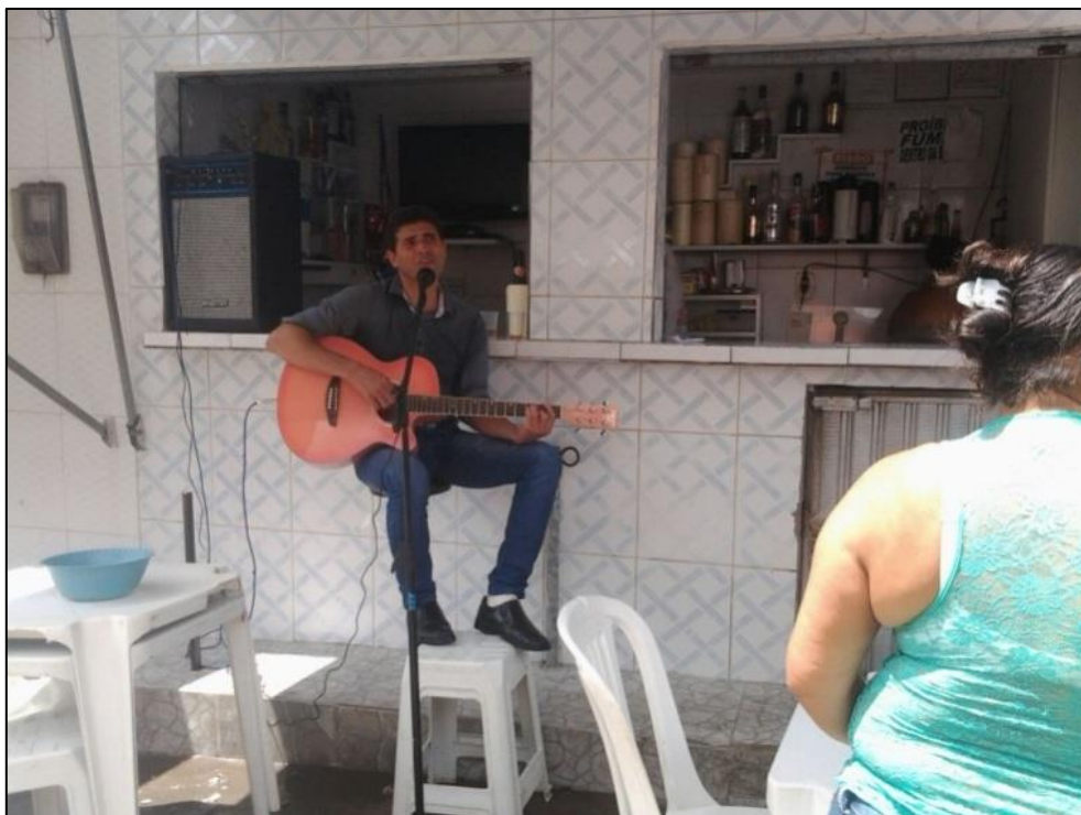
Figura 22 - Cantador de viola em uma lanchonete. 2014.