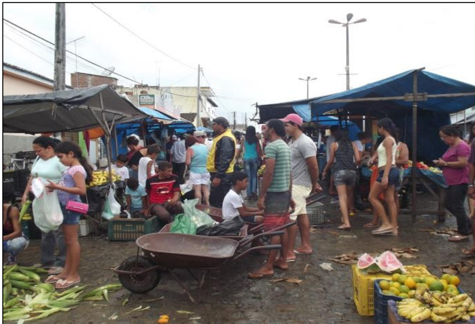
Figura 28- Meninos com carros de mão no corredor da feira. 2014.

Apesar do trabalho na feira ser cansativo, 100% dos feirantes com quem tive contato afirmaram gostar de ir à feira e acreditam que ela seja muito importante, afinal é de onde boa parte dos entrevistados consegue o dinheiro para sua sobrevivência. Segundo Neide: