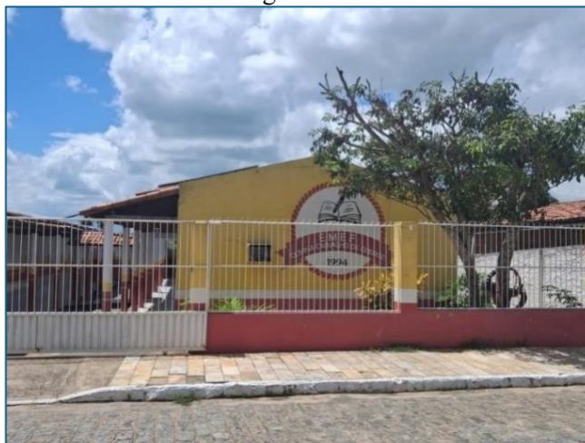
F1: Imagem da Escola