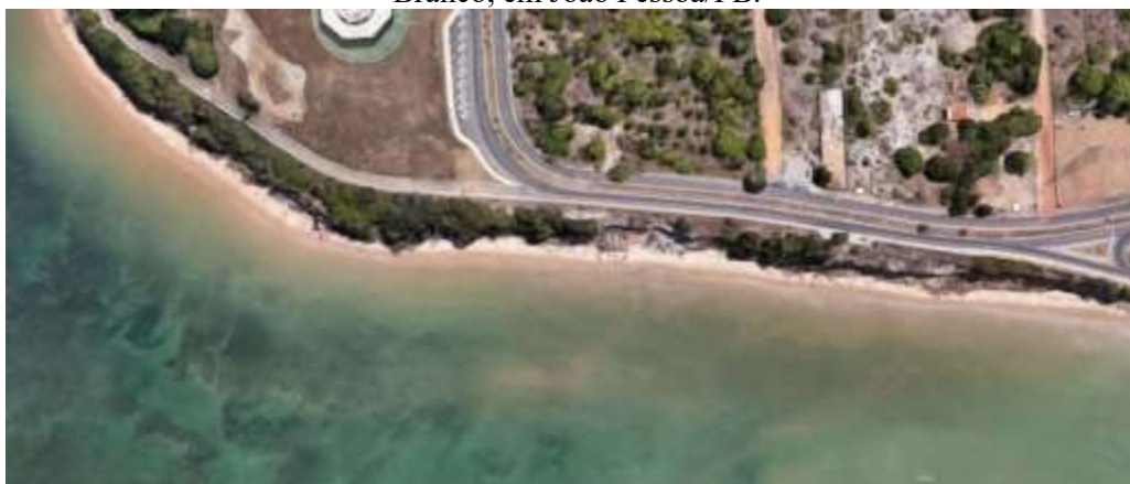
Figura 10: Imagem de satélite das Falésias do Cabo Branco e da região do bairro do Altiplano/Cabo Branco, em João Pessoa/PB.

As zonas costeiras são alvo de grande especulação de suas paisagens, e geralmente, são meios de conflitos ambientais e de litígios envolvendo construções e ocupações irregulares, e/ou prejudiciais as áreas do solo metropolitano. No caso das Falésias do Cabo Branco, o crescimento metropolitano da cidade de João Pessoa ao sudeste, em direção a cidade do Conde, pode ser atribuído a ocupação erigida sobre grande parte de sua construção rochosa que formam as falésias. O bairro do altiplano, que antes não tinha liberdade para construir, viu sua paisagem ser modificada em poucos anos, com altos edifícios, numa verticalização intensa e veloz. A figura 10 mostra, através de uma imagem por satélite, o adensamento de construções e vias urbanas sob a estrutura geológica da falésia.