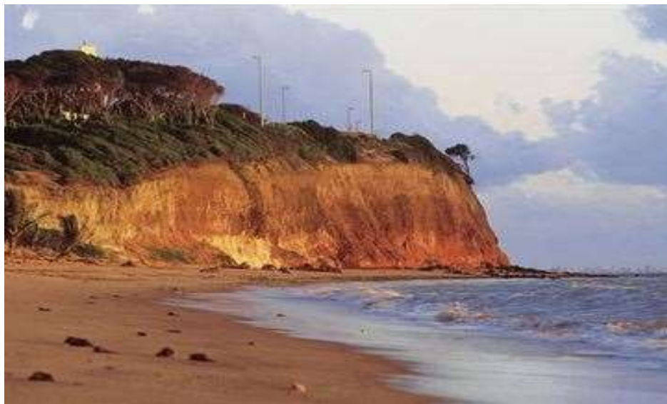
Figura 9: Imagem das Falésias do Cabo Branco, João Pessoa/PB.

Para que tal descrição possa ser melhor visualizada, apresentamos na figura 9 uma foto da referida paisagem: