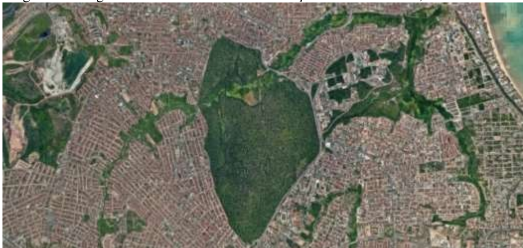
Figura 5 – Imagem Satélite Unidade de Conservação em Zona Urbana, João Pessoa/PB.

uma área de zona de Unidade de Conservação (Refúgio de Vida Silvestre Mata do Buraquinho) em incrustada em meio a paisagem urbana na cidade de João Pessoa-PB: