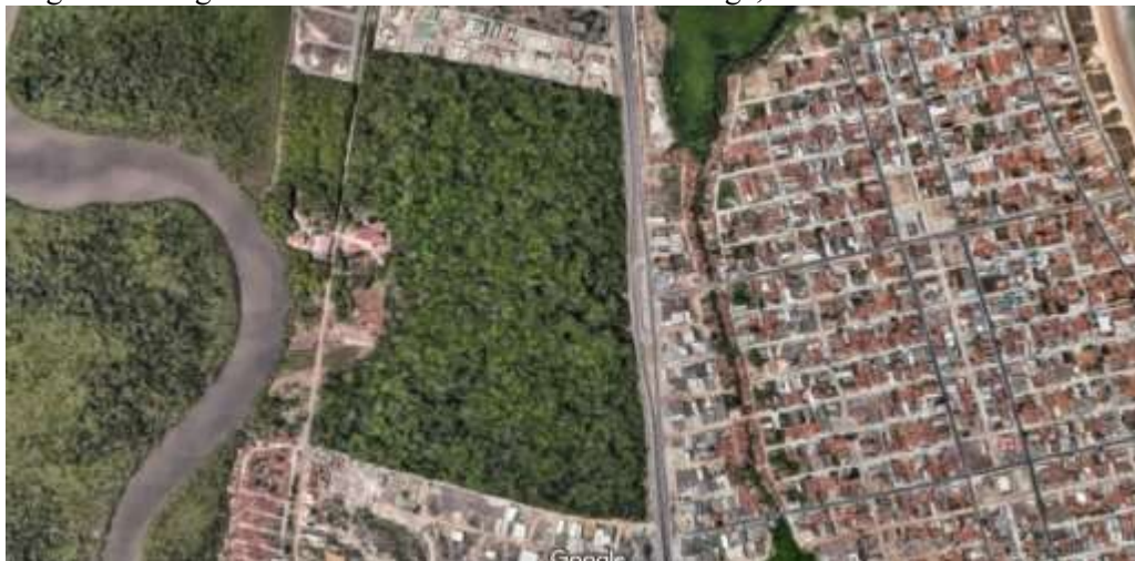
Figura 6: Imagem Satélite Floresta Nacional da Restinga, João Pessoa e Cabedelo/PB.

No contexto da capital de João Pessoa-PB, por exemplo, existe a paisagem que cerca a área rural, que é a região da Unidade de Conservação Floresta Nacional da Restinga de Cabedelo (FLONA), que não só abrange o município de João Pessoa, como também o de Cabedelo-PB. O crescimento existente no conjunto metropolitano de João Pessoa, formado também pelos municípios de Santa Rita, Bayeux e Lucena, gera repercussões diretas sobre o estuário do Rio Paraíba e na zona costeira, afetando, assim, diretamente a paisagem da unidade da Restinga (ICMBIO, 2016). A figura 6 mostra como a urbanização da zona costeira é limítrofe com as áreas de proteção especial e com as áreas de grande concentração da mata, tangenciando o rural.