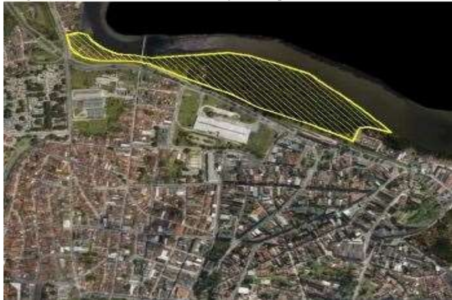
Figura 8: Área de intervenção do Projeto Parque Sanhauá, João Pessoa/PB.

Diante desse cenário, acrescentamos a informação de que um mirante com função de garantir a contemplação da área do Parque Sanhauá, do rio e do centro histórico de João Pessoa, também seria construído de maneira adjacente, para reforçar pontos de observação do lugar, com a utilização adstrita ao pagamento (SECRETARIA DE PLANEJAMENTO, 2015). A Figura 8 traz um destaque gráfico que especifica a área de intervenção do Projeto Parque Sanhauá, abarcando as áreas das comunidades do Porto do Capim e Vila Nassau.