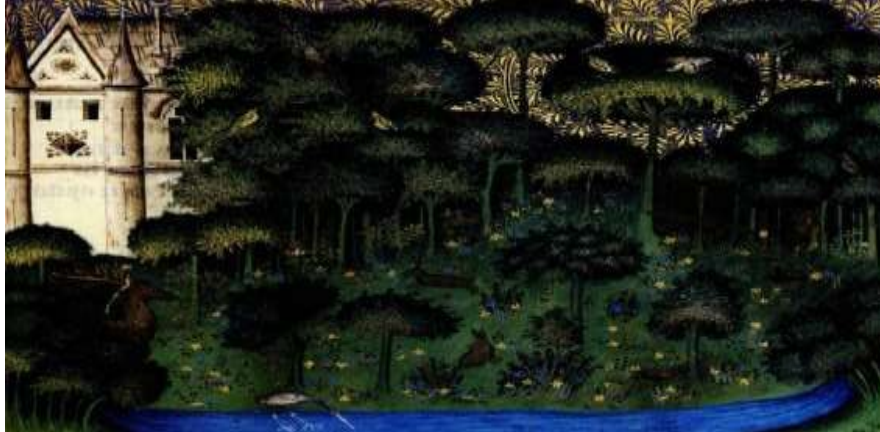
Figura 1- A paisagem como expressão naturalista.

Fonte: Guillaume de Machaut, Le Printemp. Obras poéticas . França Parchemin, Paris, Biblioteca Nacional da França, p. 103. 9