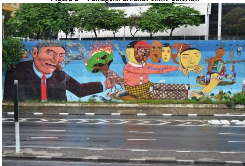
Figura 2 – Paisagens urbanas como galerias.

É importante destacar que o estudo da estética ambiental também abarca paisagens modificadas pela ação humana, de modo intencional. No entanto, essa interferência deve ser analisada para além de categorias temáticas, mas através de processos históricos e espaciais, em concentrações nodais na geografia espacial (SOJA, 2010, tradução nossa) 11 . Desse modo, primariamente, não seriam o produto de um design humano intencional – ao guiar o olhar do observador em seções de galerias –, curatorial, pois diferem dos ambientes naturais, mesmo que modificados pela atividade humana. As figuras 2 e 3 ilustram a arte na paisagem urbana, através de pinturas.