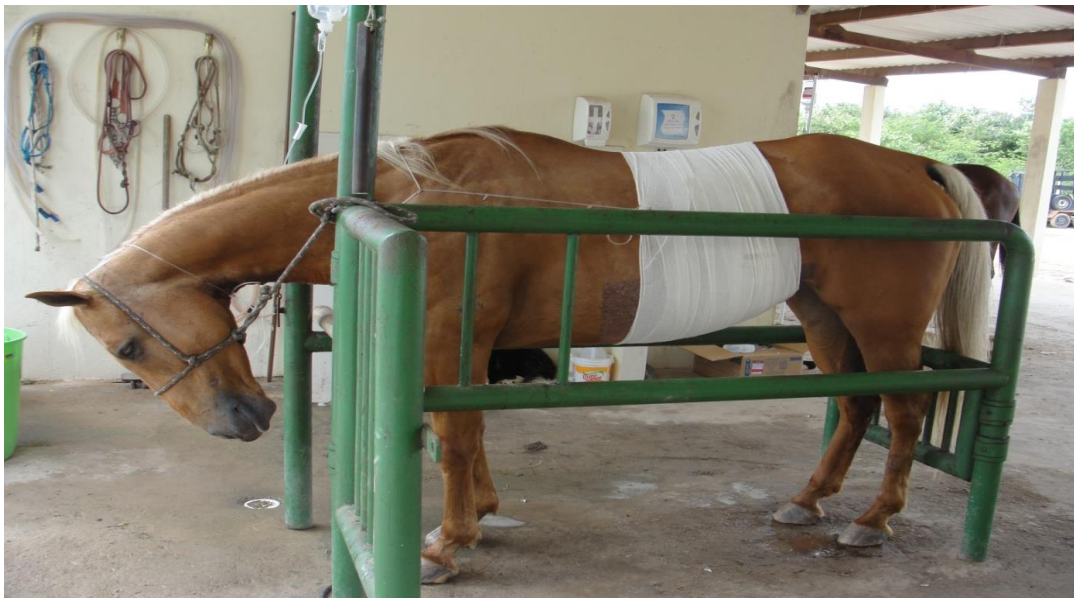
Figura 1. Nutrição Parenteral em Equinos laparatomizados no.

Das vias citadas as que foram administradas no estágio de observação e acompanhamento nos equinos laparatomizados primeiramente foi nutrição parenteral, onde a metodologia implantada pelo Centro Integrado de Tratamento de Equinos (C.I.T.Equin), é adotada logo após a cirurgia, onde o animal passa 48 horas em jejum hídrico e sólido e dentro desse intervalo que é mantido através de um pool de vitaminas, aminoácidos, eletrólitos, soro fisiológico c/ ringer lactato, (Fig.1), onde tem a função de fornecer dieta preparatória já que o animal apresenta varias dificuldades como anorexia forçada, perda de massa muscular, perda de gordura e boa parte da microbiota foi lavada via colon. Essa dieta preparatória é de aporte calórico, proteico e eletrólito.