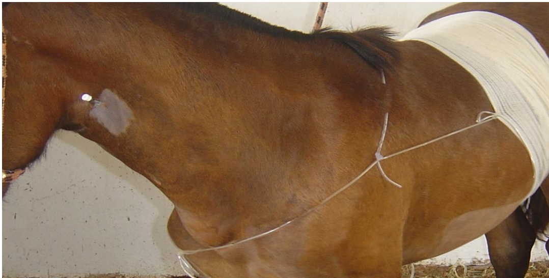
Figura 3. Cateter fixado na jugular para a nutrição parenteral.

As necessidades nutricionais de equinos enfermos são desconhecidas, podendo variar em função de uma série de fatores, como por exemplo, a idade, sexo, massa corpórea magra, área de superfície corporal, temperatura ambiente e nível de atividade física (DUNKEL; WILKINS, 2004). A nutrição parenteral envolve à administração de soluções hipertônicas contendo glicose, aminoácidos, lipídios, vitaminas, eletrólitos e oligominerais. Essas soluções devem ser administradas continuamente através de cateter jugular (SMITH, 2006). (Fig.3).