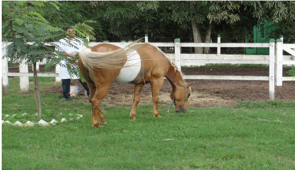
Figura 2. Fornecimento de gramíneas na forma de pastejo.

refluxo, para em seguida começar a oferecer água e sólidos (probióticos, gramíneas e concentrado), a metodologia administrada no hospital logo após o intervalo de 48 horas é o fornecimento das gramíneas em forma de pastejo (Fig.2), por no máximo 1 minuto. Neste intervalo observa-se o comportamento do cavalo quanto a deglutição, apreensão do alimento e apetite presente. Se faz esse procedimento 6 vezes ao dia de 4 em 4 horas.