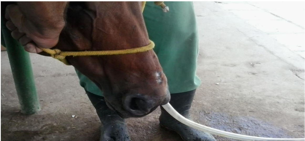
Figura 4. Sondagem nasogástrica.

É muito importante que, antes do início da terapia de suporte nutricional, seja feito o restabelecimento das normalidades hídricas, eletrolíticas e ácido base. Essa técnica é realizada com a sondagem do animal pela via nasogástrica (Fig.4), em caso de necessidade do animal passar muito tempo com a sonda é aconselhável a passagem de uma com menor diâmetro e macia.