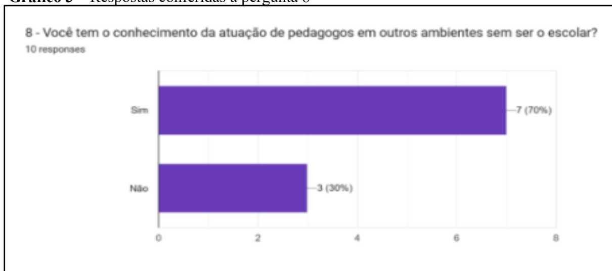
Gráfico 3 – Respostas conferidas à pergunta 8

Para começarmos a dialogar sobre a atuação do pedagogo em Espaços Não Escolares (ENE), a oitava pergunta foi: Você tem o conhecimento da atuação de pedagogos em outros ambientes sem ser o escolar? As respostas seguem no próximo gráfico: