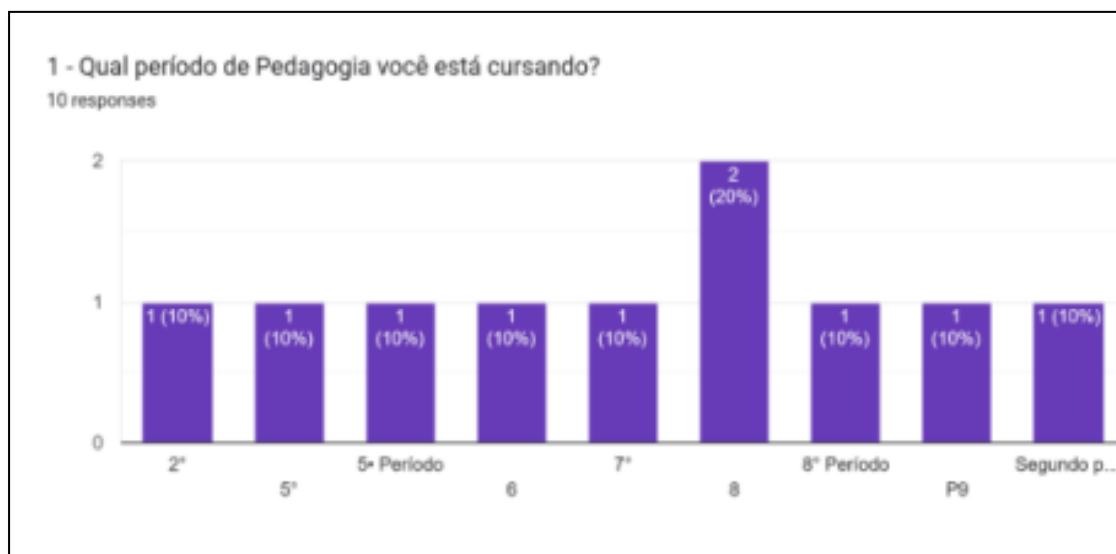
Gráfico 1 – Respostas atribuídas à pergunta 1