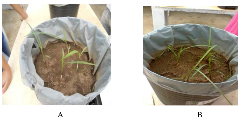
Figura 2. Desbaste das plantas (A) e Corte de uniformização (B).

Após 20 dias da emergência das plantas, ocorreu o desbaste (Figura 2A), e adubação de estabelecimento. No desbaste foram mantidas quatro plantas/vaso; enquanto que a adubação de estabelecimento consistiu da aplicação de 250,7 \text{ kg N/ha} , 249,29 \text{ kg P/ha} (18% \text{P}_2\text{O}_5 ) e 84,5 \text{ kg K/ha} (60% \text{K}_2\text{O} ), cujas fontes: sulfato de amônia, superfosfato simples e cloreto de potássio, respectivamente. Foi realizado corte de uniformização após sete dias do desbaste, numa altura de 10 cm acima do solo. (Figura 2B).