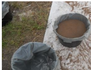
Figura 1. Vaso com solo peneirado

O solo, utilizado para plantio da forrageira, apresentou textura franco-argilo-arenosa, obtido da camada arável com profundidade de aproximadamente 20 cm. O material foi peneirado com crivos de 6 mm (Figura 1) e seguido da secagem ao ar.