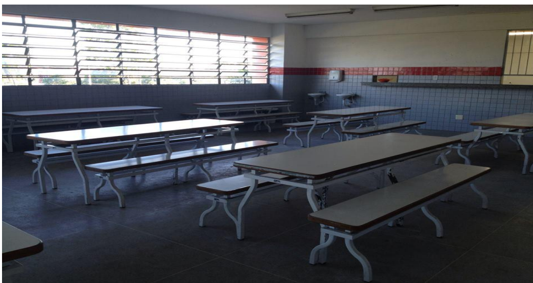
Foto 3 Parte interna da Escola referente ao refeitório.

No outro lado do corredor podemos observar a escada para subida dos alunos ao primeiro andar, e também os banheiros, masculino e feminino, a cozinha, e o refeitório (foto 3) que possui várias mesas e banquinhos, sendo também um espaço grande.