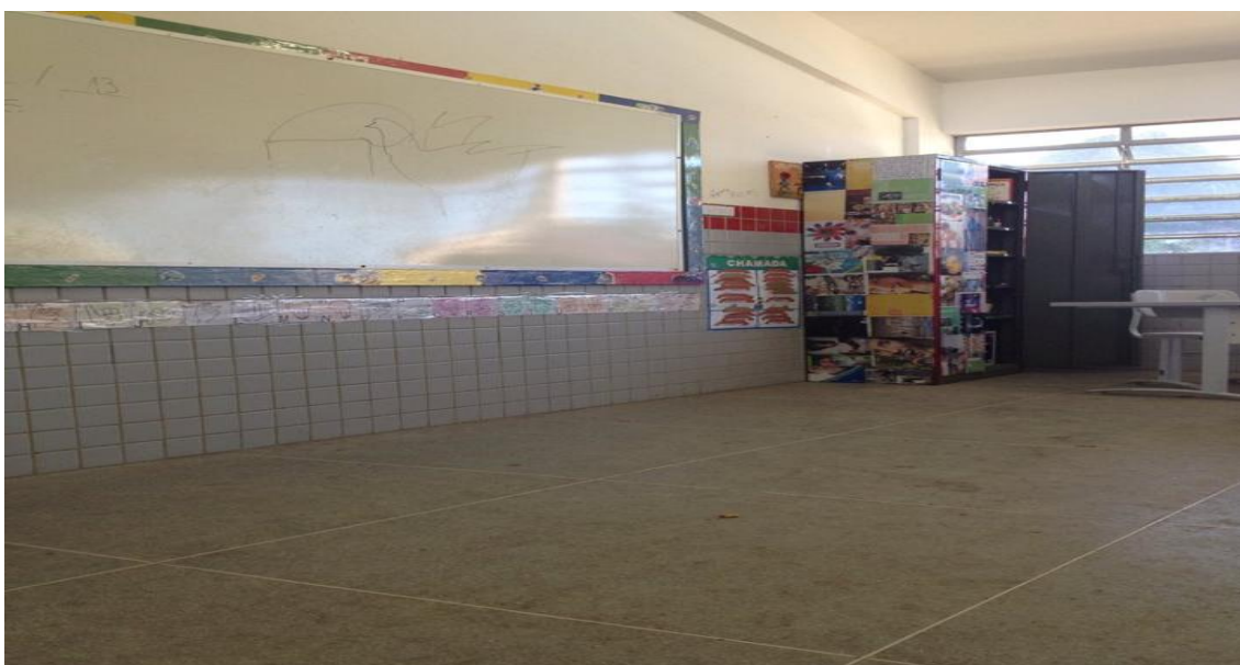
Foto 8 Caracterização da sala de aula do pré II.

E, por fim, na frente da sala temos do lado esquerdo o birô da professora, do lado oposto da porta, a lousa no meio da parede da frente, com a moldura colorida, com cores fortes, e no canto esquerdo da frente da sala tem outro armário fechado, todo revestido com gravuras e imagens coloridas, contendo mais materiais para as crianças, como tesoura, cola etc (foto 8).