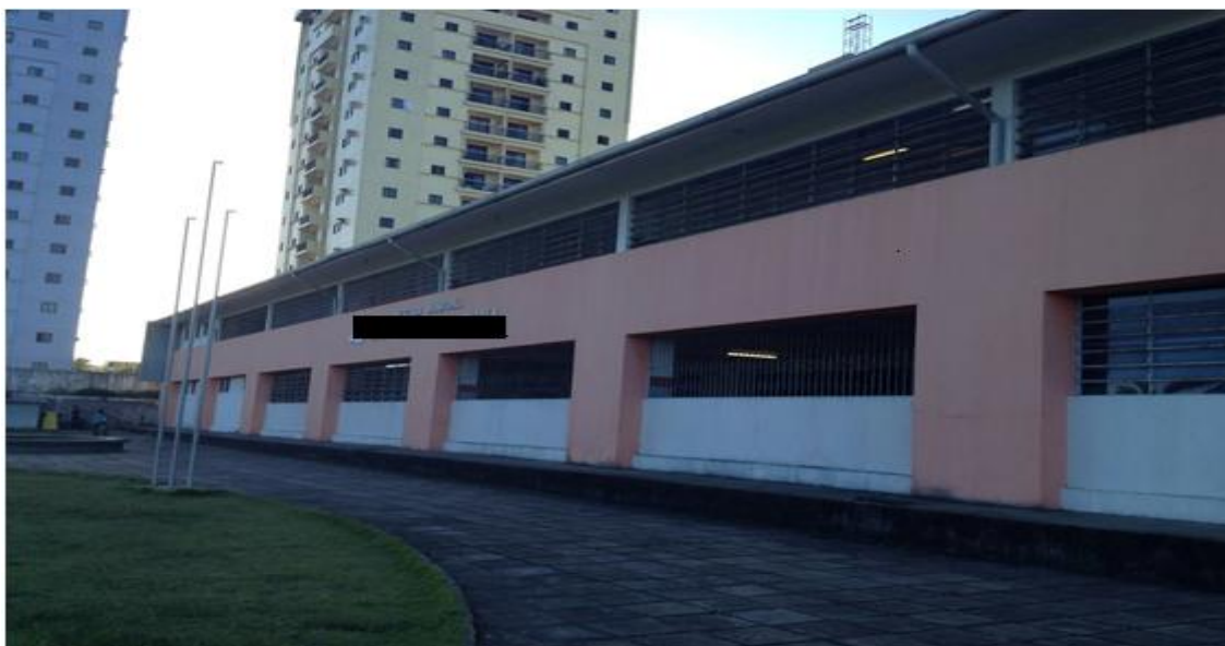
Foto 1 Fachada da Escola. Campo da pesquisa.

A escola tem uma estrutura física grande e espaçosa, como podemos visualizar na foto 2 1. Na parte externa tem o ginásio, que fica do lado de fora do prédio. Na parte interna, tem a biblioteca (foto 2) que possui um bom acervo de livros, que são novos, e estão disponíveis para as crianças levarem para casa para leitura, mas, os livros para a educação infantil ficam na própria sala de aula, e não na biblioteca. Ao lado da biblioteca tem o auditório, onde muitas vezes ocorreram aulas de educação física para a educação infantil, em virtude de o ginásio estar ocupado com turmas maiores.