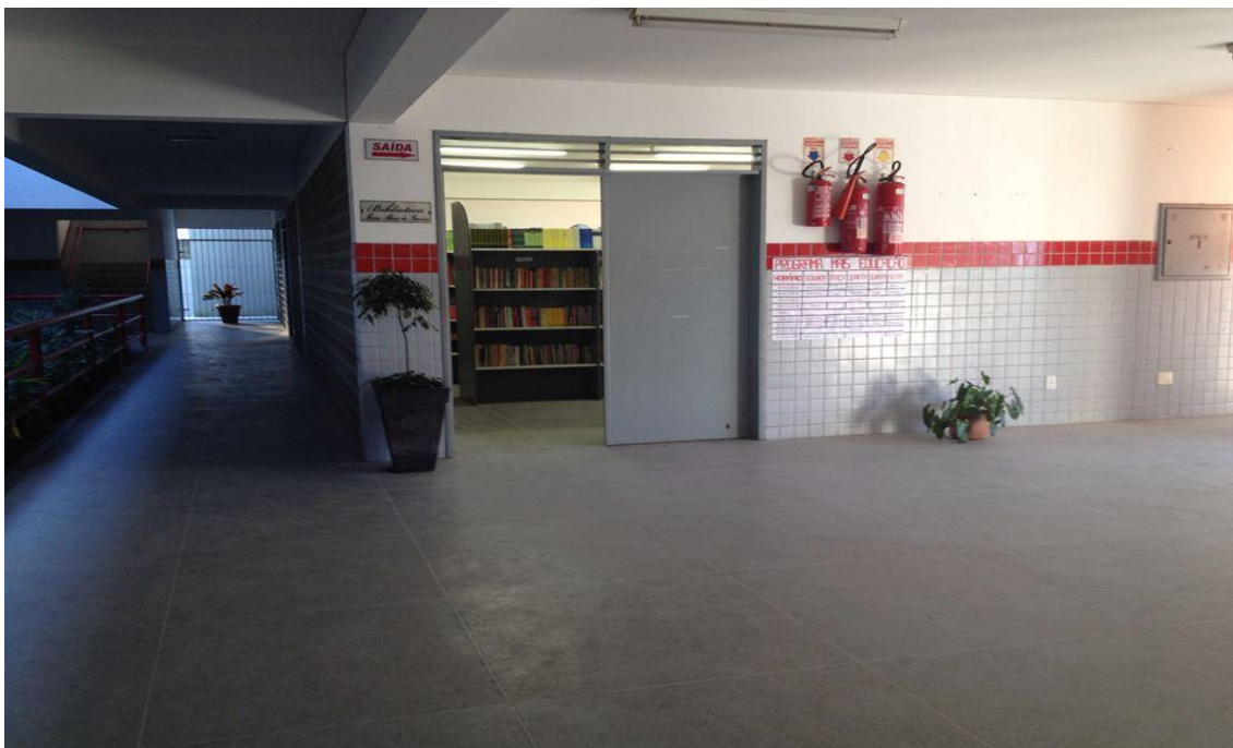
Foto 2 Parte Interna da Escola referente à biblioteca.