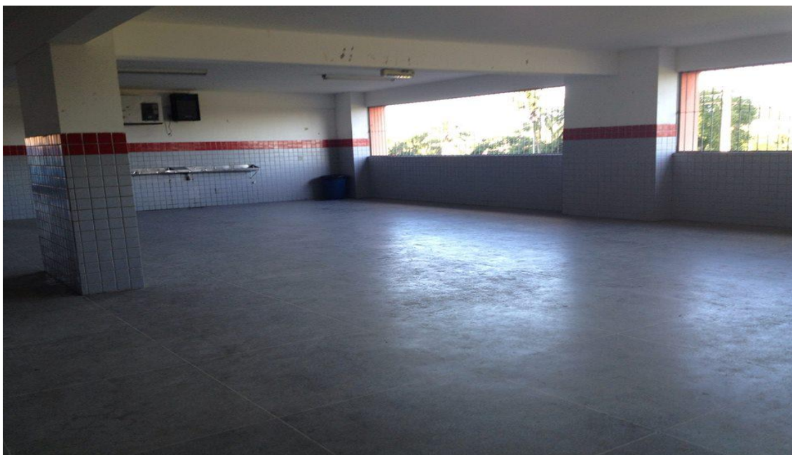
Foto 4 Parte interna da Escola referente ao pátio.

Depois do refeitório tem o pátio (foto 4), com bebedores, e umas salas, onde é desenvolvido o Projeto Mais Educação, seguido da sala de almoxarifado da escola. Na frente tem a rampa, que também dá acesso ao primeiro andar. E do outro lado da rampa, temos a secretaria, onde atuam duas profissionais, a sala dos especialistas, onde atuam duas especialistas e a orientadora escolar, a sala dos professores, e a direção, com a vice-diretora da tarde, e a diretora geral.