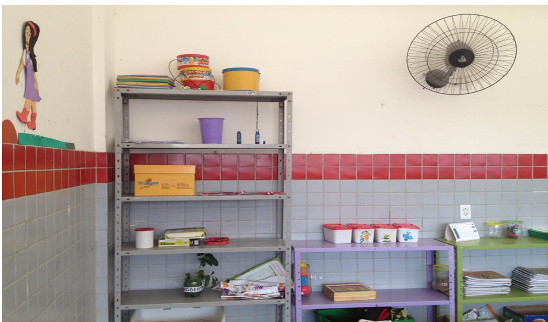
Foto 6 Caracterização da sala de aula do pré II.

No final da sala, do lado direito tem um armário aberto, com as pastas dos alunos, os cadernos de classe, os cadernos de desenho, lápis de cor, etc.; muito organizado e alegre. Além dos jogos, massinhas, materiais lúdicos, jogos de encaixe, onde, cada dia da semana as crianças recebem um material diferente para acolhida (foto 6).