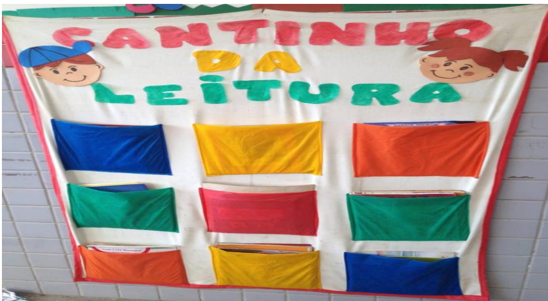
Foto 7 Banner do "Cantinho da Leitura" localizado na sala de aula do pré II.