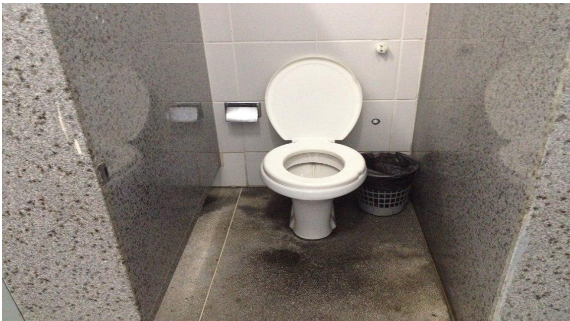
Foto 11 Parte interna da Escola referente ao banheiro utilizado pelas crianças do pré II.