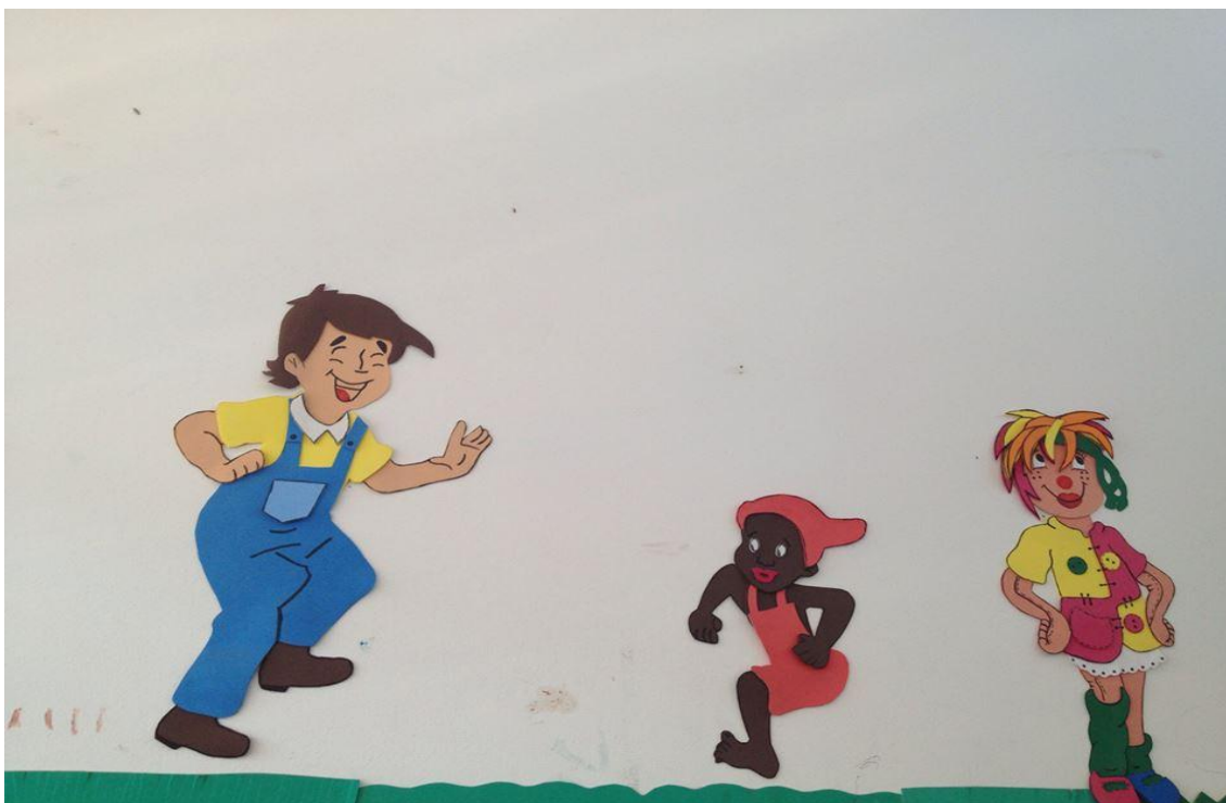
Foto 5 Decoração da sala de aula do pré II.