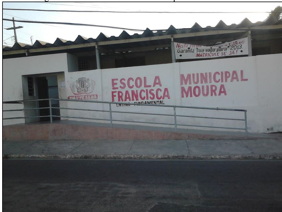
Figura 1 – Fachada da Escola Municipal Francisca Moura.