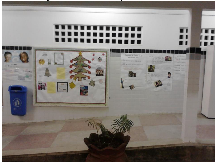
Figura 9 – Mural do Comitê pela Vida da Escola.

Fonte: Facebook da Escola Municipal Francisca Moura. Disponível em: < https://www.facebook.com/FM.com.br >. Acesso em: 04 set. 2013.