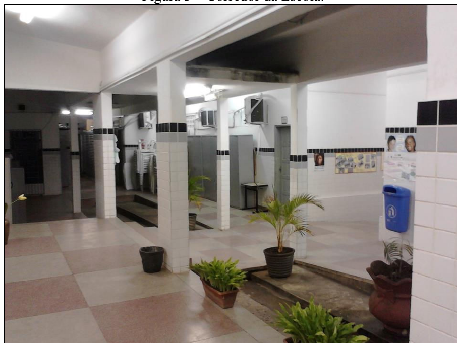
Figura 3 – Corredor da Escola.