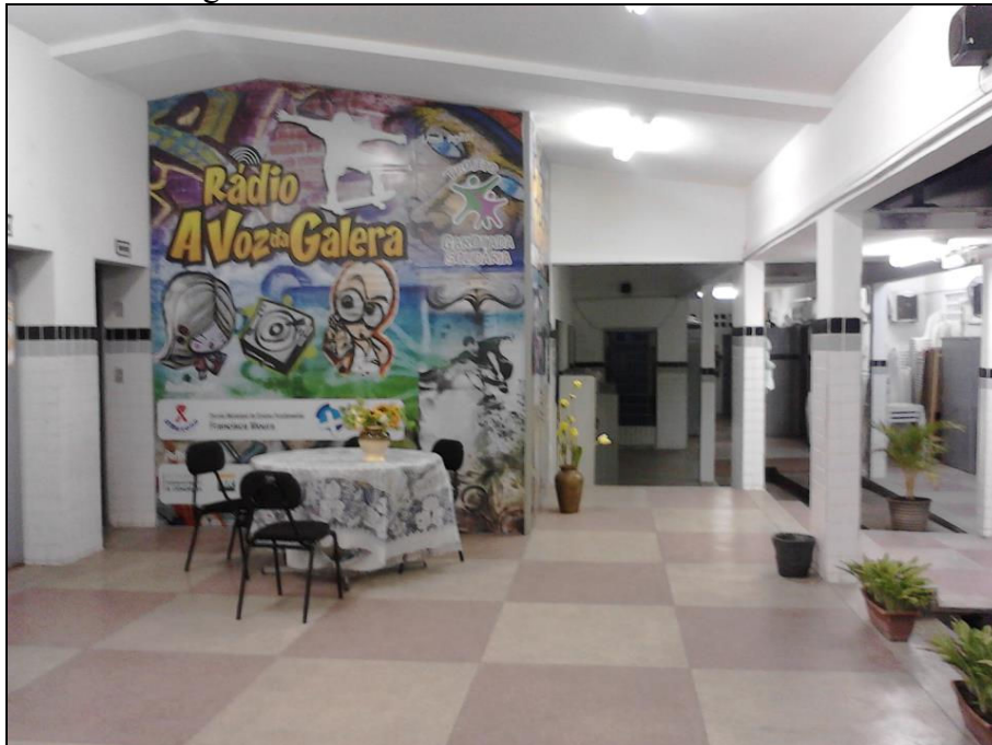
Figura 8 – Rádio “A voz da Galera” da Escola.