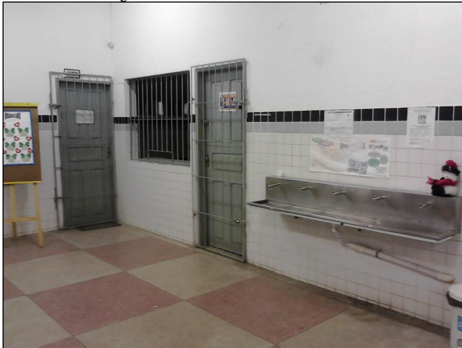
Figura 7 – Bebedouro e cantina da Escola.