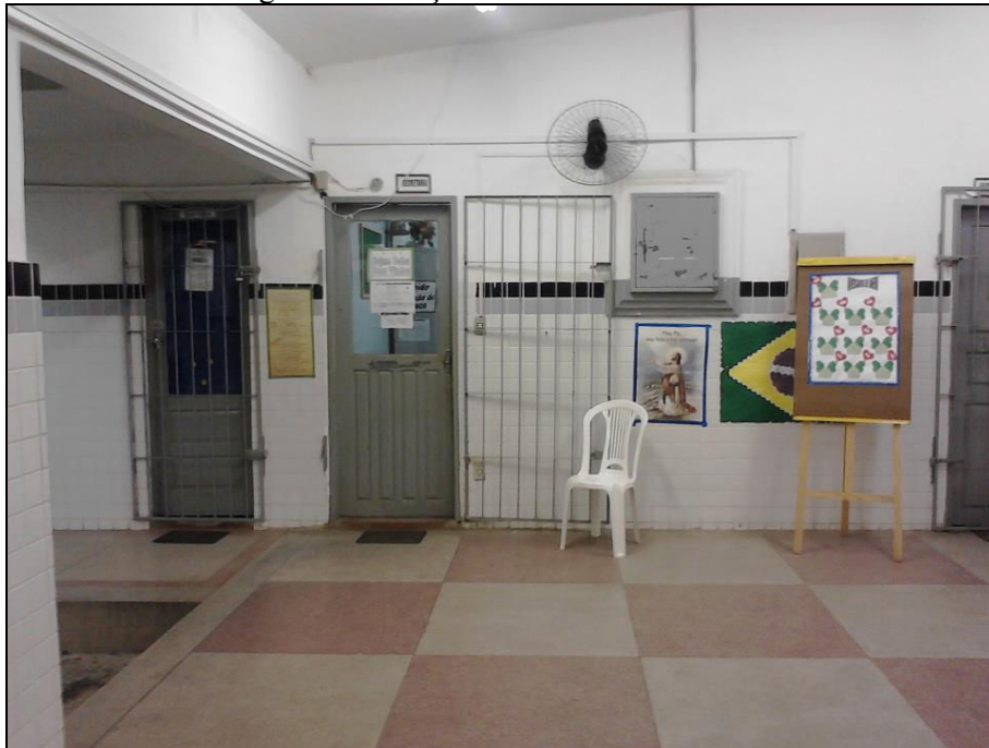
Figura 5 – Direção e Secretaria da Escola.