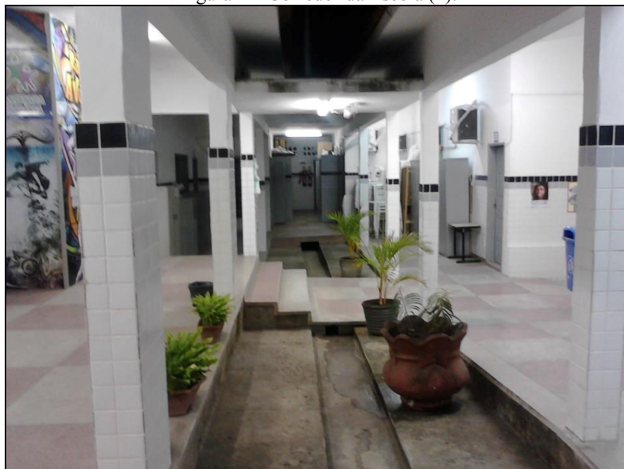
Figura 4 – Corredor da Escola (2).