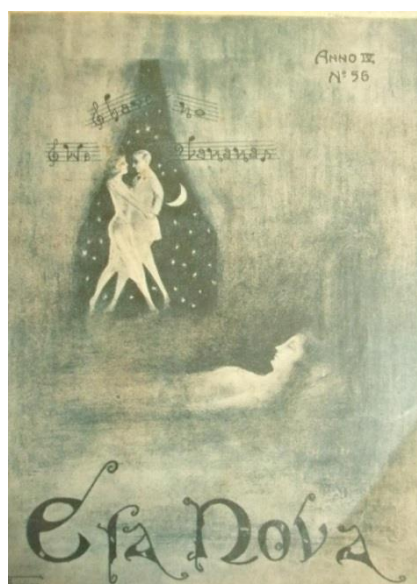
Figura 3 - Capa da Revista 'Era Nova'.

Esta conceituada revista do Estado da Parahyba do Norte abordava vários assuntos de grande importância, como política, ciência, filosofia, psicologia, sociologia, saúde, artes, eventos sociais, moda e, também, acontecimentos de outros estados do Brasil e, até mesmo, da Europa (DUARTE, 2001, p. 17).