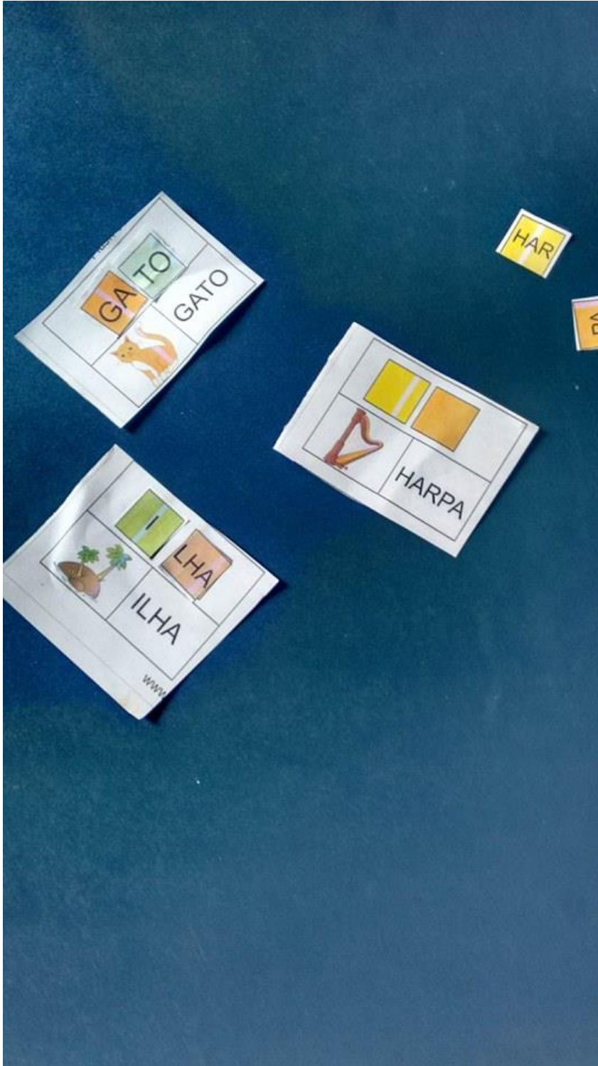
FOTO DA ATIVIDADE DESENVOLVIDA PELO ALUNO B