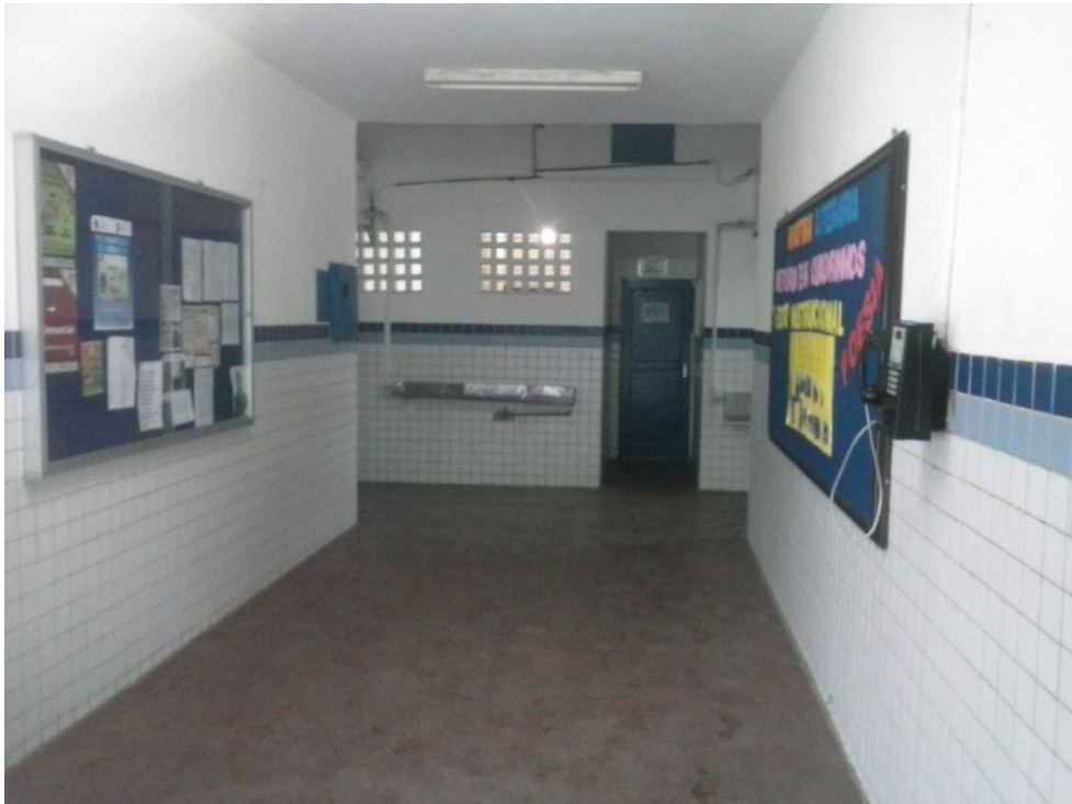
Figura 2 – Entrada da Escola Municipal General Rodrigo Otávio.