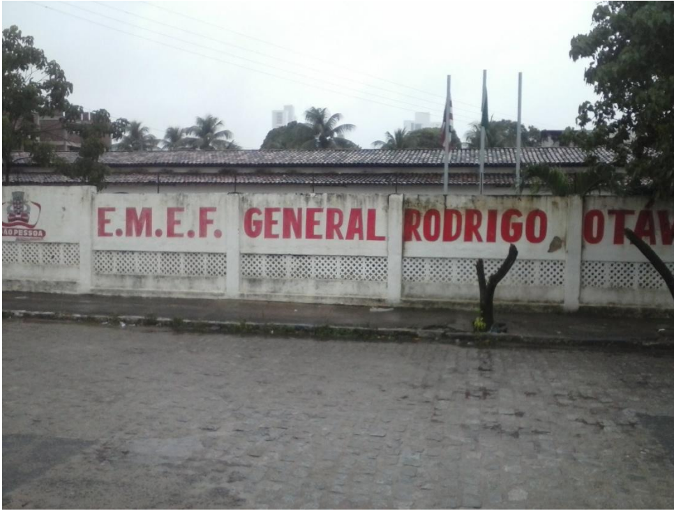
Figura 1 – Fachada da Escola Municipal General Rodrigo Otávio.