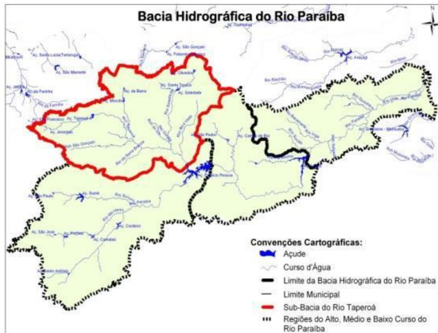
Figura 1 - Bacia hidrográfica do Rio Paraíba do Norte com suas Regiões de Alto, Médio e Baixo curso e Sub-Bacia do Rio Taperoá.