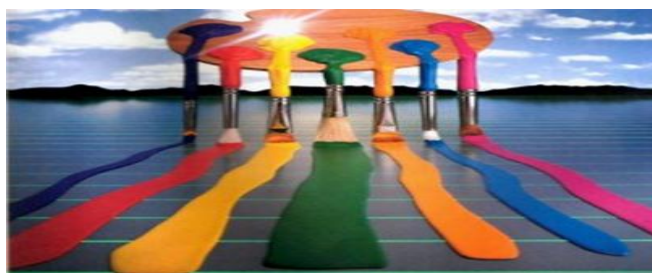
Figura 8- Arteterapia e Psicopedagogia uma dupla que promete