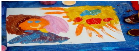
Figura 2- Pitando a aprendizagem