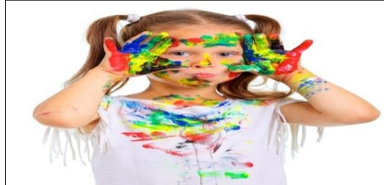
Figura 5- Arteterapia