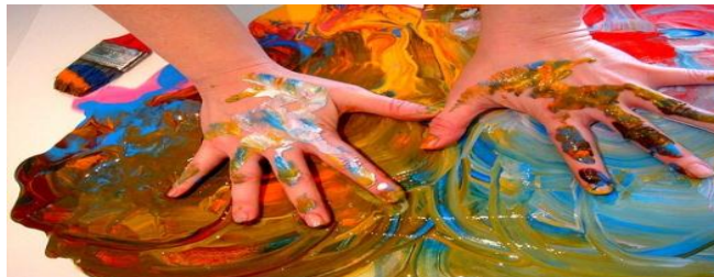
Figura 7- Arte e educação