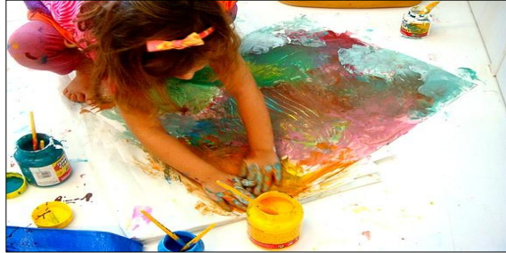
Figura 1- Arteterapia em fotos