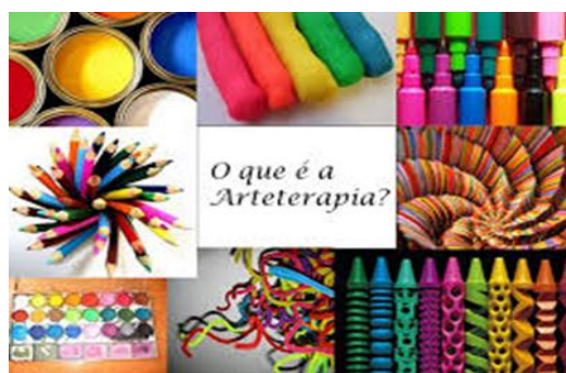
Figura 6- O que é Arteterapia?