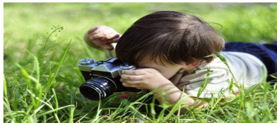
Figura 13- Meu olhar sobre o mundo