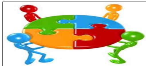
Figura 4- A intervenção

Fonte: http://www.nuape.ct.utfpr.edu.br/