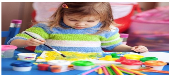
Figura 12- Pintando