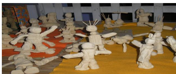
Figura 11- Autoconhecimento através da argila