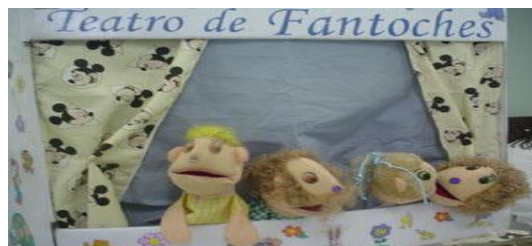
Figura 14: Interpretando