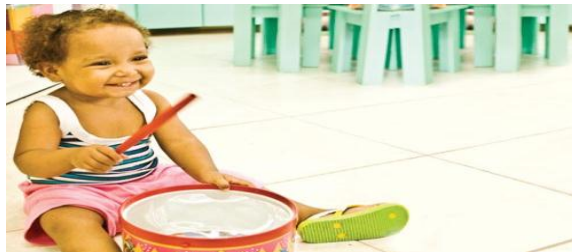
Figura 16- Fazendo música