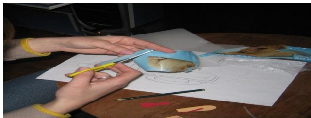
Figura 10- ligar uma coisa com a a outra