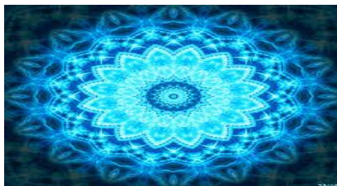
Figura 15- Mandala