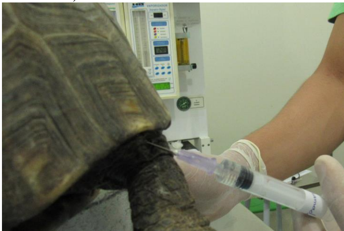
Figura 5 - Administração de tramadol por via subcutânea em Jabuti-piranga ( Chelonoidis carbonaria )