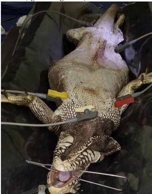
Figura 7 – Posicionamento dos eletrodos durante monitoração eletrocardiográfica em Iguana-verde ( Iguana iguana )

O animal foi mantido em colchão térmico e monitorado durante todo o procedimento cirúrgico, com doppler ultrassônico em altura de carótida e monitor multiparamétrico Dixtal® modelo 2022, fornecendo FC e traçado eletrocardiográfico por meio da colocação dos eletrodos amarelo e vermelho nas dobras de pele das axilas esquerda e direita, respectivamente e os eletrodos verde e preto nas dobras de pele da região das coxas esquerda e direita, respectivamente e o branco na região peitoral (Figura 7); a FR foi monitorada por meio de observação dos movimentos no gradil costal e balão anestésico.