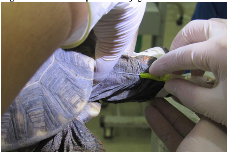
Figura 2 – Cateterização da veia jugular direita em Jabuti-piranga ( Chelonoidis carbonaria )