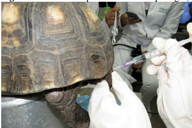
Figura 4 - Anestesia epidural em Jabuti-piranga ( Chelonoidis carbonaria )