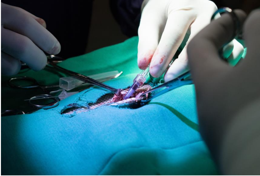
Figura 6 - Cateterização da veia abdominal ventral em Iguana-verde ( Iguana iguana )