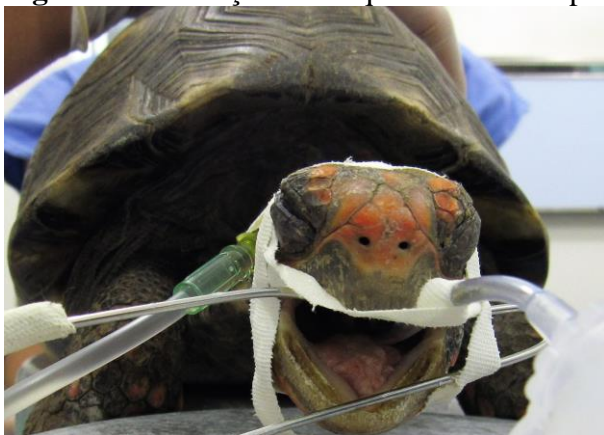
Figura 3 - Intubação orotraqueal em Jabuti-piranga ( Chelonoidis carbonaria )