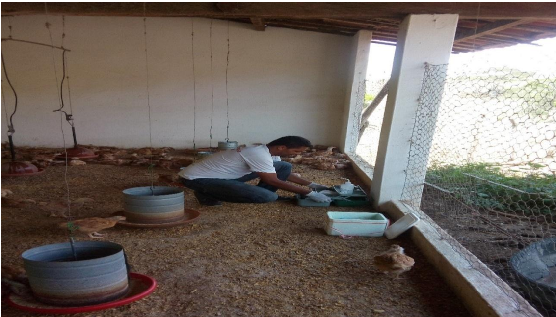
Figura 1. Foto da coleta de amostras de fezes em um dos galpões que faz parte da Cooperativa Paraibana de Avicultura e Agricultura Familiar – COPAF.

Foram realizadas 6 visitas para coleta de fezes de galinhas. Em cada uma delas, coletou-se 6 amostras de fezes totalizando 36 amostras. Cada amostra correspondeu a um “pool” de suabes (umedecidos em água peptonada) de fezes cecais frescas do lote examinado (figura 1). Os suabes foram colocados em um recipiente de vidro contendo 35 mililitros (mL) de Água Peptonada Tamponada a 1% v/v (APT 1%). Após a colheita o frasco foi armazenado em uma caixa térmica com gelo.