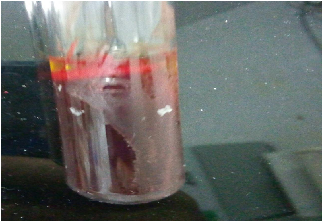
Figura 2. Foto de uma amostra de sangue coletada no abatedouro, com presença de retração do coágulo para a separação do soro.

Foram colhidas amostras de sangue de 40 aves de mesma idade, através da sangria na hora do abate. Em média foram coletados dois mL de sangue de cada ave (figura 2). Esse volume foi então transferido para tubos de vidro com tampas. As amostras foram acondicionadas em caixa isotérmica e, em seguida, transportadas ao laboratório de medicina veterinária preventiva.