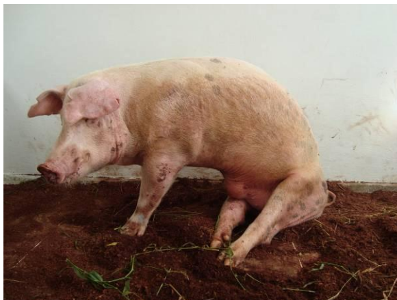
Figura 3. Suíno, macho, adulto com lesão traumática vertebral, em posição de cão sentado.