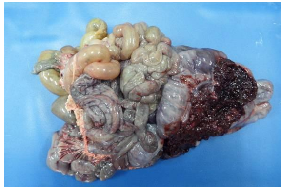
Figura 2. Colón de um leitão acometido por Salmonelose, caracterizado por colite necrohemorrágica difusa acentuada.