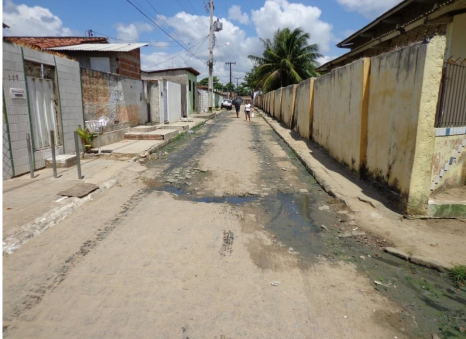
Figura 7 - Os dejetos das residências correm a céu aberto, sem sistema de esgotamento sanitário, essa cena se torna comum no Mario Andreazza, Rua professor Antônio Gomes/bairro do M. Andreazza – Bayeux- PB.

A figura7 retrata bem o descaso evidente do poder público no município, uma realidade que só pode ser apurada no trabalho de campo, que acaba se tornando palco e nós a platéia, ávidos por um final feliz, onde os problemas se resolvam. Dos 70 moradores do bairro que tive a oportunidade de entrevistar, de conversar, 100% não pagam IPTU (imposto predial e territorial urbano), 100% pagam energia, cuja cobrança e todos os custos de instalação provem da ENERGISA PARAÍBA – DISTRIBUIDORA DE ENERGIA S/A, e 100% não pagam água, aqui cabe uma reflexão, ou a PREFEITURA e a CAGEPA (Companhia de Água e Esgotos da Paraíba) são muito lentos ou a ENERGISA é muito rápida e eficiente em prestar o seu serviço.