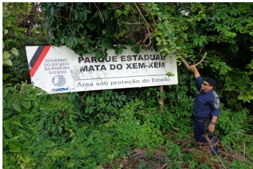
Figura 4- Parque estadual mata do Xém-Xém, reserva florestal de regime de proteção permanente (APP), sob fiscalização da sudema e órgãos de segurança publica municipal, cidade de Bayeux, bairro do Mario Andreazza. Fonte: Do autor, outubro de 2013.

Seu nome foi em homenagem ao militar e político Mário Andreazza, que entre outras obras, foi responsável pela Rodovia Transamazônica, BR-230, que corta a cidade e limita o bairro ao norte; ao sul limita-se com a reserva ambiental Mata do Xém-Xém, que esta localizada na micro região de João Pessoa, no município de Bayeux é possui uma área de 182 hectares; o acesso a mata do Xém-Xém se da através da via principal do bairro M. Andreazza(conhecida como rua larga), após se chegar a ela pelas rodovias BR 230, 101 e PB 042. A mata do Xém-Xém é caracterizada pela formação da floresta subperenifólia (Vegetação constituída por árvores sempre verdes, detentoras de grande número de folhas largas e troncos relativamente delgados, densa, e o solo apresenta-se coberto por camada de húmus.) costeira com uma fisionomia exuberante. Associada a esta formação florestal, encontra-se a mata de Restinga.