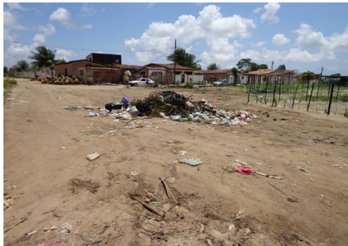
Figura 14 – Aglomerado denominado de conjunto Mariz, compreende a parte alta do bairro, pode-se ver na foto um monte de lixo, tendo em vista a falta de coleta periódica, quando os moradores locais não agüentam mais o mau cheiro no local, acabam por incendiar esse lixo acumulado, bairro do M. Andreazza, Bayeux/PB. Fonte: Do autor, outubro de 2013.

O que me pareceu também claro, É a falta de conscientização por parte da população local, pois em alguns aglomerados como o Centro ou Rua Larga, onde existe uma coleta periódica que ocorre três vezes por semana, os moradores ainda depositam o lixo na esquina do PSF central (Posto de Saúde da Família), é em fragmentos de terrenos baldios que ainda existem ao longo da rua larga.