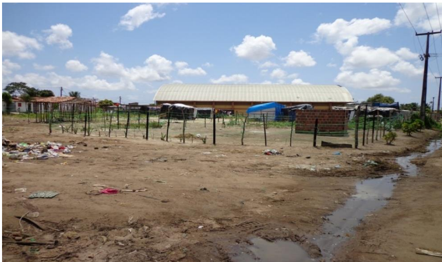
Figura 3- Situação que reflete o descaso evidente do poder público, acampamento de população Bayeuxenses sem teto, instalado de forma precária, ao redor de uma quadra de futsal pública, que foi construída no meio do nada, população sem nenhum monitoramento ou promessa de socorro por parte do poder publico e do serviço social, bairro do M. Andreazza, BAYEUX-PB. Fonte: Do autor, outubro de 2013.

Os bairros do Comercial Norte, Rio do Meio e Mario Andreazza destoam dos vizinhos fronteiriços J. Aeroporto e A. da B. Vista, nas várias visitas realizadas durante esse trabalho e principalmente no dia a dia durante o meu trabalho (emprego), eu vislumbro um descaso e esquecimento impar com esses bairros, aqui infelizmente não vou poder me aprofundar a respeito do aglomerado urbano e problemático do Comercial Norte e Rio do Meio, pois escolhi direcionar os meus esforços para o M. Andreazza, foco do meu empenho durante esse trabalho, fica para uma próxima oportunidade uma análise a respeito do C. Norte e Rio do Meio.