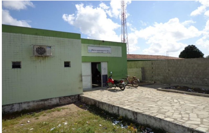
Figura 8 - PSF (posto de saúde da família), unidade II e III, exerce o atendimento a pequenos problemas, na área central do bairro e executa trabalhos de agentes de saúde, na própria residência dos moradores, bairro do M. Andreazza/Bayeux-PB.

Todas essas ocupações se deram a priori em fragmentos de Mata Atlântica, ou seja, os colonizadores dessas terras devastaram a porção frontal de mata que ocupava o talude dos tabuleiros, até a porção onde foi instaurado a APP (Área de Preservação Permanente), Parque estadual mata do Xém-Xém, justamente onde fica localizado o aglomerado denominado de conjunto Mariz, e todos os outros aglomerados dantes descritos aumentaram o entorno do perímetro do bairro, super massificando sua área, que continua a crescer podendo dar origem a novíssimas subáreas, que serão ramificações das já existentes, a seguir apresentarei imagens (fotos), de cada aglomerado que foi possível identificar no M. Andreazza.