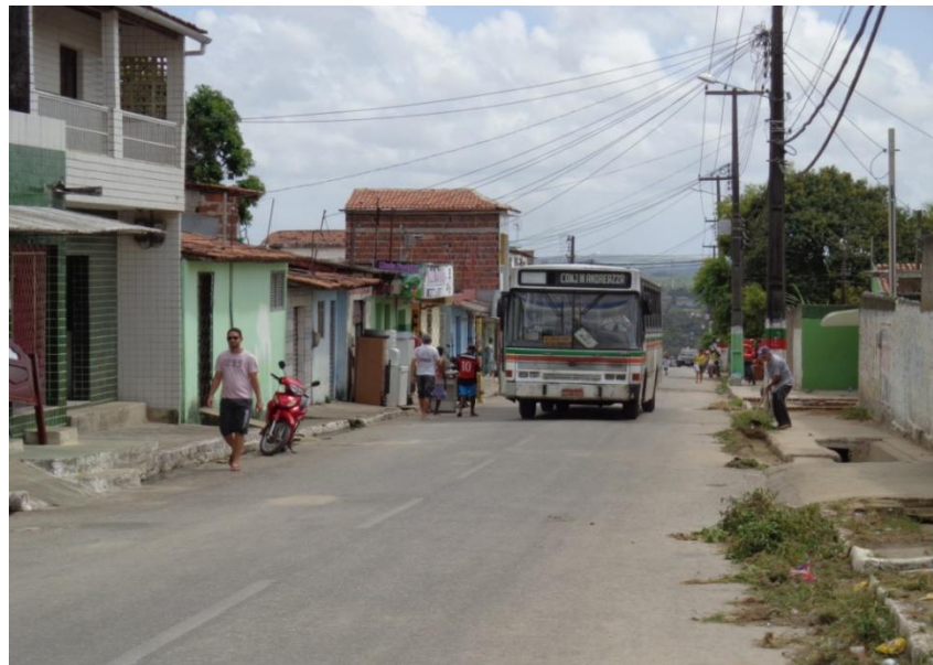
Figura 13 - Aglomerado denominado de Centro ou Rua Larga, situa-se na porção central do bairro e compreende uma rota de ônibus, ponte de referencia, local de comercio e maior movimento, esta avenida denominada de rua larga esta sendo reestruturada, logo será mão única, os veículos só irão subir através dela, e irão descer pela sua rua paralela, projeto esse que tem intenção de dar maior mobilidade ao transito no bairro M. Andreazza, Bayeux/PB. Fonte: Do autor, outubro de 2013.

O comercial Norte (figura 11), esta localizado no limite norte do bairro, onde faz fronteira com uma área de reserva legal (fazenda Santa Paula), que suprimiu o seu crescimento, a fiscalização constante na área da fazenda que e particular, impediu o avanço do aglomerado as áreas de reserva; outra característica marcante deste aglomerado e a presença de travessias estreitas, em certos casos um circuito que só pode ser feito a pé, e eu infelizmente não me atrevi a fazê-lo só.