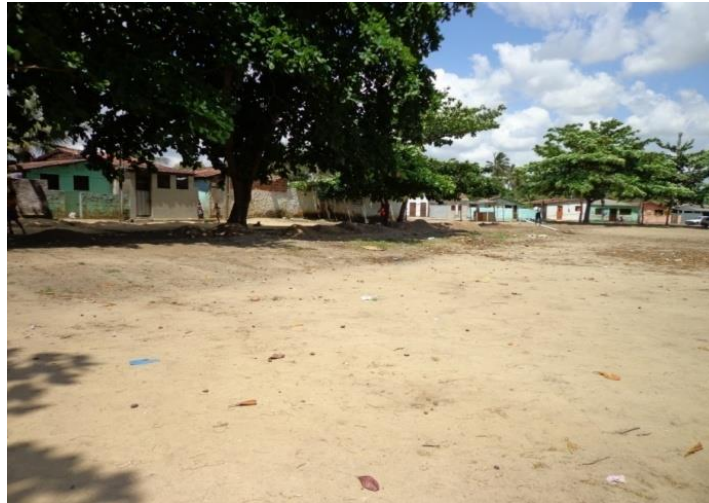
Figura 11 – O aglomerado do campo do Barcelona se situa a leste da porção central do bairro, e compreende um campo de futebol cercado por casas residenciais, casas de alvenaria mais bem simples, sem nenhuma residência que destoe das demais, o que me leva a crer que toda população aqui, está na mesma fahetária de renda mensal, bairro do M. Andreazza/Bayeux-PB.

O aglomerado do campo do Barcelona é segundo os moradores uma das localidades mais esquecidas da prefeitura, onde jamais teve segundo os moradores nenhuma melhoria na infra-estrutura local, não possui calçamento, esgoto, posto de saúde, escola, nessa localidade não existe nada além das moradias, e também não possui condições de tráfego de veículos maiores, o que dificulta o desenvolvimento do comércio local, em entrevista a um morador local, o mesmo me disse “Aqui não há espaço para nada de bom, nem igreja nem prédio público, os jovens daqui não querem nada com a vida além de usar drogas e ficar atoa”, palavras de quem está sentindo há anos o descaso a sua porta.