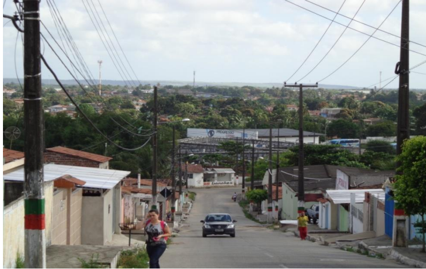
Figura 6 -Rua principal do bairro M. Andreazza, com vista parcial da porção mais baixa da cidade, a planície Fúlvio Marinha.

O 1º gráfico mostra, que esses primeiros habitantes do M. Andreazza, por falta de condições de adquirirem um imóvel na parte mais baixa do município de Bayeux ou ate em João Pessoa, migraram pras margens da BR-230, agora vou inserir o gráfico 2º que trata a respeito da questão da origem da população entrevistada, e tenta vislumbrar a composição humana que compõe este bairro.