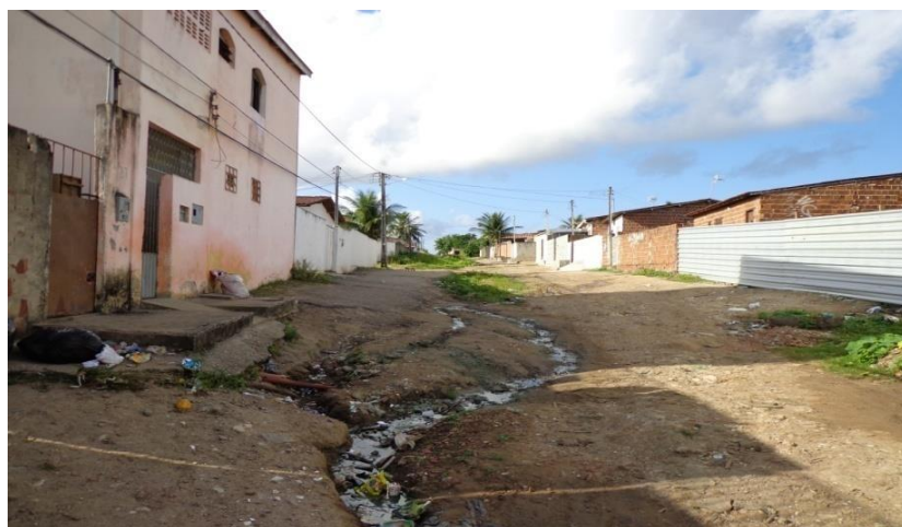
Figura 12 - Aglomerado denominado de comercial Norte, situa-se na porção norte do bairro e compreende uma comunidade onde inexistente toda e qualquer participação do município em favor dos seus moradores, desprovidos de serviços públicos básicos como saúde e escola próximo a suas residências, essa rua se é que pode-se chamar de rua transmite a realidade do bairro do M. Andreazza, rua Santa Maria Euplasia, bairro do M. Andreazza, Bayeux/PB. Fonte: Do autor, outubro de 2013.

O aglomerado do campo do Barcelona é segundo os moradores uma das localidades mais esquecidas da prefeitura, onde jamais teve segundo os moradores nenhuma melhoria na infra-estrutura local, não possui calçamento, esgoto, posto de saúde, escola, nessa localidade não existe nada além das moradias, e também não possui condições de tráfego de veículos maiores, o que dificulta o desenvolvimento do comércio local, em entrevista a um morador local, o mesmo me disse “Aqui não há espaço para nada de bom, nem igreja nem prédio público, os jovens daqui não querem nada com a vida além de usar drogas e ficar atoa”, palavras de quem está sentindo há anos o descaso a sua porta.