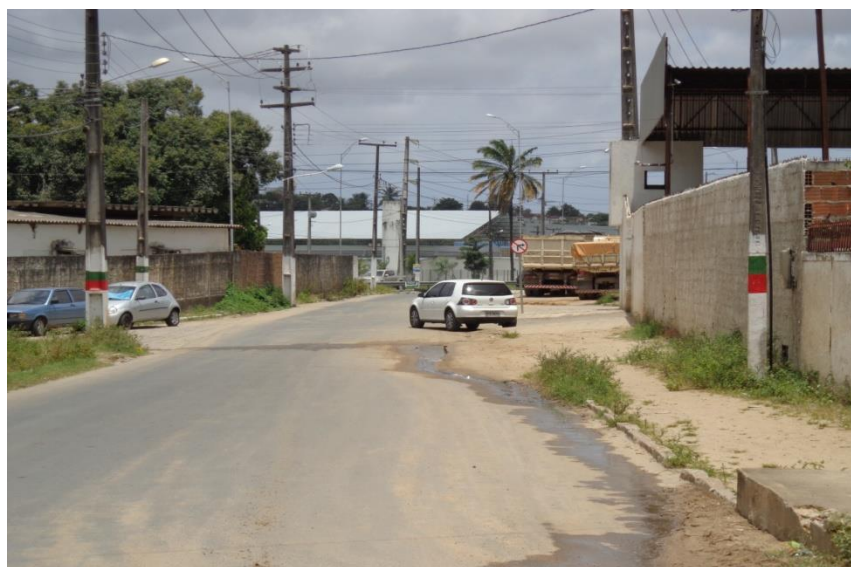
Figura 9 - Aglomerado denominado de Mutirão fica na parte baixa do bairro, margeando a BR 230, percebe-se na foto a parte posterior do posto da PRF (Polícia Rodoviária Federal) e a direita o muro de uma oficina mecânica, bairro do M. Andreazza/Bayeux-PB.

Todas essas ocupações se deram a priori em fragmentos de Mata Atlântica, ou seja, os colonizadores dessas terras devastaram a porção frontal de mata que ocupava o talude dos tabuleiros, até a porção onde foi instaurado a APP (Área de Preservação Permanente), Parque estadual mata do Xém-Xém, justamente onde fica localizado o aglomerado denominado de conjunto Mariz, e todos os outros aglomerados dantes descritos aumentaram o entorno do perímetro do bairro, super massificando sua área, que continua a crescer podendo dar origem a novíssimas subáreas, que serão ramificações das já existentes, a seguir apresentarei imagens (fotos), de cada aglomerado que foi possível identificar no M. Andreazza.