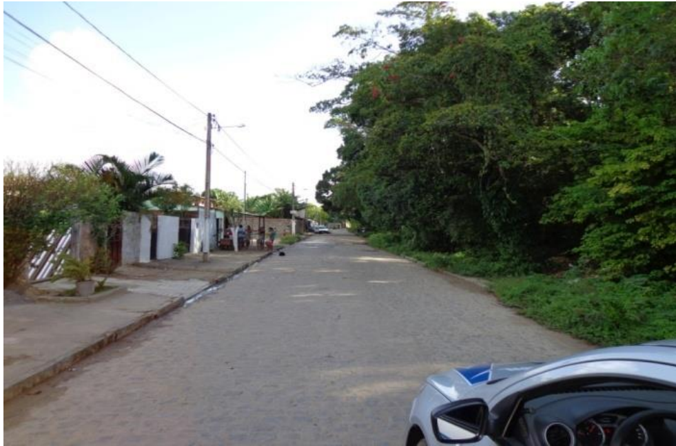
Figura 10 - Aglomerado denominado de conjunto Mariz, compreende a parte alta do bairro, pode-se ver na foto, à esquerda, casas um tanto rústicas, mas bem acabadas de alvenaria, e um grupo de moradores conversando e a direita a APP, Mata do Xém-Xém, sob fiscalização permanente da SUDEMA, bairro do M. Andreazza/Bayeux-PB. Fonte: Do autor, outubro de 2013.

O aglomerado denominado de mutirão e a porta de entrada do bairro M. Andreazza, para aqueles visitantes que vem pela BR 230; segundo os moradores locais e a própria história foi onde se deu a primeira ocupação e onde o bairro nasceu mesmo sendo o berço do M. Andreazza esse aglomerado não conta com nenhum posto de saúde, forçando seus moradores a se deslocarem para a parte mais alta do bairro para procura de atendimento.