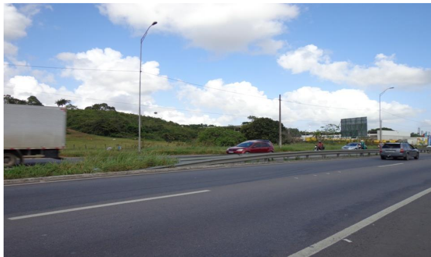
Figura 2 -BR 230, entrada para cidade de Bayeux, vista parcial dos baixos planaltos costeiros-tabuleiros, limites municipais João Pessoa/Bayeux.

resultou, e para o que evoluiu essa primeira ocupação. Historicamente, a ocupação das terras que hoje compõem o município de Bayeux, remonta ao processo de fundação da cidade de Nossa Senhora das Neves em 1585, que mais tarde passaria a ser chamada de Filipéia de Nossa Senhora das Neves (MELLO, 2002), constituindo hoje a capital do estado, João Pessoa. Assim, com a colonização da Capitania da Paraíba, a área desse município veio a se constituir como passagem para o interior da capitania, quando foi aberto um caminho em meio à vegetação de mangue e através da mata nativa (Mata Atlântica).