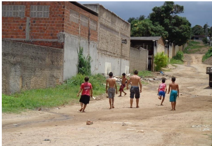
Figura 5- A foto mostra crianças brincando de travinha, jogo onde se bota duas pedras uma paralela a outra para simular um gol; essa foto foi tirada as 10h e 30 minutos da manhã de um dia de terça feira, é retrata bem a ociosidade e a exposição das crianças deste bairro, Rua José de Alencar, bairro do M. Andreazza/BAYEUX-PB. Fonte: Do autor, outubro de 2013.

Desta forma seguindo os preceitos de SEABRA (2003), me vejo na obrigação de descrever e desvelar, a quem de direito (população), seja pontos positivos ou negativos, todas as especificidades observadas e absorvidas neste espaço de análise, me pondo na condição de delimitar este determinado bairro e exaurir todos os recursos dos quais disponho para tal, mais aspectos serão avaliados desta forma mais sucinta nos capítulos posteriores.