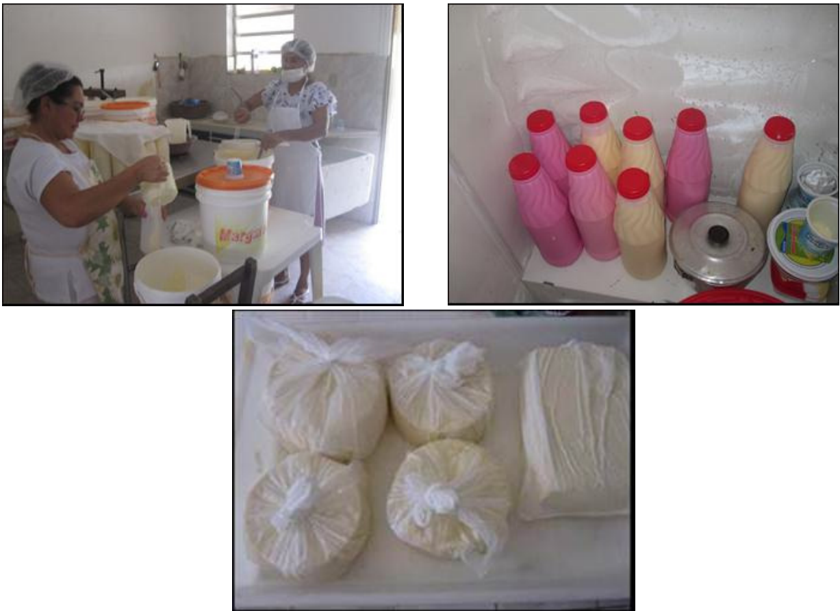
Figura A - Associação dos Bovinocultores de Araripe. Produção: queijo e iogurte

Os agricultores fornecedores para a alimentação escolar organizam-se sob duas formas, com DAP física (individuais) ou com DAP jurídica (associados). Existem atualmente três associações de agricultores familiares: Associação dos Bovinocultores de Araripe, produzindo queijo e iogurte em mini-fábrica de alimentos, localizada na cidade (Figura A); a Associação dos Agricultores do Sitio Baixio dos Ramos (Figura B), produzindo sequilho em mini-fábrica, localizada na Zona Rural e a Associação dos Produtores da Agropecuária Orgânica e Agroindústria de Araripe (Figura C), produzindo bolos e tapiocas em mini-fábrica, localizada na cidade e os demais como pão-de-queijo, sequilho, pão-de-ló, cheiro-verde, pimentão, maracujá, alface, macaxeira, mamão e tijolinho de doce de leite são produzidos nas casas dos associados. As carnes de caprino e de frango são advindos de agricultores não associados.