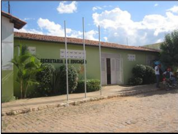
Figura L - Secretaria de Educação