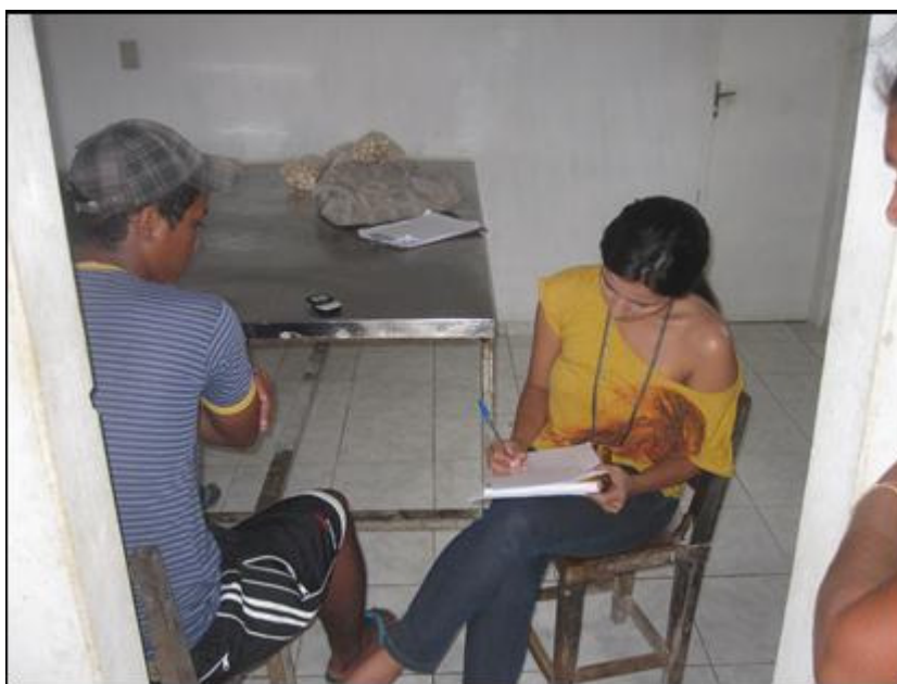
Figura O - Entrevista sendo realizada em mini-fábrica de alimentos

Além das entrevistas procurou-se levantar dados a partir de observações locais, por meio de registro em Figura O - Entrevista sendo realizada em mini-fábrica de alimentos mento permitiu captar informações e fenômenos que não seriam capazes de serem adquiridos por meio das entrevistas, permitindo uma apropriação da realidade a que se propunha discutir (MINAYO, 2010). As observações foram feitas em dias distintos na escola, no momento da entrega dos gêneros alimentícios da agricultura familiar pelo responsável, da confecção e distribuição das refeições, verificando as relações, os cenários, os comportamentos dos alunos, diretora e merendeiras. A observação também ocorreu nos locais de produção dos agricultores familiares, tendo o mesmo objetivo anterior. Além do diário de campo, outros recursos