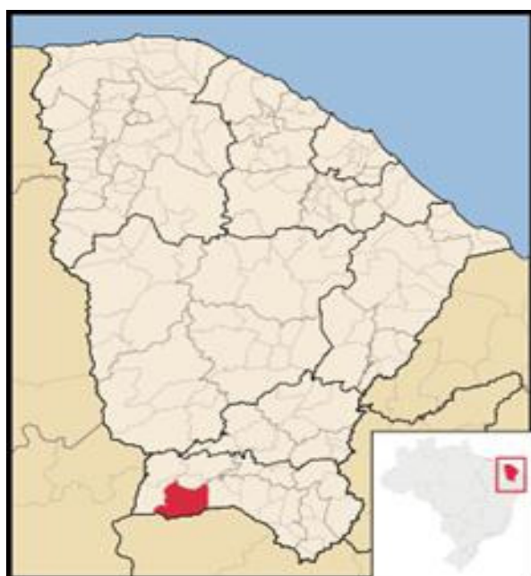
Figura K - Localização do município Araripe no Estado do Ceará

A pesquisa foi realizada em Araripe-Ce (Figura K) na Secretaria de Educação e na Secretaria de Meio Ambiente e Desenvolvimento Agrário de Araripe-Ce (Figura L). Esse município encontra-se localizado na região Nordeste, Estado do Ceará (Figura M). O clima predominante de Araripe é o tropical semi-árido. Possui uma população estimada de 20.613 habitantes (IBGE, 2010). Os cultivos agrícolas predominantes são algodão arbóreo e herbáceo, banana, milho e feijão. Na pecuária destacam-se bovinos, suínos e avícolas. Este fora escolhido como cenário de investigação por ter sido o primeiro município do Nordeste a adquirir produtos da agricultura familiar conforme Resolução nº 38 do FNDE/2009. Além disso, a experiência de compra e venda de produtos da agricultura familiar já havia sido iniciada desde 2007 por meio do Programa de Aquisição de Alimentos- PAA nesta localidade.