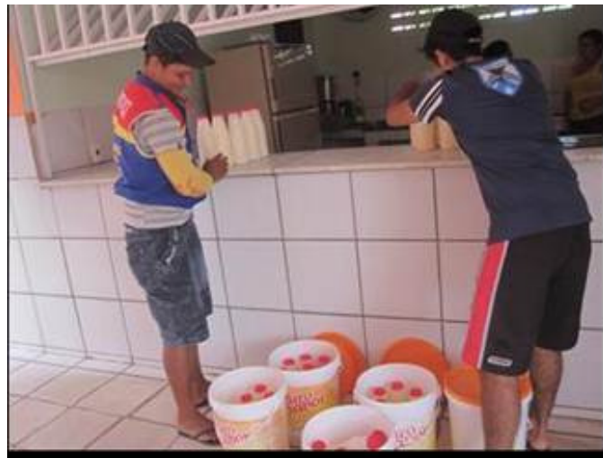
Figura H - Distribuição do iogurte da agricultura familiar na Escola Modelo