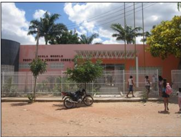
Figura N - Escola Profa. Cícera Germano – Escola Modelo

Com relação ao total de escolas municipais, Araripe apresenta vinte e uma situadas nas Zonas Urbana (dez) e Rural (onze), sendo todas abastecidas pelos produtos da agricultura familiar. Destas, a Escola Municipal Modelo Prof ª Cícera Germano (Figura M) foi a selecionada para ser realizada a pesquisa tendo em vista alguns critérios como, o Programa de Alimentação Escolar funcionar regularmente, no sentido de seguir os cardápios confeccionados e orientados pela Nutricionista e o maior número de alunos matriculados em detrimento das demais. Além disso, soma-se a escolha da escola, o fato da mesma estar localizada na área urbana, estando próximo das Associações de Agricultores Familiares e das Secretarias de Agricultura e de Educação, o que veio a facilitar o deslocamento da pesquisadora até esses locais. A escola oferece as seguintes modalidades de ensino: Ensino Fundamental I (764 alunos), Fundamental II (645 alunos) e Educação de Jovens e Adultos (137 alunos). Totalizando 1546 alunos matriculados.