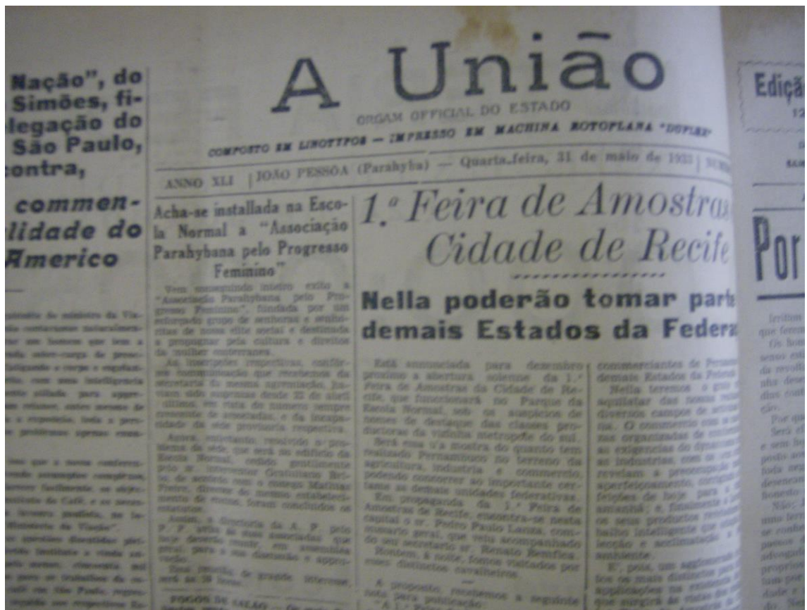
Foto 02: Artigo com a publicação da instalação da Associação Paraibana pelo Progresso Feminino.

O principal objetivo da Federação Brasileira pelo Progresso Feminino era o reconhecimento dos direitos da mulher, entendiam que para esses direitos serem reconhecidos, era preciso a elevação do nível de instrução feminina. Baseado neste princípio o primeiro artigo do Estatuto da Federação Brasileira defende à promoção da educação da mulher, enfatizando que não avançaria em qualquer área, se antes não lhe fosse dada a educação plena (MACHADO, NUNES.2007).