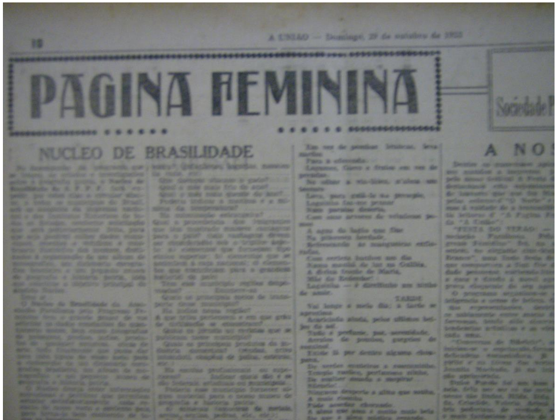
Foto 01: Foto da conquista da Página Feminina pela APPF e a publicação da fundação dos núcleos.

Nesta perspectiva, acreditamos que para compor uma parcela dessa história, os artigos do Jornal A União somam novas orientações metodológicas que permitem realizarmos: