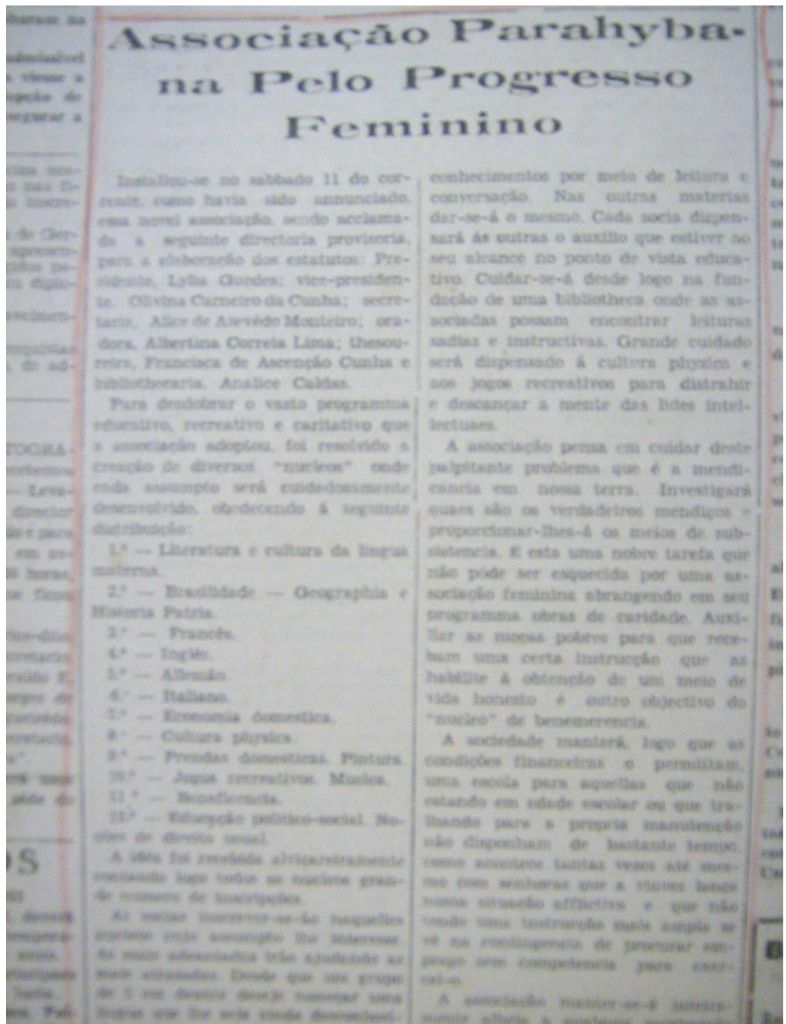
Foto 03: Artigo com a distribuição da fundação dos núcleos educativos.

Fica clara a preocupação da Associação com a educação feminina, visto que houve a fundação dos núcleos para as moças pobres com o intuito de formação intelectual para o