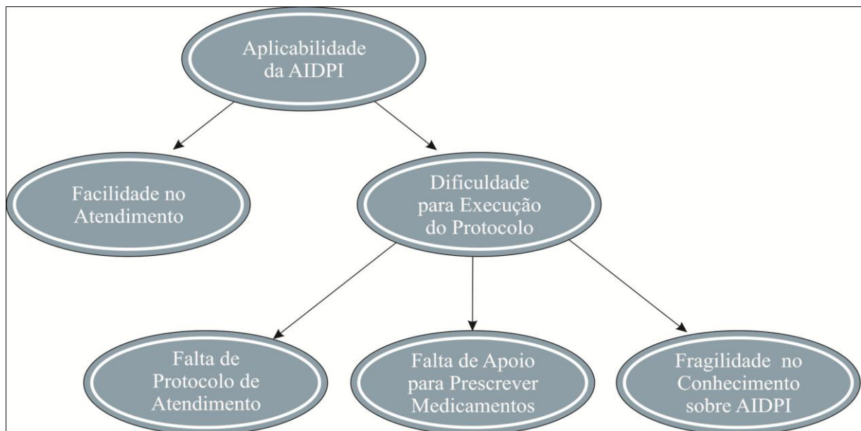
Figura 3 - Representação gráfica das categorias empíricas, Campina Grande, 2012.

Para melhor compreensão das categorias que surgiram, procurou-se organizar um fluxograma, onde foram analisados os discursos e estabelecido como tema central a aplicabilidade do AIDPI como palavra norteadora (FIGURA 1).