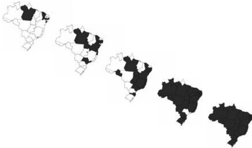
Figura 1 - Fases da Implantação de AIDPI no Brasil.