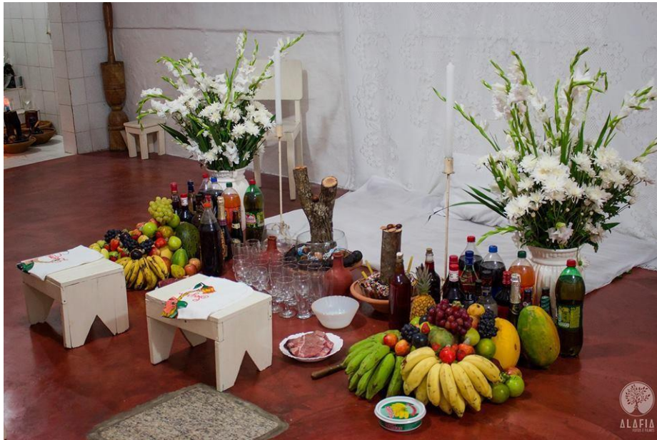
Figura 03: Preparação para bori de Jurema.

Há, todavia, entendimentos no sentido da desnecessidade de um ritual de iniciação na Jurema, e que ela seria um dom inato. Barros (2011, p. 92), em sua pesquisa de doutorado realizada em Campina Grande, registrou a fala de um juremeiro campinense que defendia este ponto de vista: