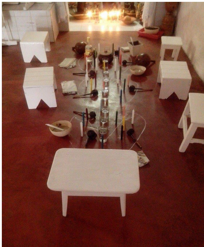
Figura 06: preparação para a Jurema de chão.

Também não se utiliza os ilús (tambores), e a sua duração é menor em comparação com os toques . Ocorre, em geral, poucas vezes no ano, uma vez que tem propósitos