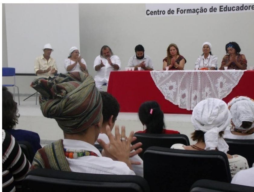
Figura 09: reunião com representantes dos terreiros e do poder público sobre os casos de intolerância religiosa em Campina Grande (agosto/2015). Fonte: autor.

Já as políticas públicas em direitos humanos consistem, sinteticamente, em ações levadas a cabo pelo poder público com o evidente intuito de promover os direitos humanos em seus vários aspectos e dimensões, nas diversas áreas de atuação do Estado. Nesse sentido, é a afirmação de Dworkin (2002, p. 36) de que políticas (dentre as quais as públicas) são: