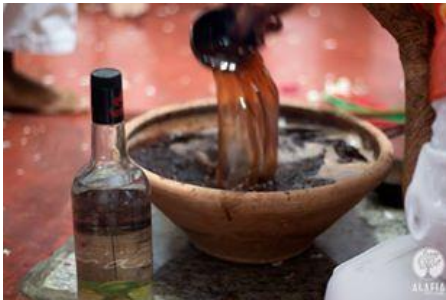
Figura 02: Jurema-bebida servida no Toré do Mestre Félix.

A bebida é outro aspecto do complexo místico-semiótico da jurema que se revela polissêmico, diante da forma como ela se manifesta em cada vertente do culto. Na Jurema indígena, permanece o uso da beberagem com propriedades enteógenas, como assim era desde a época pré-colonial. Já no culto praticado nos terreiros, a bebida não manifesta um potencial enteógeno, assemelhando-se mais a um licor (BARROS, 2011).