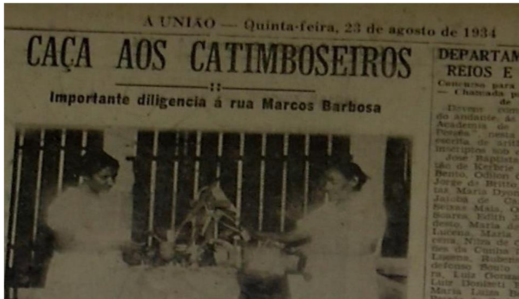
Figura 07: Manchete no jornal oficial do Estado da Paraíba dando conta da perseguição institucional à Jurema Sagrada nos anos 30.

A previsão de liberdade religiosa em decorrência da laicidade do Estado, portanto, não alcançou a todos. Uma vez superado o discurso da religião oficial, permaneceram vivos e institucionalizados os discursos que criminalizavam as práticas religiosas de matriz afro-ameríndia e aqueles que a tipificavam enquanto doença ou fetichismo, o que legitimava tanto a perseguição policial quanto a descredibilização, a exotização ou mesmo a imposição de um tratamento psiquiátrico para tais religiões e seus adeptos, como já discutido.