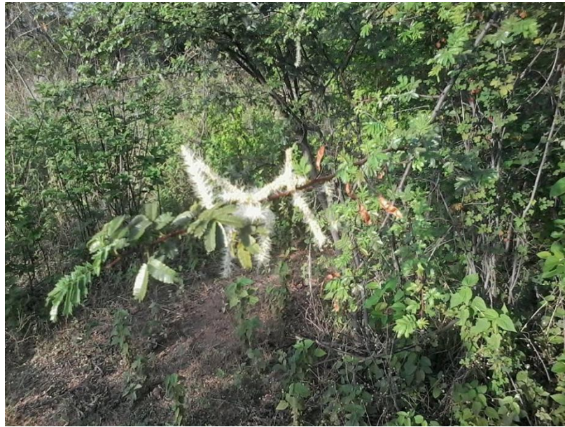
Figura 01: Jurema florida.

A árvore (na verdade, uma série de espécies, dentre as quais a mimosa hostilis benth , jurema preta, a mais referenciada no campo) é um arbusto, da família das leguminosas, bastante comum na caatinga nordestina, conhecida pela marcante quantidade de espinhos em seus ramos e pelas propriedades medicinais (utilizada no tratamento contra dores e inflamações) e enteógenas, ambas já exploradas desde a era pré-colombiana pelas populações indígenas nativas do nordeste brasileiro 13 . O seu uso é mencionado em diversos documentos, que vão desde autos da inquisição do século XVIII, relatos etnográficos e até mesmo em obras de ficção, como Iracema , de José de Alencar.